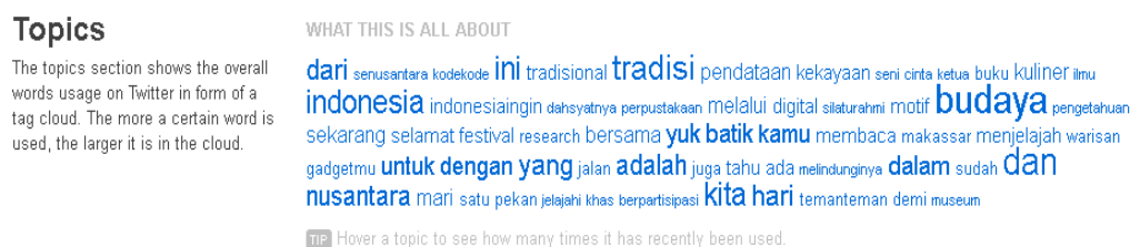
Gambar 2. Subjek atau kata yang sering diposting oleh akun twitter @infobudaya

Analisis yang dilakukan menggunakan alat atau toolsfoller.me yang merupakan salah satu alat yang dapat digunakan untuk menganalisis konten twitter, menunjukkan subjek, topik atau kata yang sering diposting pada akun @infobudaya ini sebagai berikut: