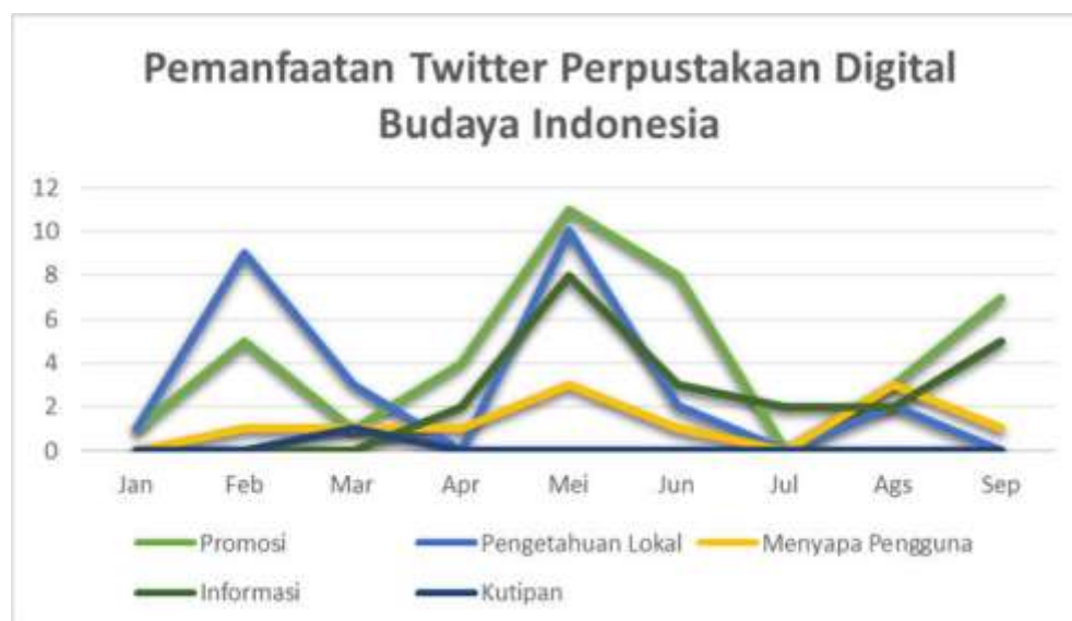
Gambar 1. Pemanfaatan Twitter PDBI @infobudaya

Berdasarkan tabel tersebut, konten paling banyak yang dibagikan twitter @infobudaya sepanjang tahun 2018 adalah promosi kegiatan ataupun promosi kegiatan yang berkaitan dengan Perpustakaan Digital Budaya Indonesia (40 kali atau 39,60%), Pengetahuan lokal berupa informasi terkait konten perpustakaan seperti info kuliner, pakaian tradisional, tradisi unik dan sebagainya (27 kali atau 26,73%), informasi umum yang memuat kegiatan yang sedang dilakukan perpustakaan, live report dan informasi lainnya terkait budaya ataupun perpustakaan sebanyak 22 kali atau 21,78%, menyapa pengguna atau berinteraksi dengan pengikut sebanyak 11 kali atau 21,78% serta kutipan atau quotes sebanyak 1 kali atau 0.09%.