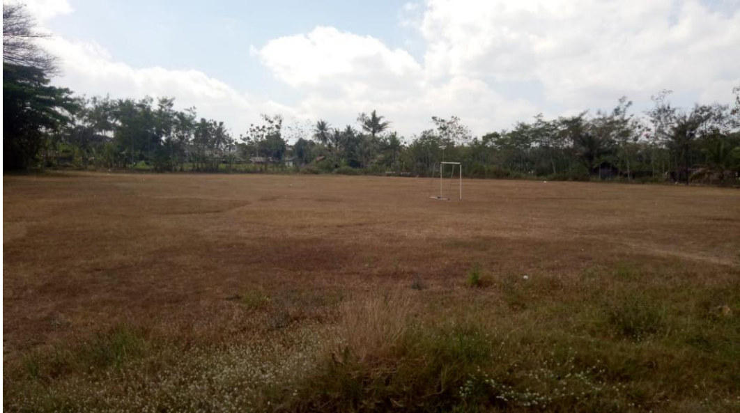
Lapangan Sepak Bola