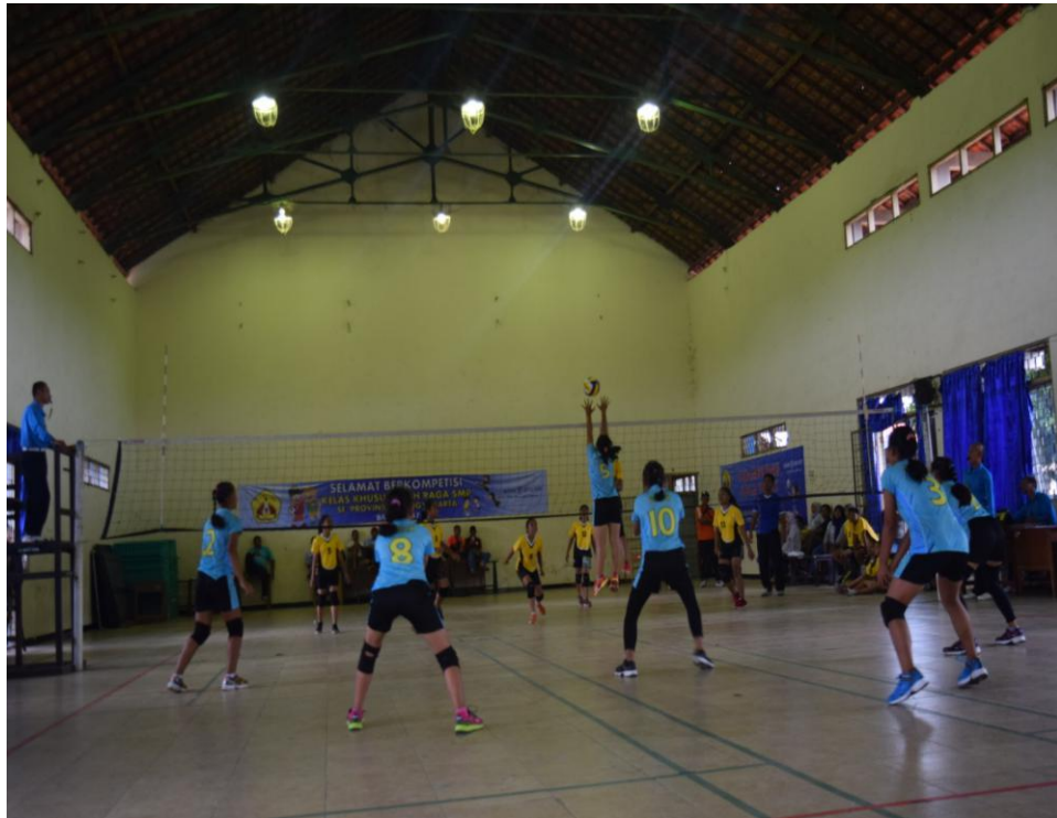
Voly Putri Juara III