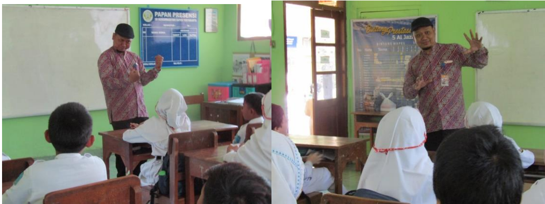
Narasumber memberi penjelasan dan peragaan bercerita