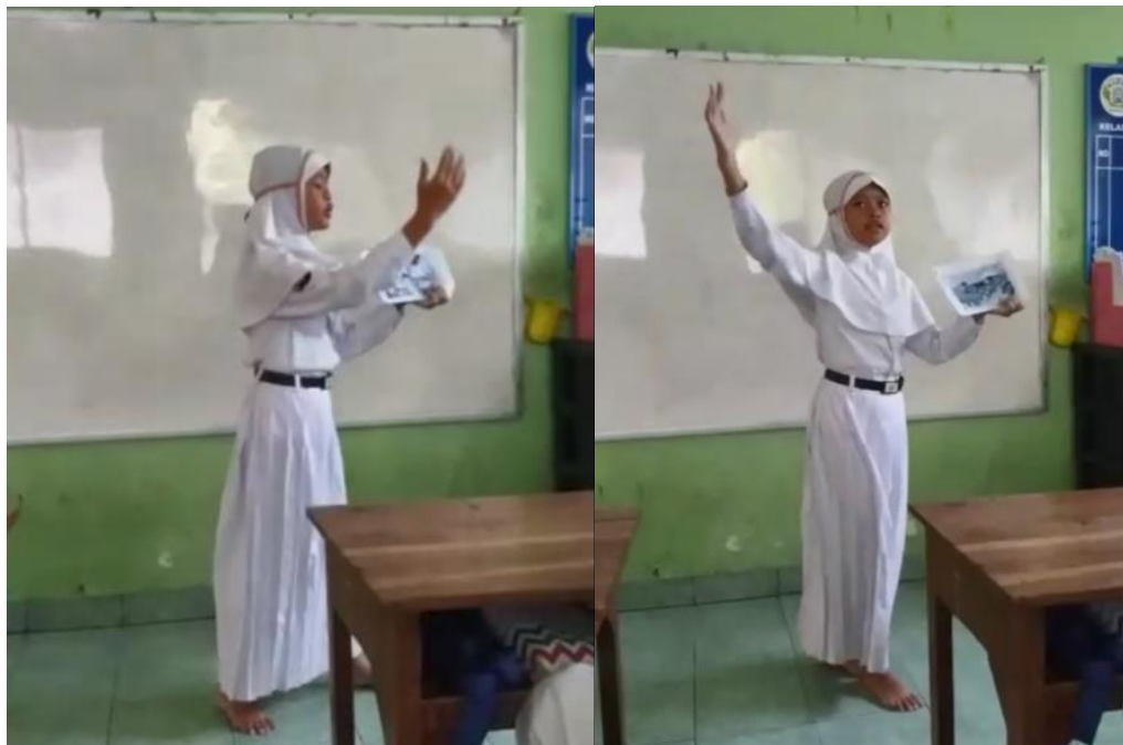
Siswa presentasi bercerita