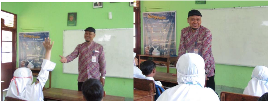
Siswa bertanya pada narasumber dan narasumber menanggapi pertanyaan