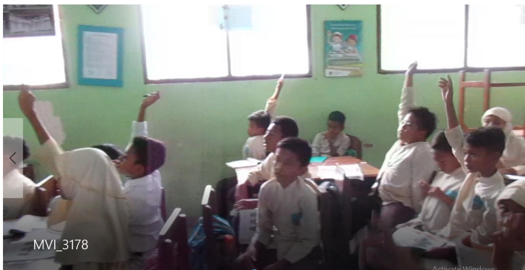
Siswa dan guru tanya jawab tentang penyusunan naskah cerita