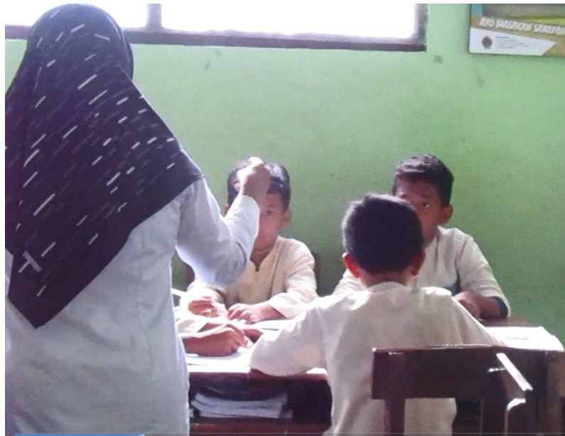
Guru membimbing siswa dalam latihan