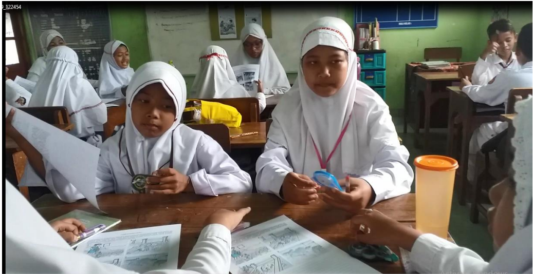
Siswa berdiskusi menyusun naskah cerita