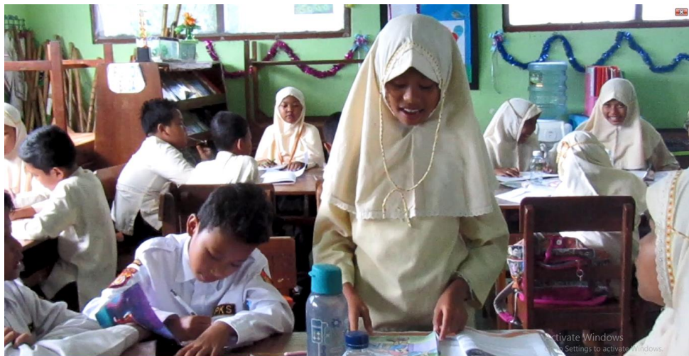
Siswa berlatih bercerita dalam kelompoknya