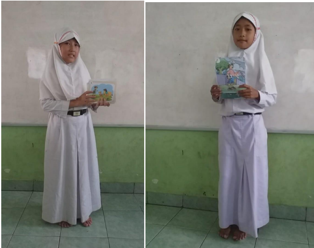
Siswa presentasi bercerita