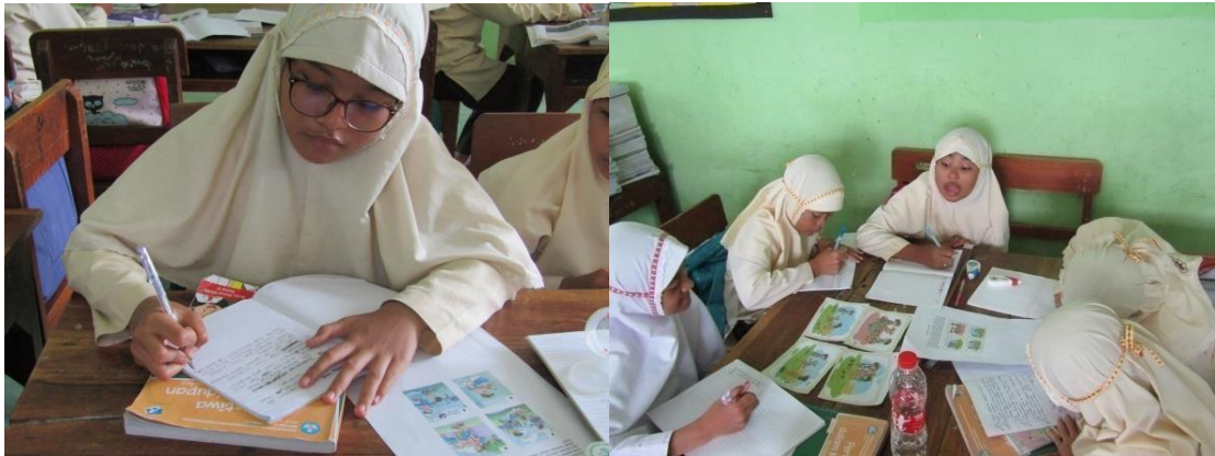
Siswa berdiskusi menyusun naskah cerita