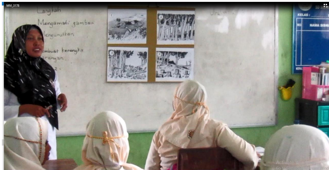
Guru memberikan penjelasan dan siswa memperhatikan penjelasan penyusunan naskah cerita