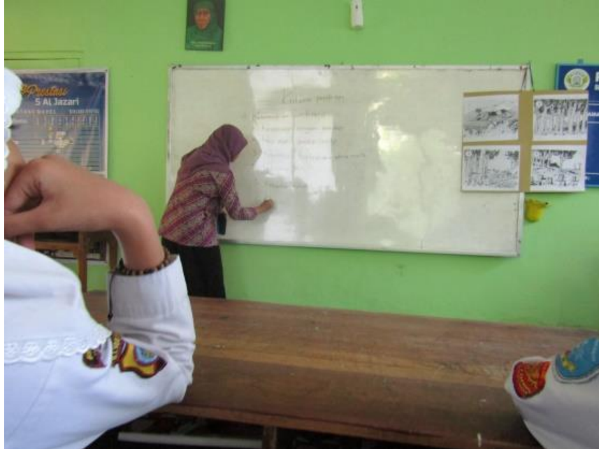
Guru memberikan penjelasan dan siswa memperhatikan penjelasan penyusunan naskah cerita