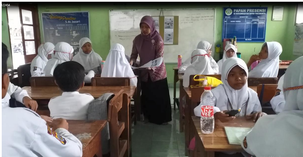
Guru membagikan gambar seri