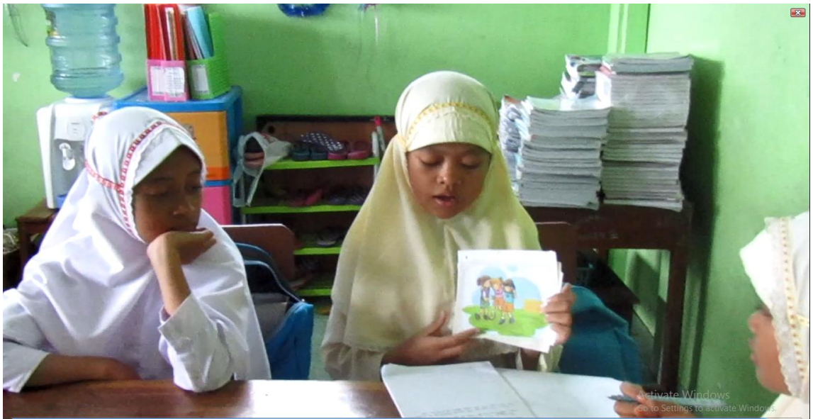
Siswa berlatih bercerita dalam kelompoknya