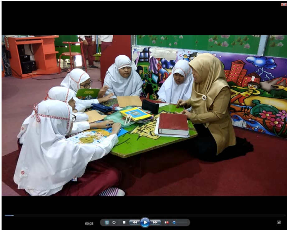
Gambar 1 Uji Coba Kelompok kecil