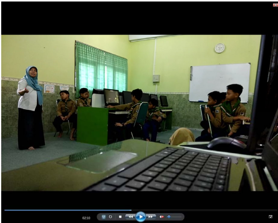
Gambar 2 Penjelasan Cara Mencari Informasi