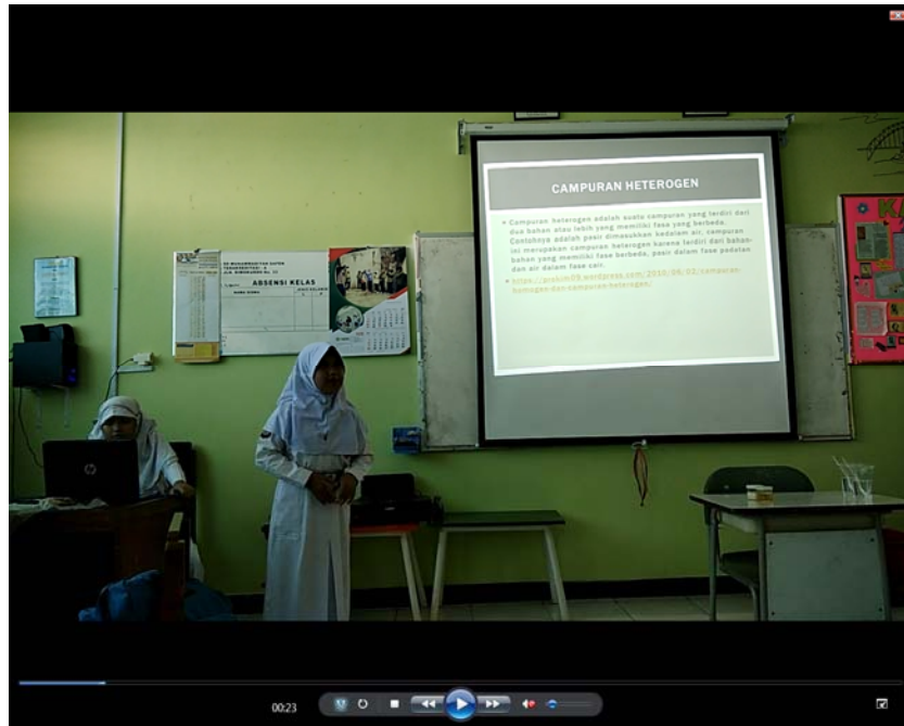
Gambar 5 Komunikasi