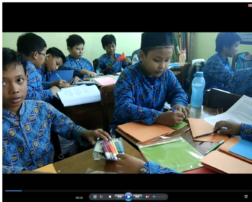
Gambar 4 Pembuatan Buku Kecil