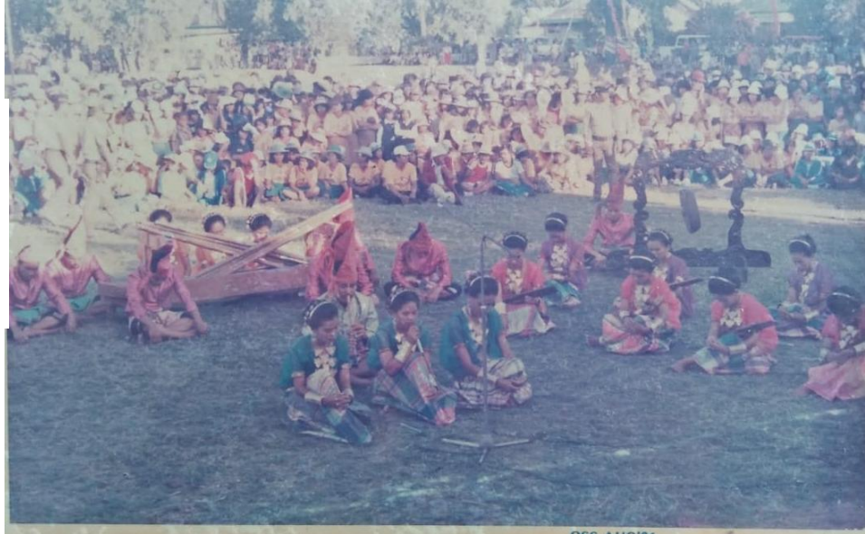
Gambar 1. Acara Mappadendang dengan pertunjukan Simponi Kecapi

Masyarakat Bugis di Kabupaten Sulawesi Selatan menggunakan pertunjukan Simponi Kecapi sebagai musik pengiring tari-tarian seperti tari pa'duppa (penjemput tamu), bosara' (tari yang menggunakan bosara/alat menyimpan jamuan makanan, pattennung (Menenun). Sehingga Simponi Kecapi juga dianggap sebagai lagu pengiring tari yang dilaksanakan ketika dilaksanakan acara seperti penjemputan tamu pemerintahan dengan tari bosara'atau pa'duppa , penjemputan tamu dalam acara pernikahan dengan tari pa'duppa , maupun tari kreasi lainnya.