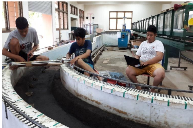
Gambar 48. Pembacaan Kedalaman Gerusan menggunakan Distometer