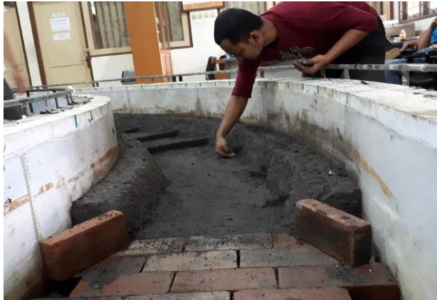
Gambar 49. Pemasangan Perkuatan Pada Belokan