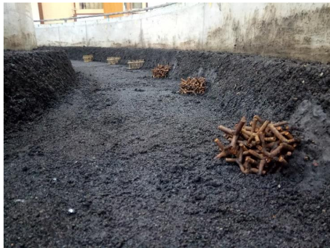
Gambar 50. Tetrapod Pada Model Sungai