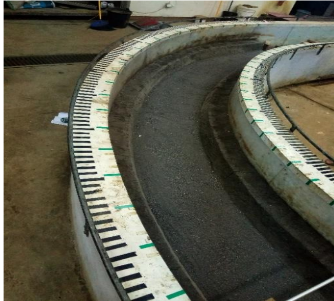
Gambar 47. Flume Model Sungai