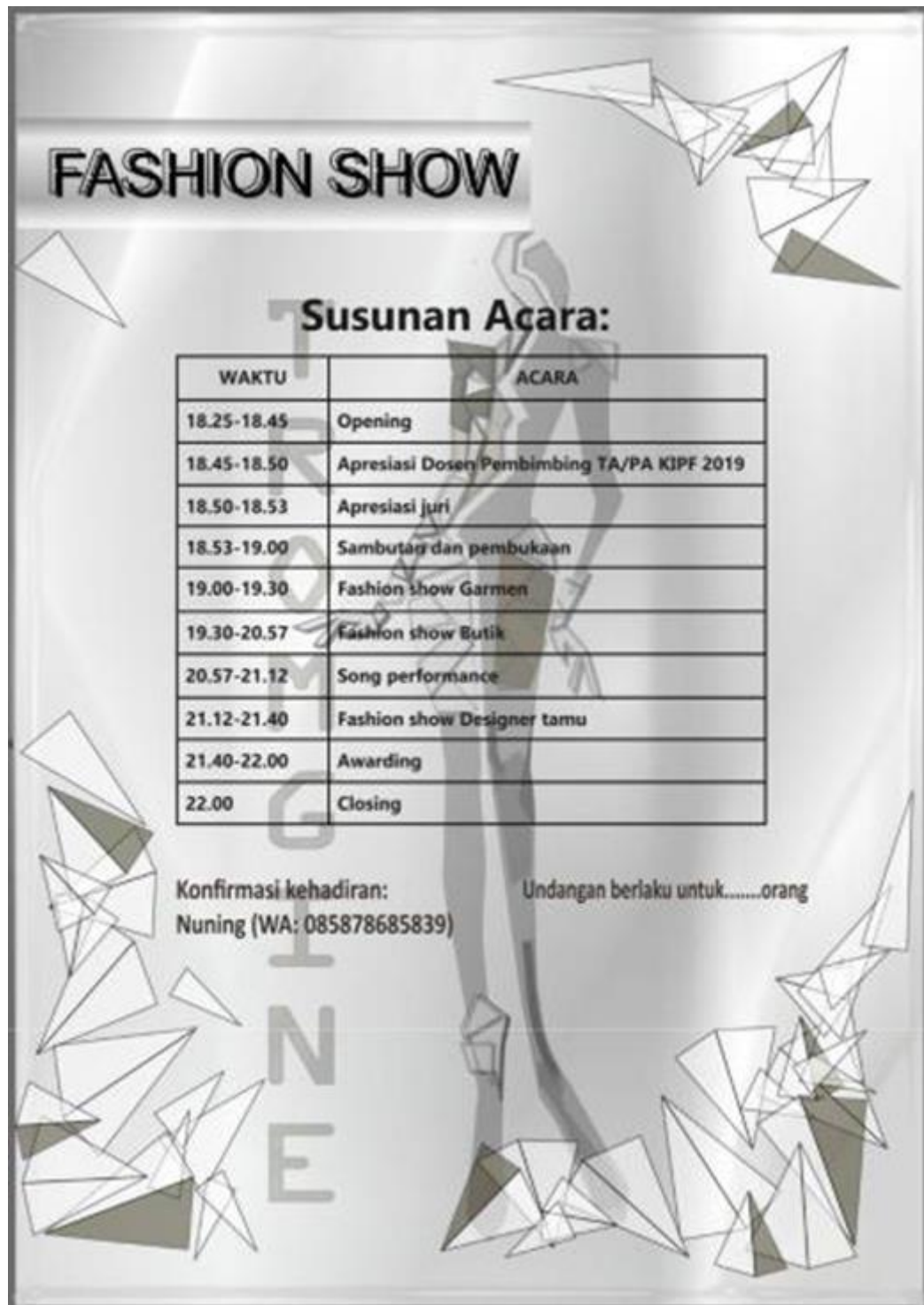
Lampiran 1: Susunan Acara Fashion Show Tromgine