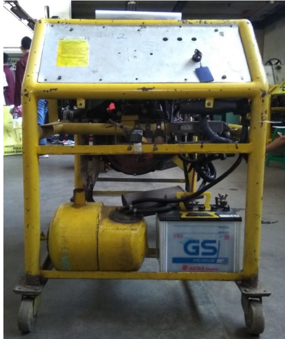
Kondisi Engine Sebelum Direkondisi