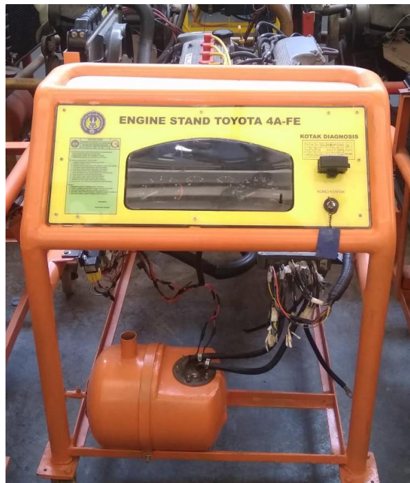
Kondisi Engine Stand Setelah Direkondisi