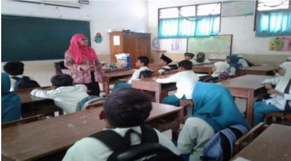
Praktek pembelajaran di dalam kelas