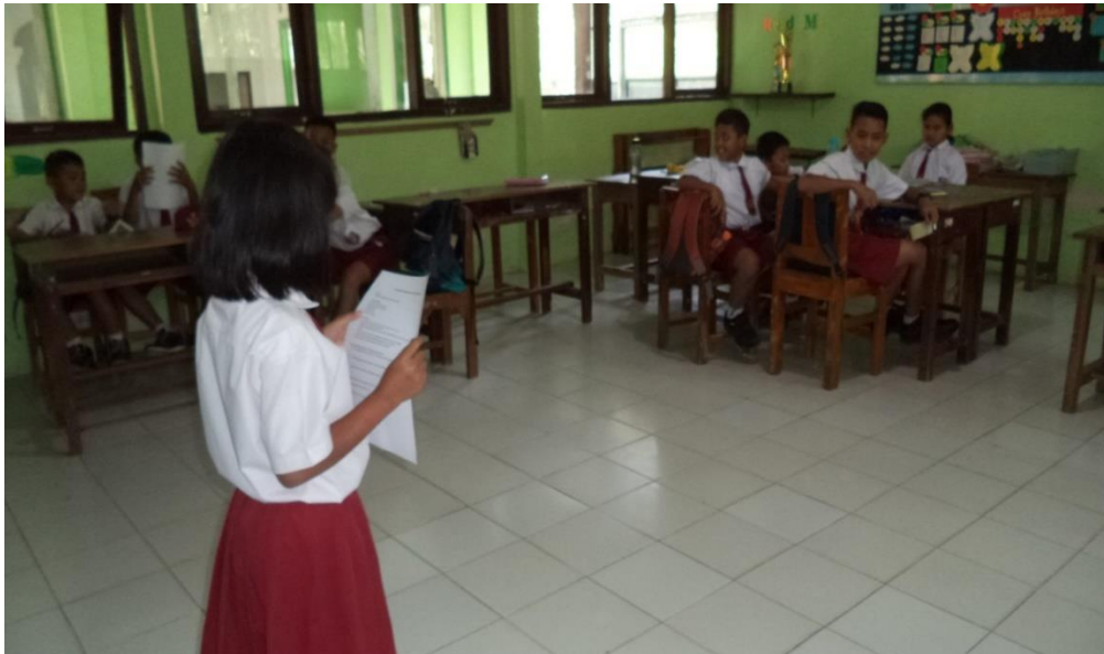
Siswa mempresentasikan hasil pekerjaan