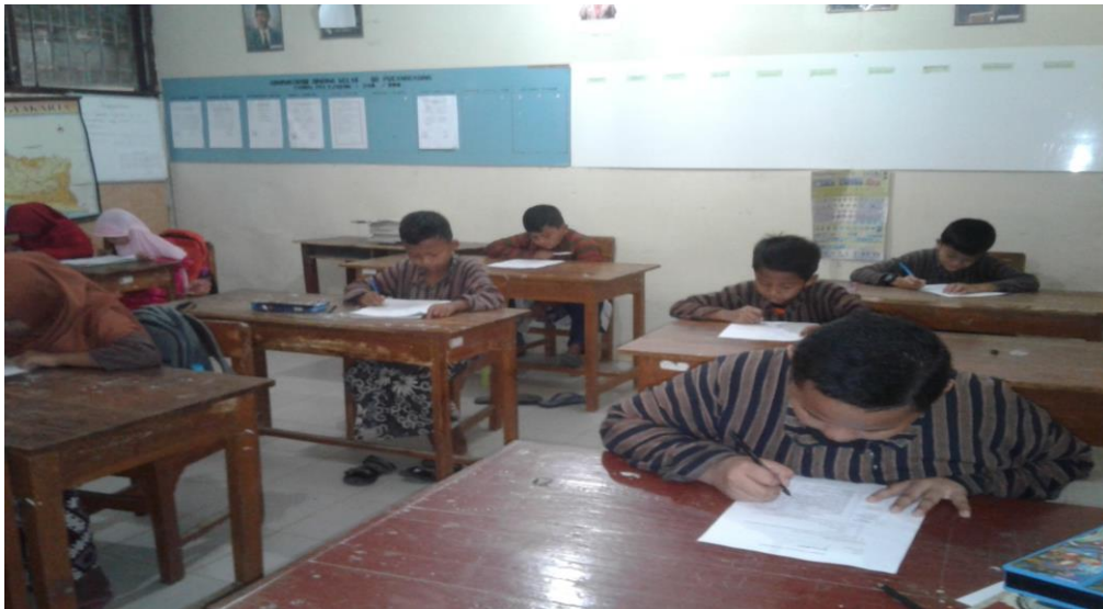
Siswa mengisi anget tanggung jawab