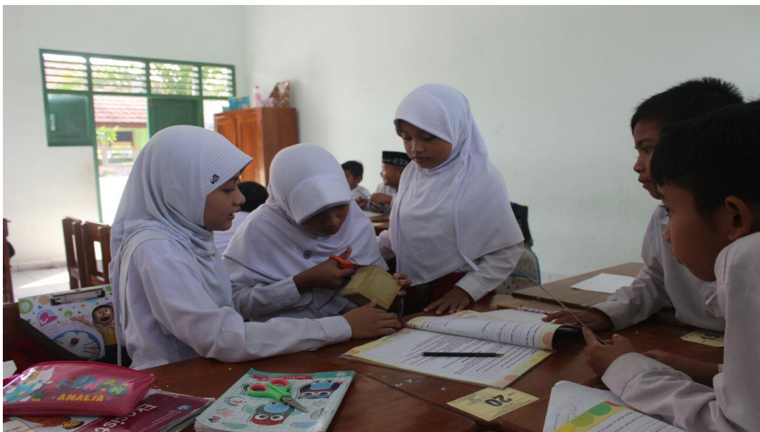
Siswa melakukan kerja kelompok