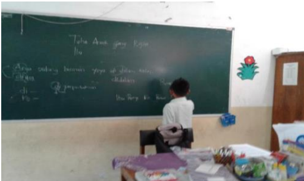
Siswa mempresentasikan hasil pekerjaan