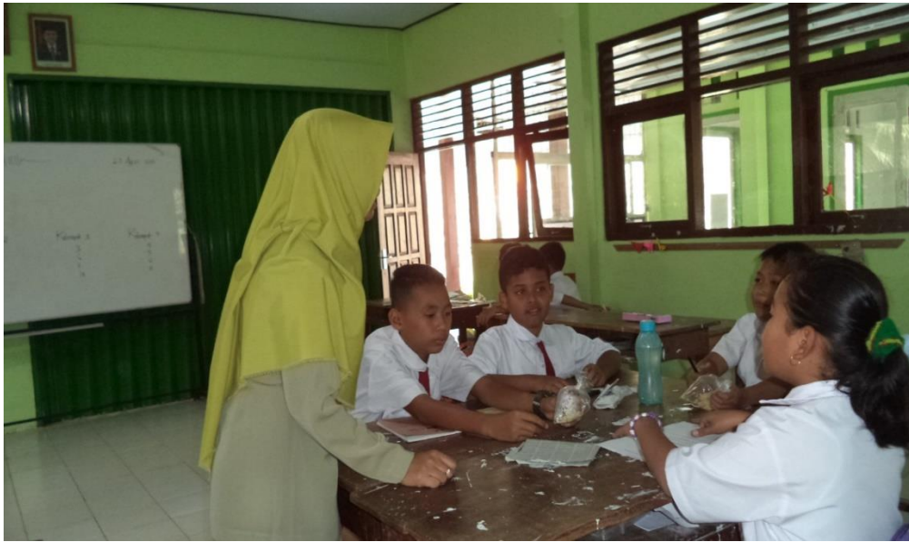
Praktek pembelajaran di dalam kelas