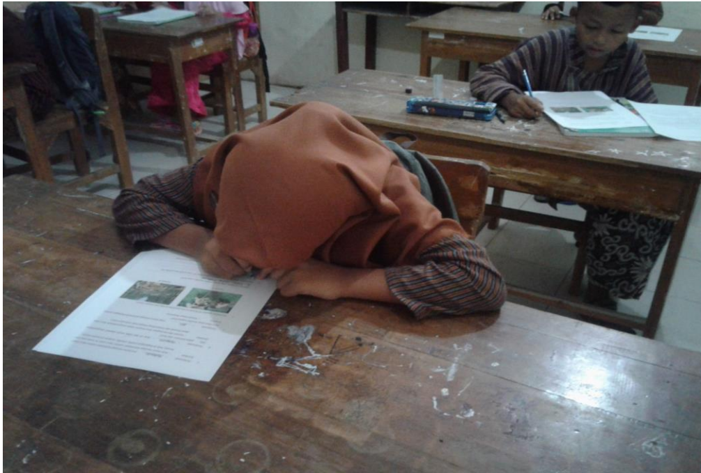
Siswa mengisis soal kemampuan berpikir kritis