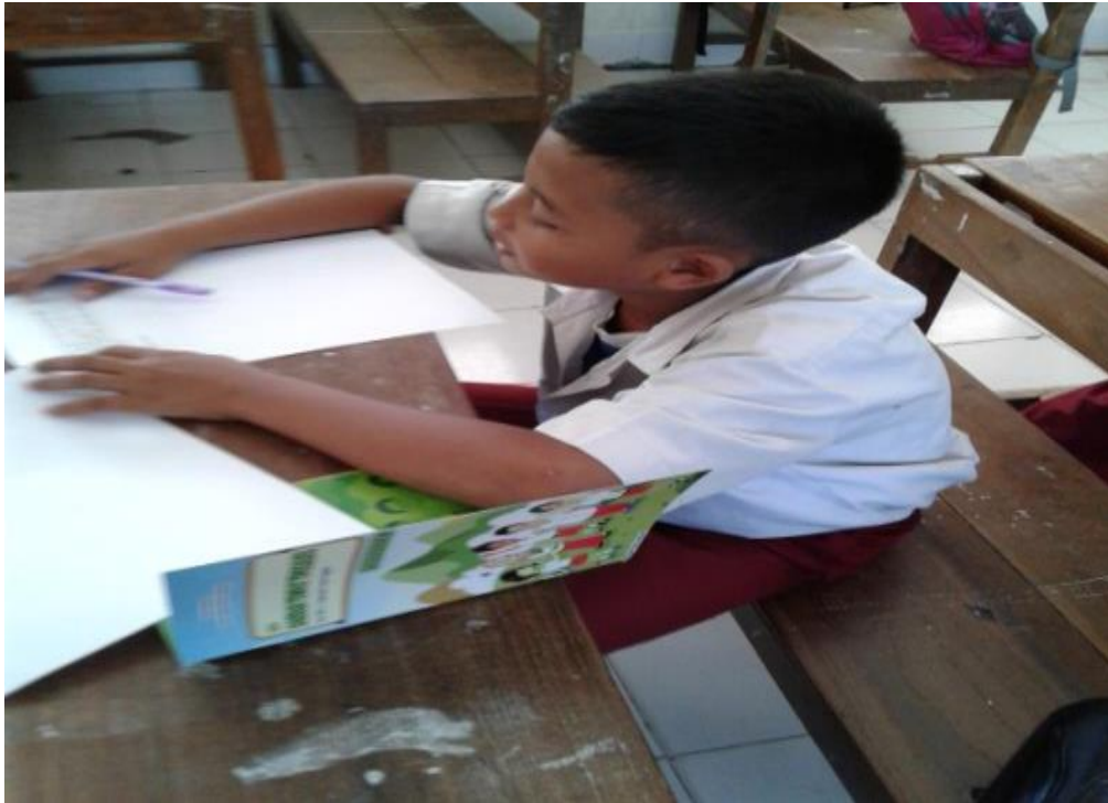
Siswa mengisi angket respon siswa