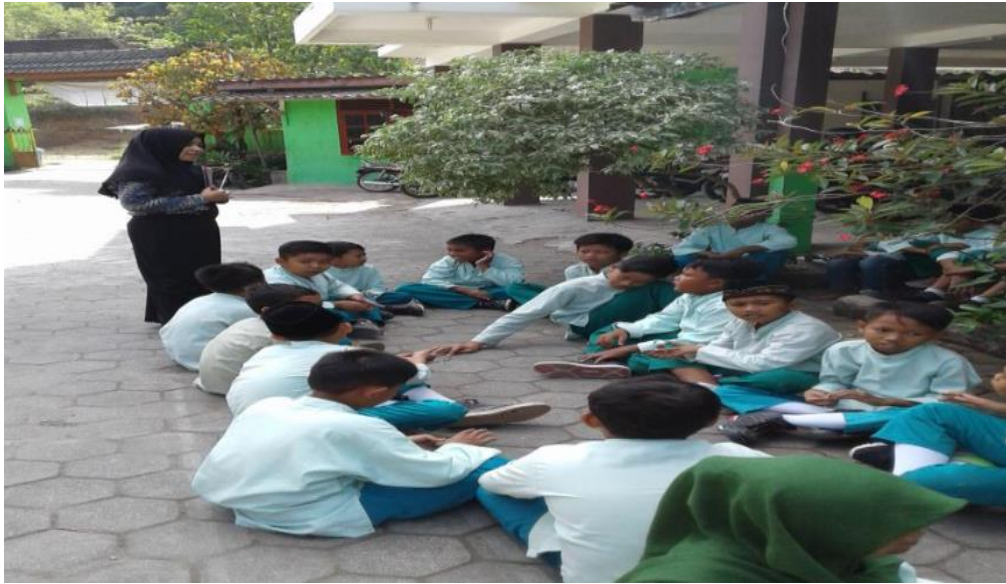
Siswa melakukan pembelajaran di luar kelas