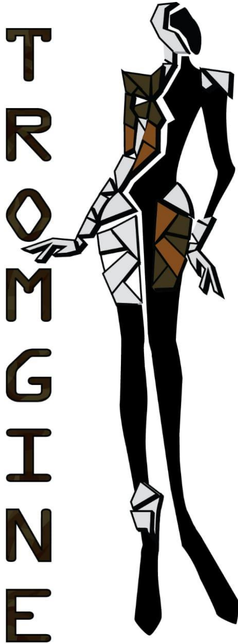
Lampiran 1. Logo Pergelaran