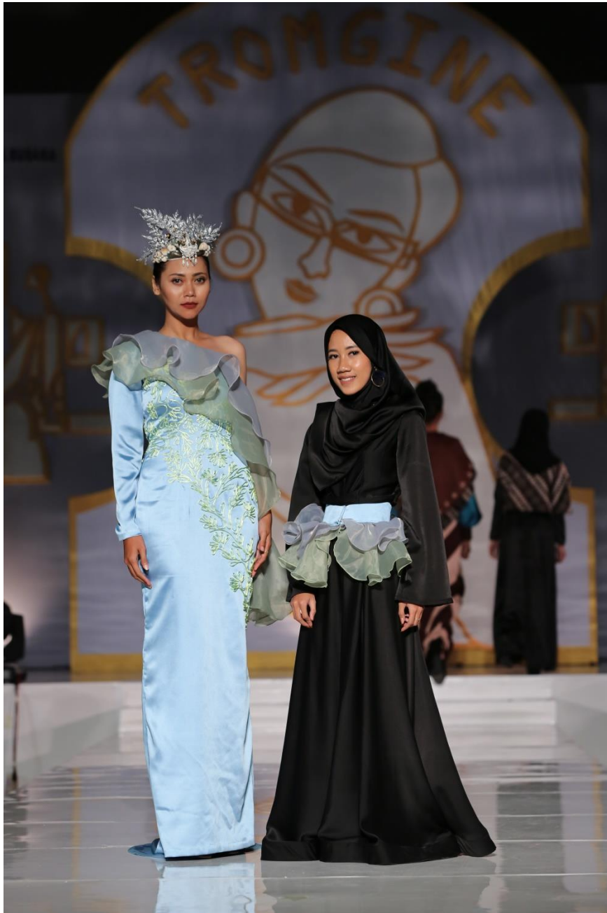
Lampiran 8. Dokumentasi Busana Bersama Desainer