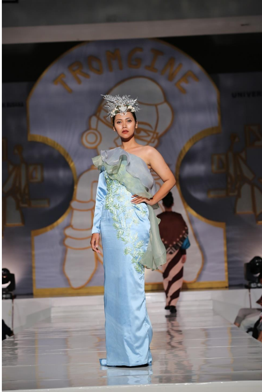
Lampiran 6. Hasil Busana Tampak Depan