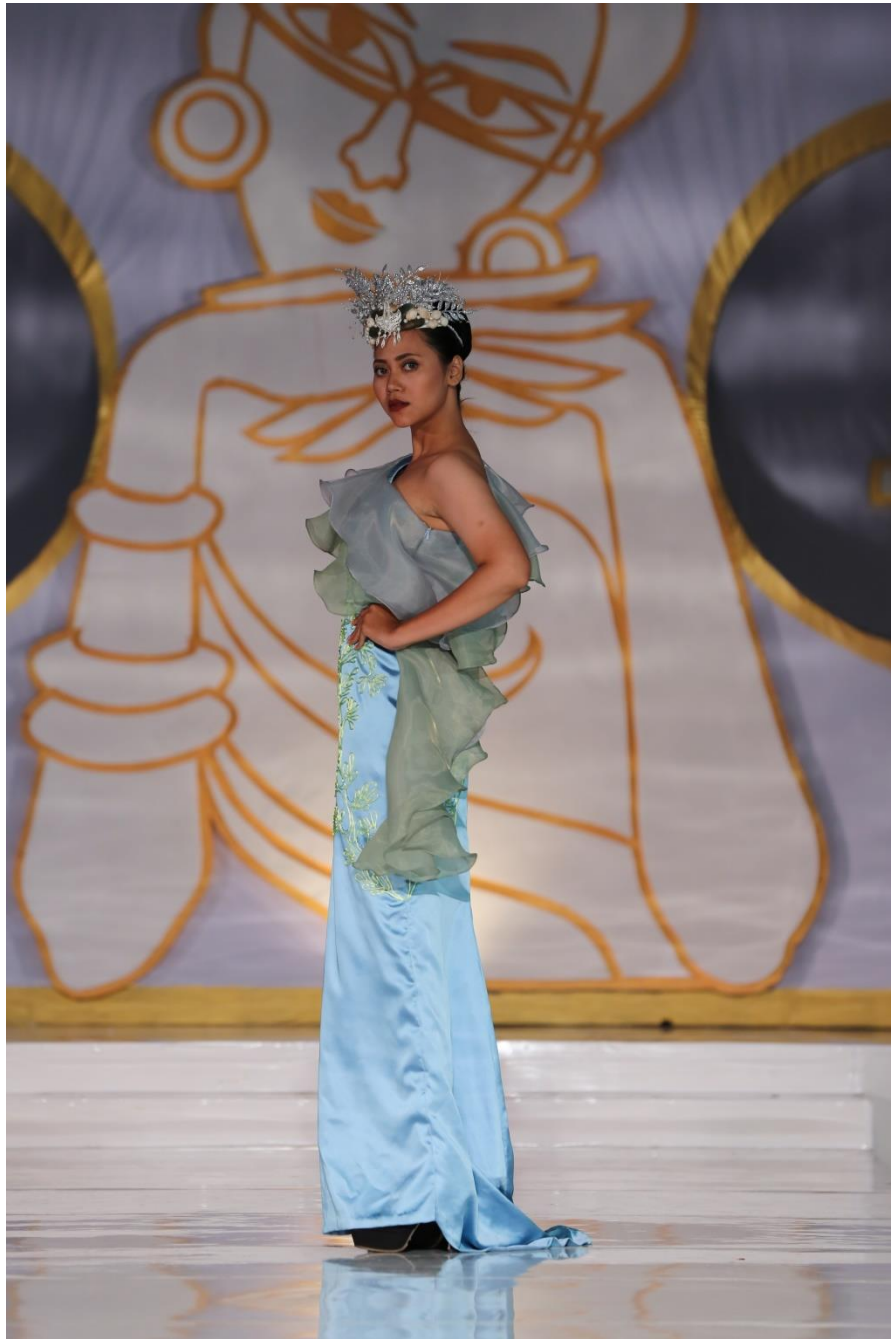
Lampiran 7. Hasil Busana Tampak Samping Pada Pergelaran