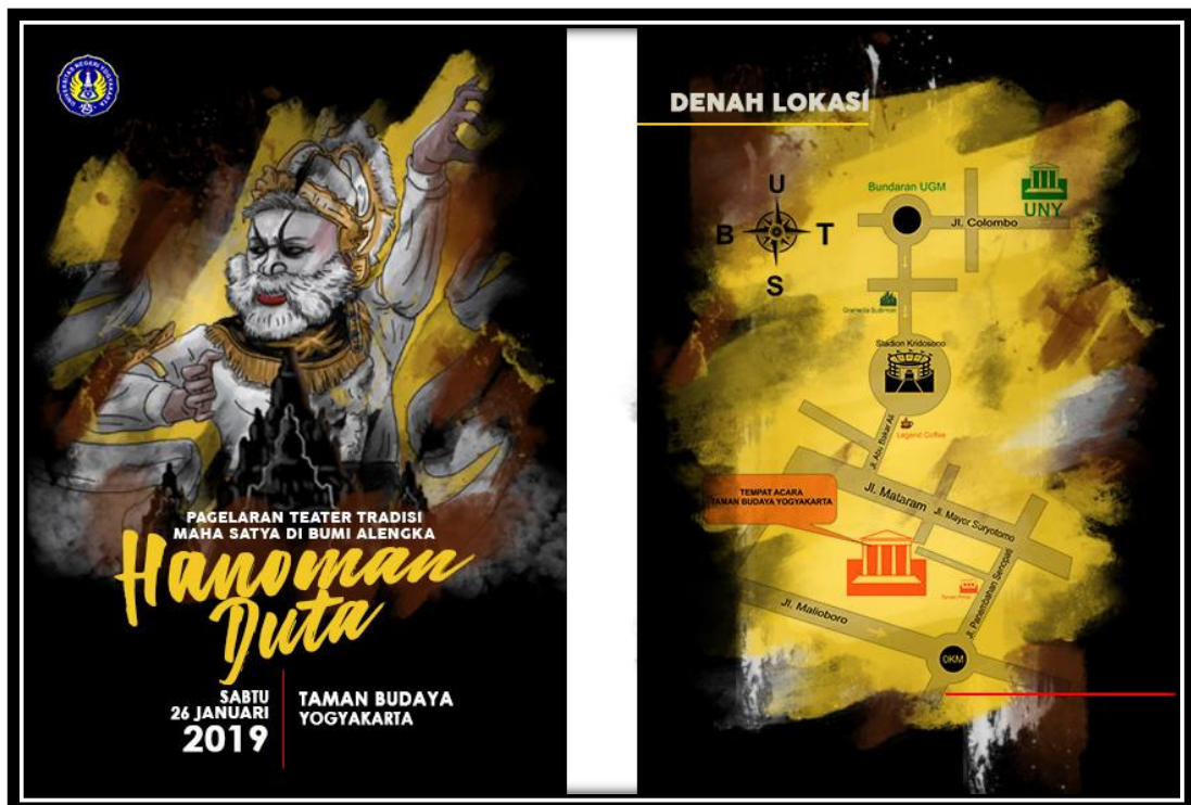
Lampiran 2. Undangan