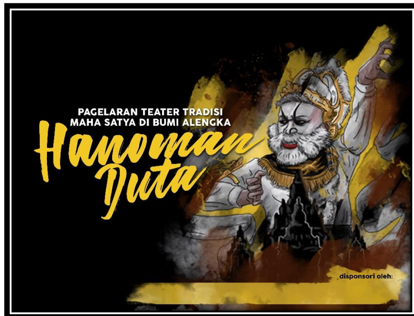
Lampiran 3. Photobooth Pergelaran