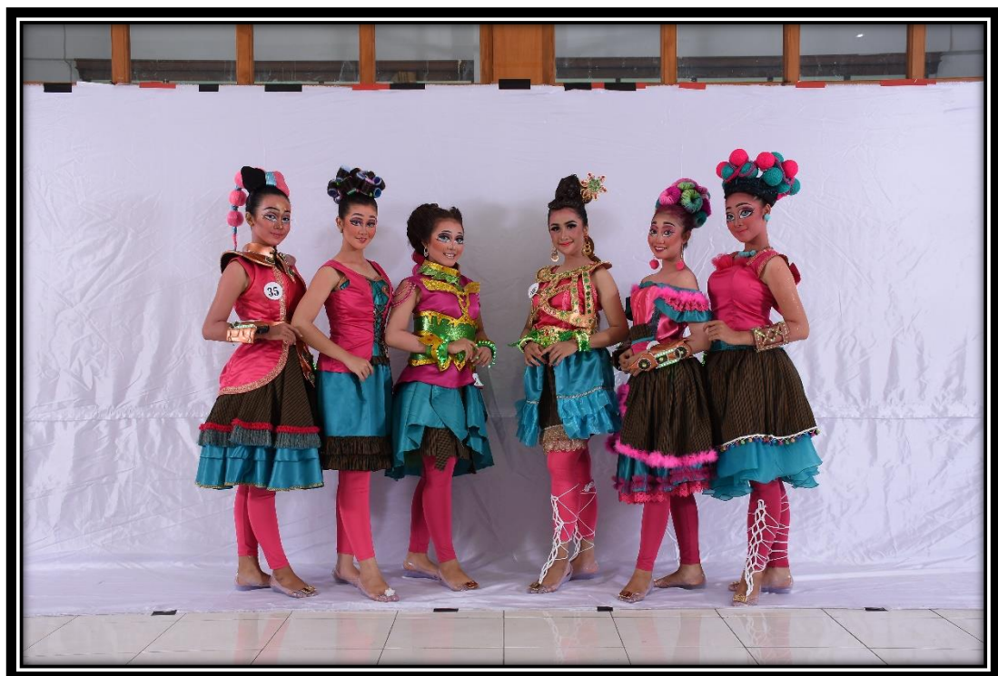
Lampiran 7. Foto Bersama Dayang