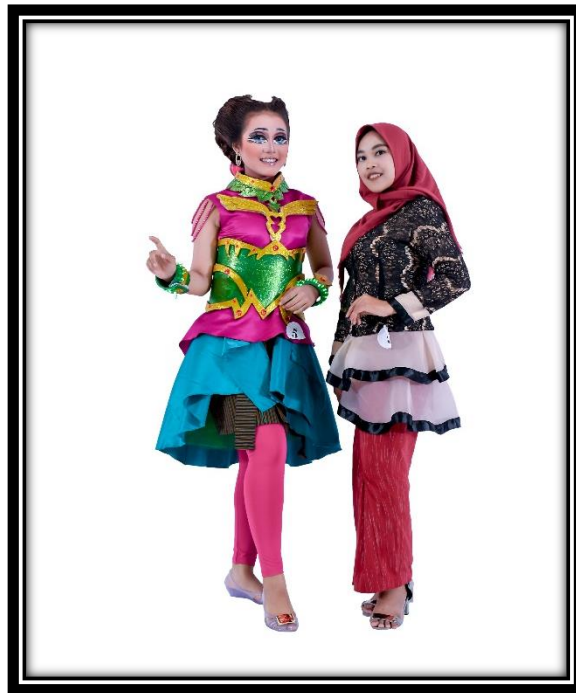
Lampiran 6. Foto Bersama Talent