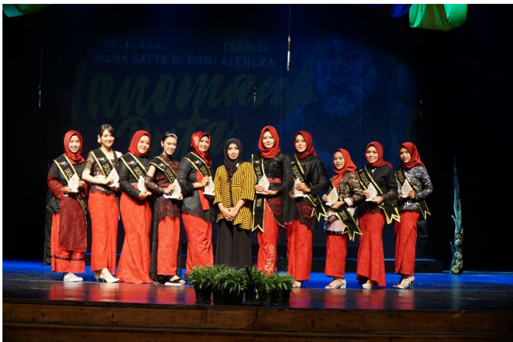
Gambar 75. Foto Bersama Dosen Pembimbing