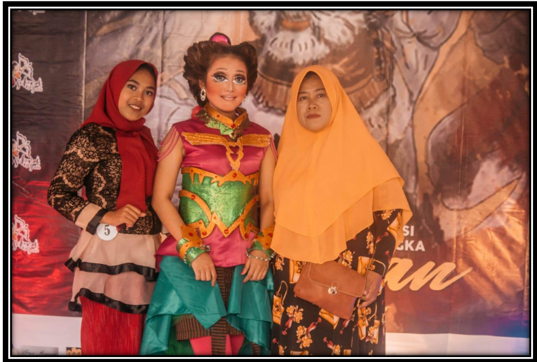
Lampiran 5. Foto Bersama Ibu Tercinta