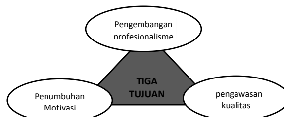
Gambar 2. Tujuan Supervisi Akademik

Menurut Ditjen Guru dan Tenaga Kependidikan (2016: 81), ada tiga tujuan supervisi akademik sebagaimana dapat dilihat pada gambar berikut ini: