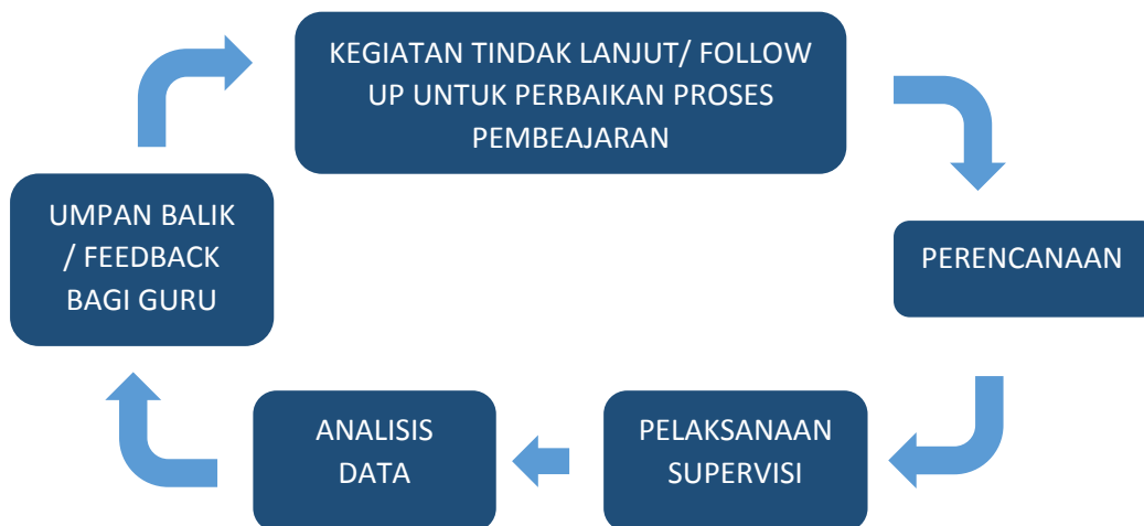
Gambar 3. Siklus Supervisi Akademik

Secara umum kegiatan supervisi akademik merupakan suatu siklus yang terdiri dari 5 (lima) tahap, yaitu sebagai berikut: