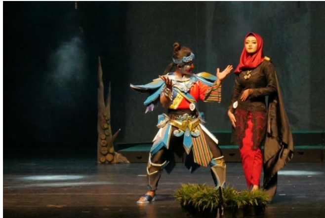
Lampiran 1. Penampilan Togog bersama Beauticians di Atas Panggung