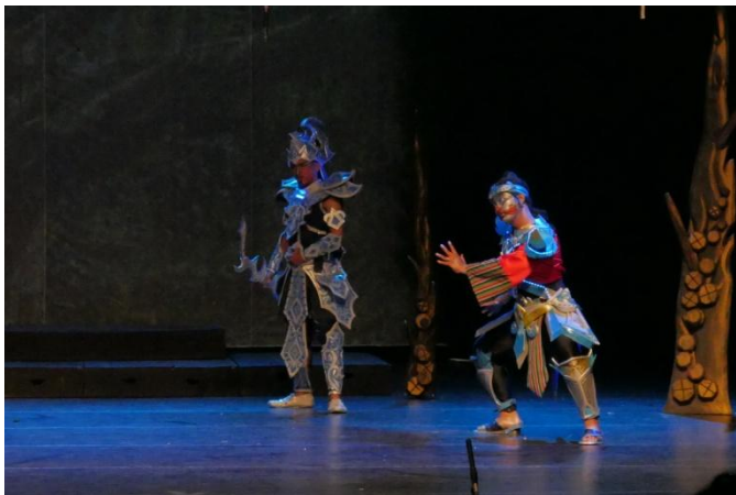
Lampiran 2. Penampilan Togog saat Pergelaran