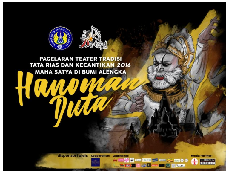
Lampiran 10. Gambar Banner