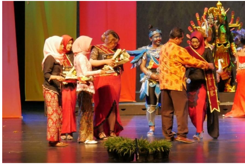
Lampiran 4. Foto Penyerahan Penghargaan