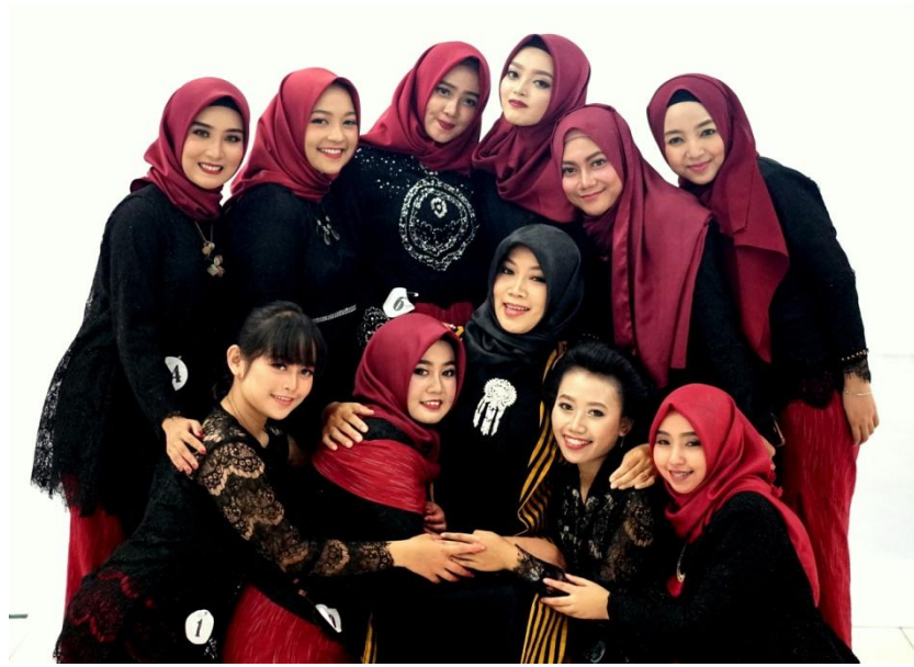
Lampiran 6. Foto Bersama Dosen Pembimbing