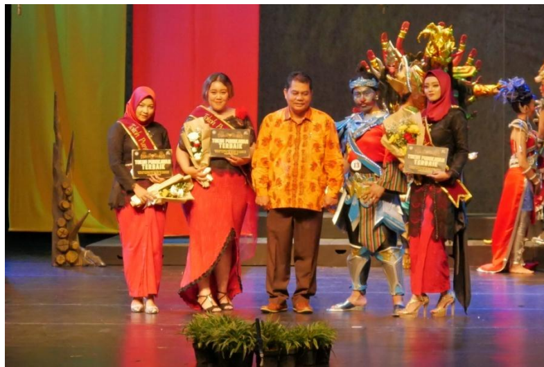
Lampiran 5. Foto Bersama Best Punokawan