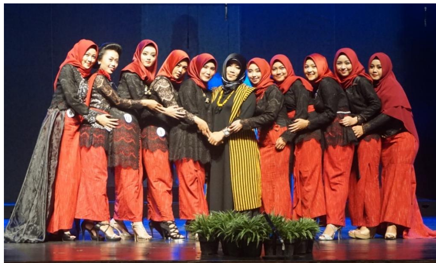
Lampiran 7. Foto Bersama Dosen Pembimbing di Stage