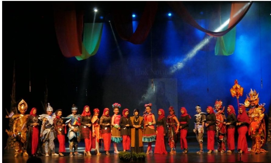
Lampiran 8. Foto Bersama Dosen Pembimbing dan Talent