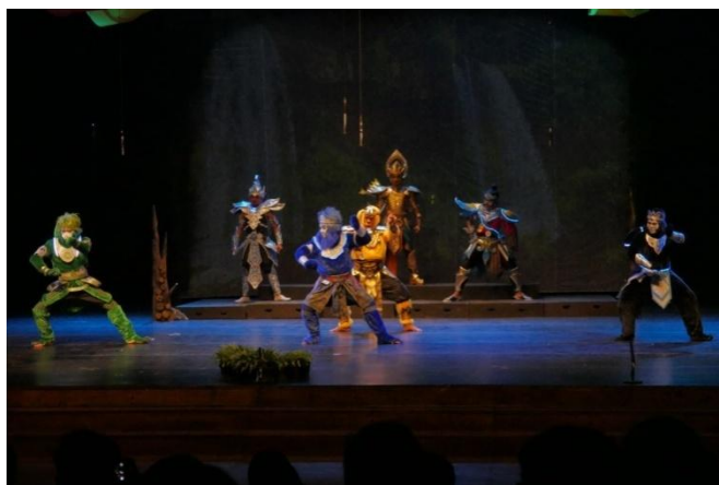
Lampiran 3. Penampilan Togog di Atas Panggung