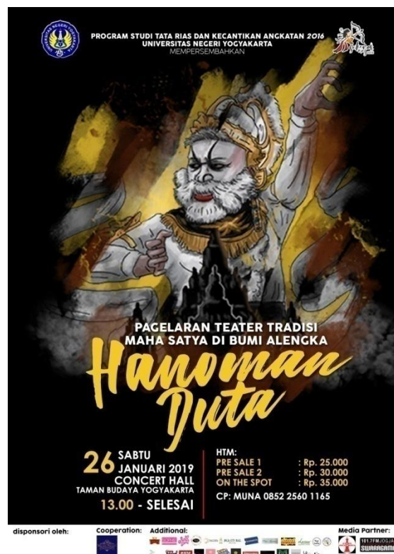
Lampiran 9. Gambar Pamflet