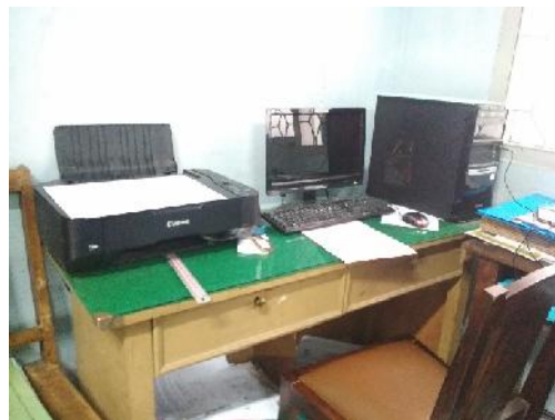
Komputer & Printer BKK