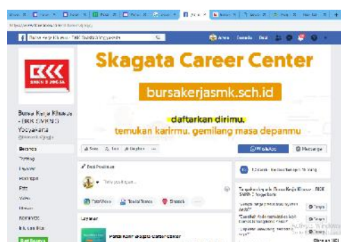
Media Sosial BKK