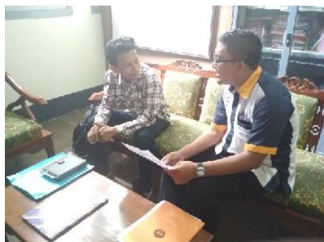
Informasi Lowongan Kerja dari Alumni