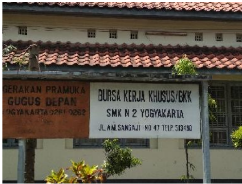
Papan Nama BKK