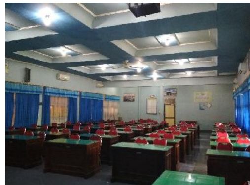
Fasilitas Ruang Seleksi