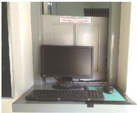
Komputer pendaftaran lowongan kerja