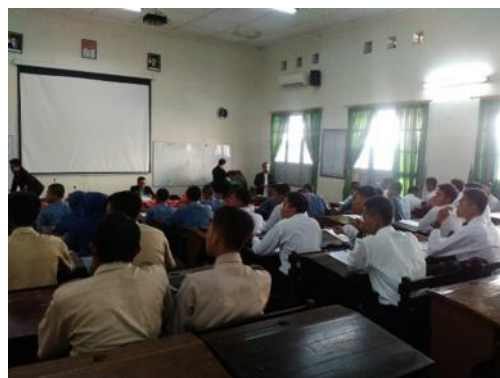
Pelaksanaan Tes Rekrutmen