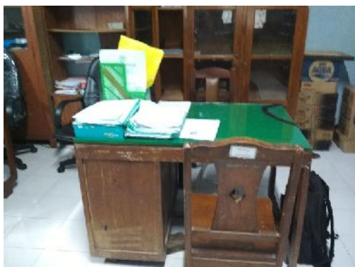
Meja Koordinator BKK