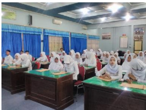
Pelaksanaan Tes Rekrutmen