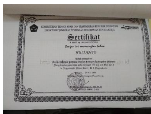
Sertifikat Pelatihan Pengelola BKK