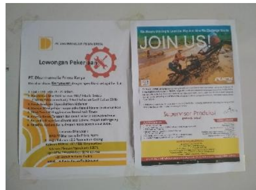
Informasi Lowongan Pekerjaan