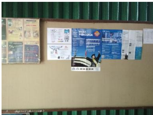
Papan Pengumuman BKK