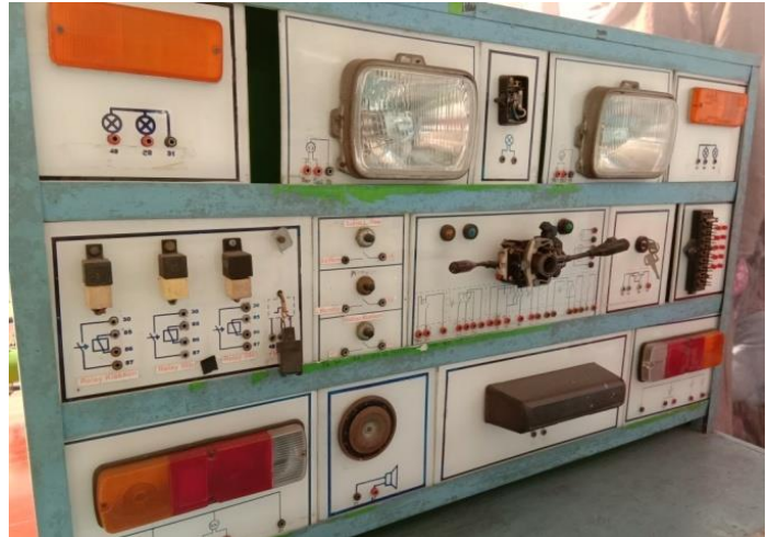
Gb 4. Training Objek Uji Kompetensi