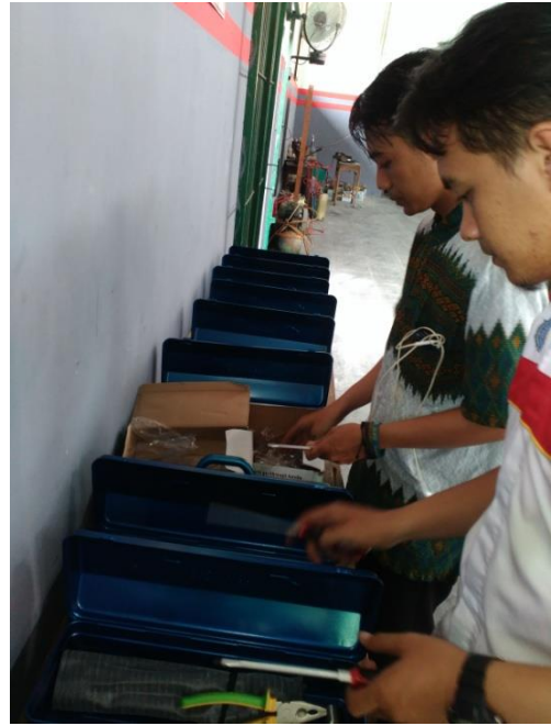
Gb 2. Persiapan Peralatan Uji Kompetensi