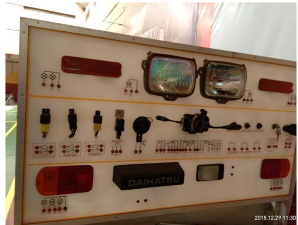
Gb 5. Panel Kelistrikan Body