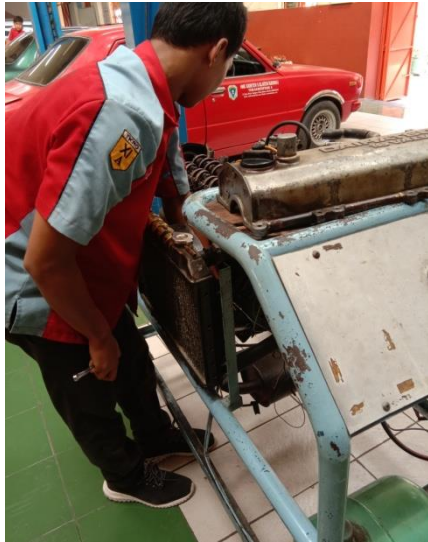
Gb 3. Pelaksanaan Uji Kompetensi