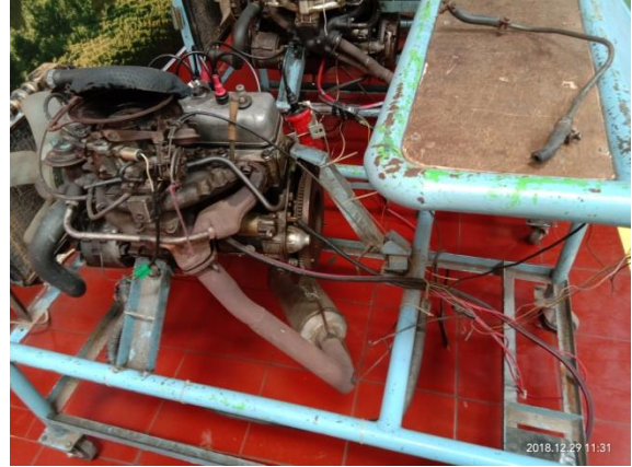
Gb 5. Engine atau mesin mobil