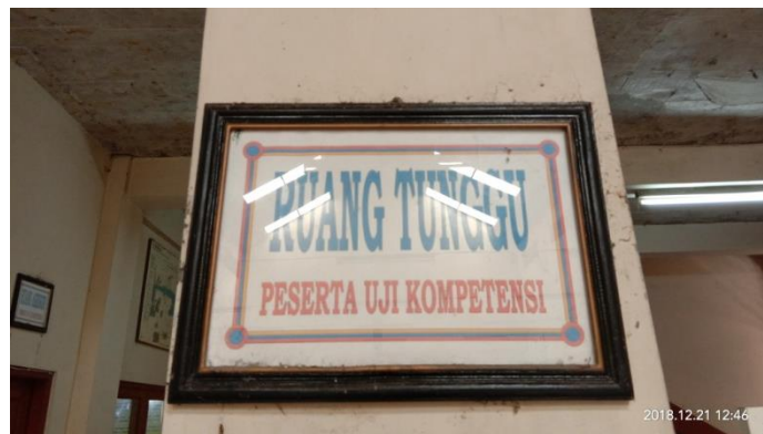
Gb 7. Rambu-rambu ruang tunggu peserta