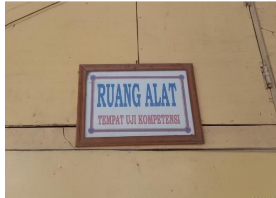
Gb 6. Rambu-rambu