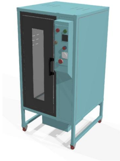
Gambar 05. Mesin Pengering Pakaian