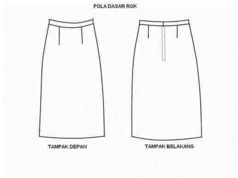
Gambar 1. Desain Rok

Analisis Desain : Rok dengan panjang 60 cm, dengan jahitan kupnat depan dan belakang, ritsreting biasa, dengan ban pinggang.