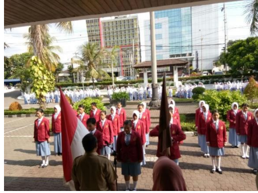
Upacara Pelantikan OSIS