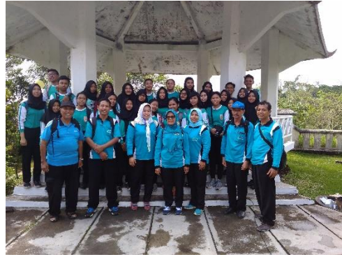
Orientasi OSIS dan Dewan Ambalan