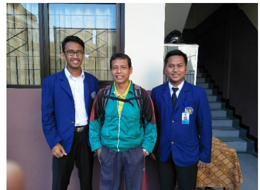
Mahasiswa PLT dan Guru Olahraga