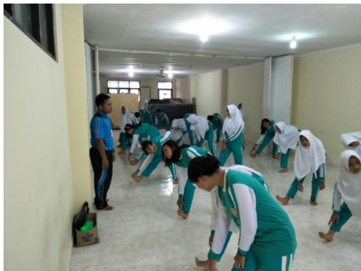
Pembelajaran Pencak Silat