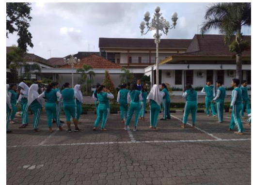
Persiapan pengkondisian siswa