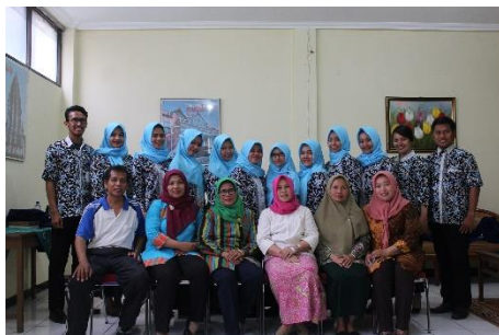
Mahasiswa PLT, Dosen Pembimbing dan Guru Pembimbing