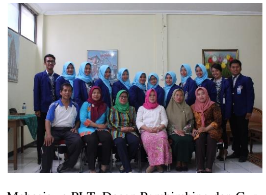
Mahasiswa PLT, Dosen Pembimbing dan Guru Pembimbing