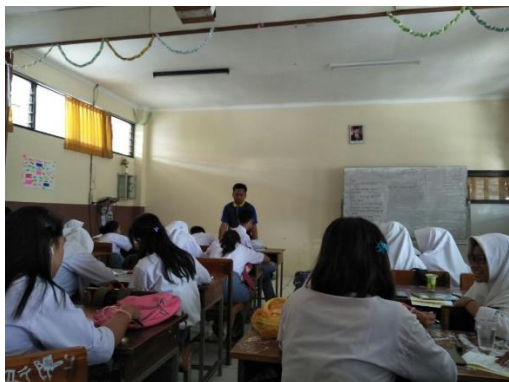
Pembelajaran materi Pergaulan Sehat