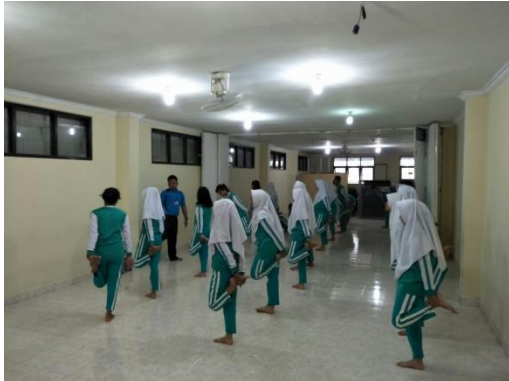
Pemanasan sebelum memasuki kegiatan inti pembelajaran