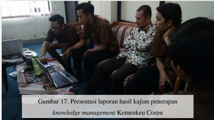
Gambar 17. Presentasi laporan hasil kajian penerapan knowledge management Kemenkeu Corpu