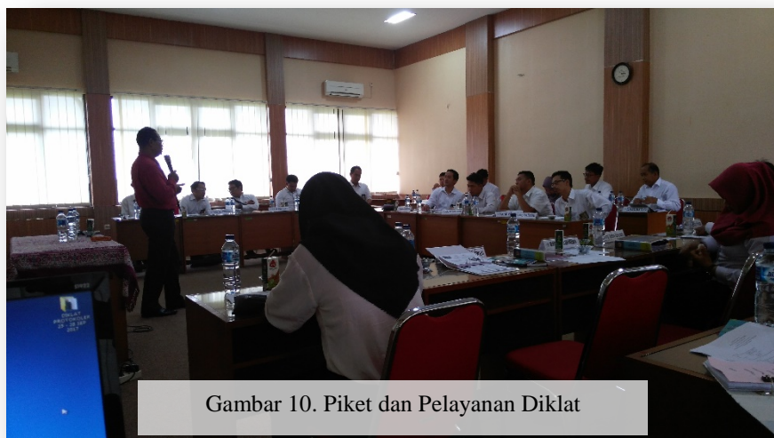
Gambar 10. Piket dan Pelayanan Diklat