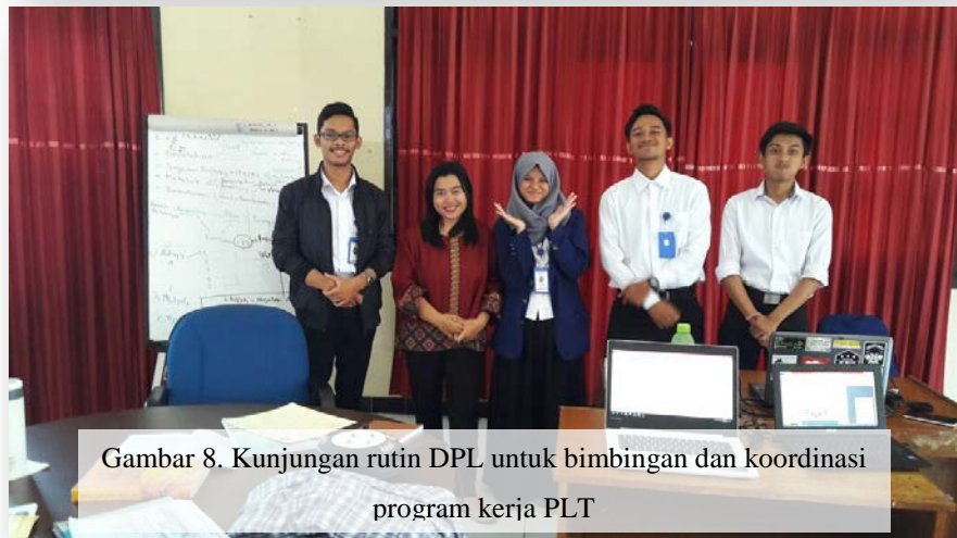
Gambar 8. Kunjungan rutin DPL untuk bimbingan dan koordinasi program kerja PLT