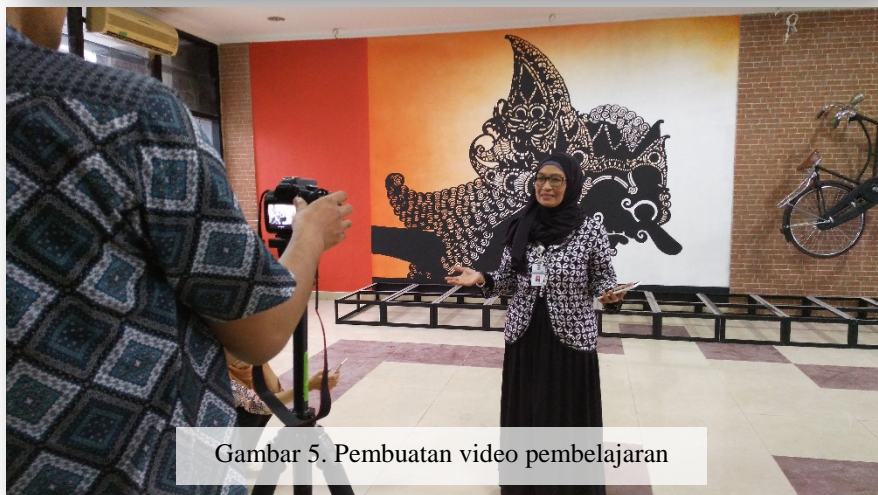
Gambar 5. Pembuatan video pembelajaran