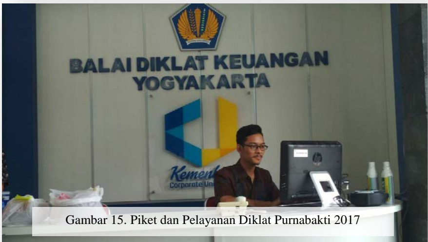
Gambar 15. Piket dan Pelayanan Diklat Purnabakti 2017