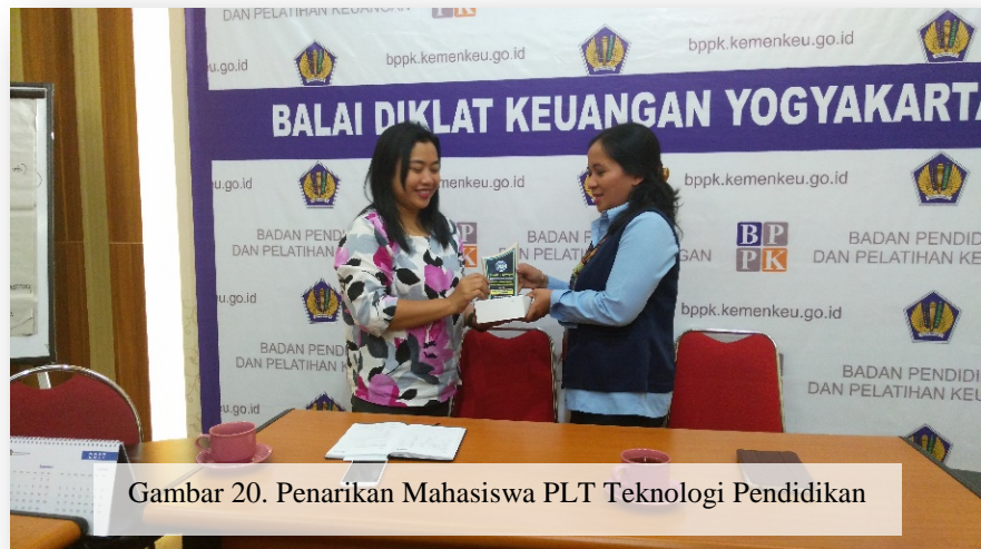
Gambar 20. Penarikan Mahasiswa PLT Teknologi Pendidikan