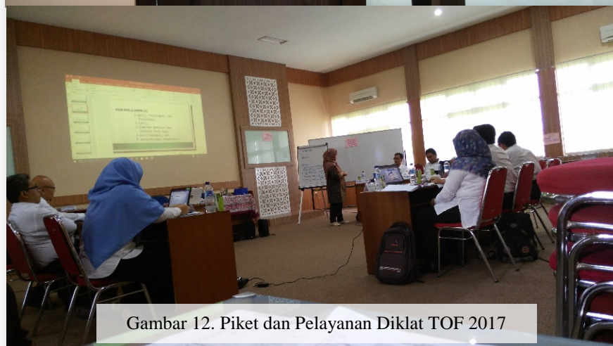
Gambar 12. Piket dan Pelayanan Diklat TOF 2017