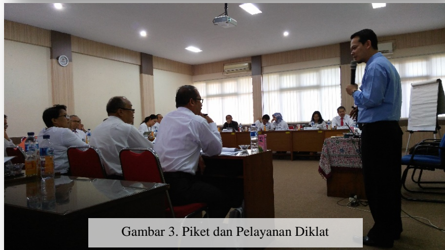
Gambar 3. Piket dan Pelayanan Diklat