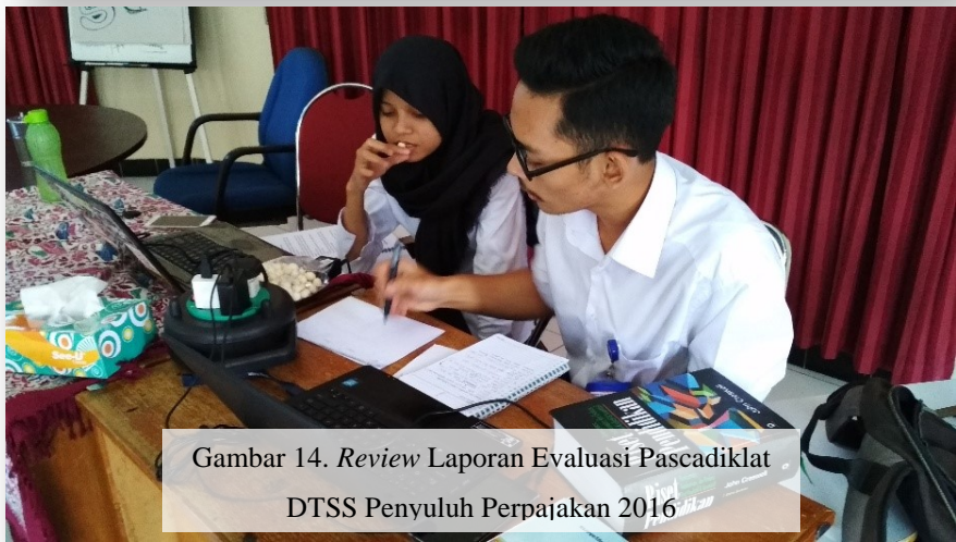
Gambar 14. Review Laporan Evaluasi Pascadiklat DTSS Penyuluh Perpajakan 2016