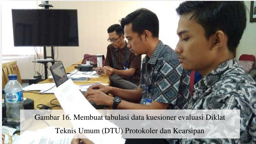
Gambar 16. Membuat tabulasi data kuesioner evaluasi Diklat Teknis Umum (DTU) Protokoler dan Kearsipan