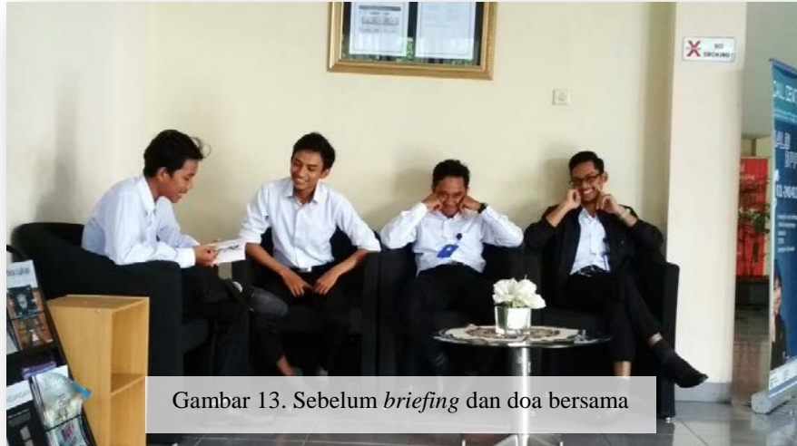
Gambar 13. Sebelum briefing dan doa bersama