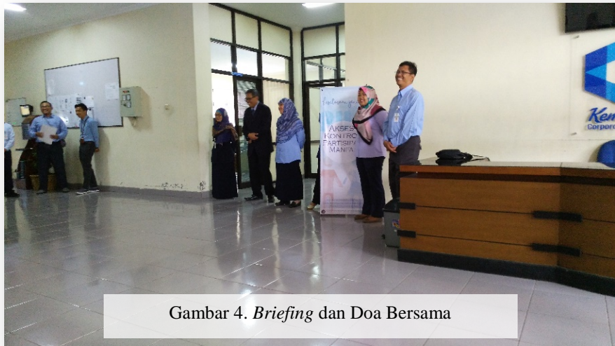
Gambar 4. Briefing dan Doa Bersama