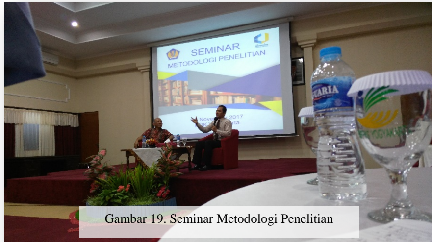
Gambar 19. Seminar Metodologi Penelitian