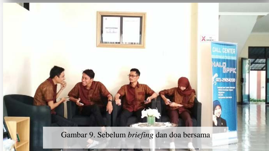
Gambar 9. Sebelum briefing dan doa bersama