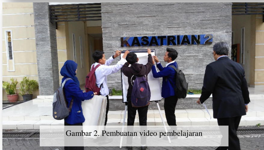
Gambar 2. Pembuatan video pembelajaran