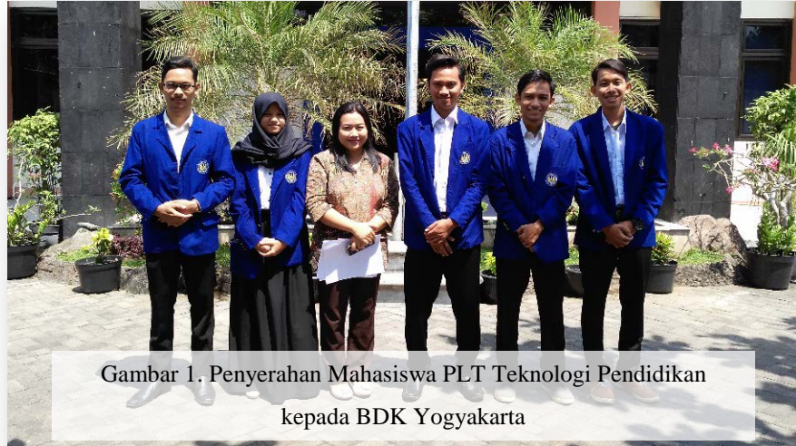
Gambar 1. Penyerahan Mahasiswa PLT Teknologi Pendidikan kepada BDK Yogyakarta