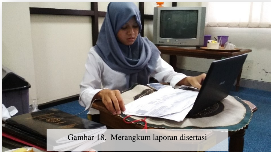
Gambar 18. Merangkum laporan disertasi