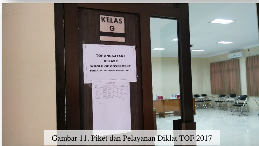
Gambar 11. Piket dan Pelayanan Diklat TOF 2017