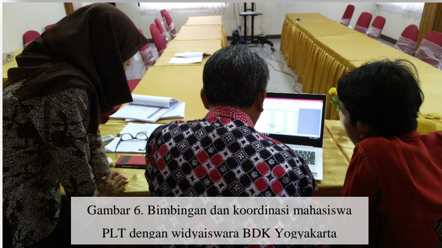
Gambar 6. Bimbingan dan koordinasi mahasiswa PLT dengan widyaiswara BDK Yogyakarta