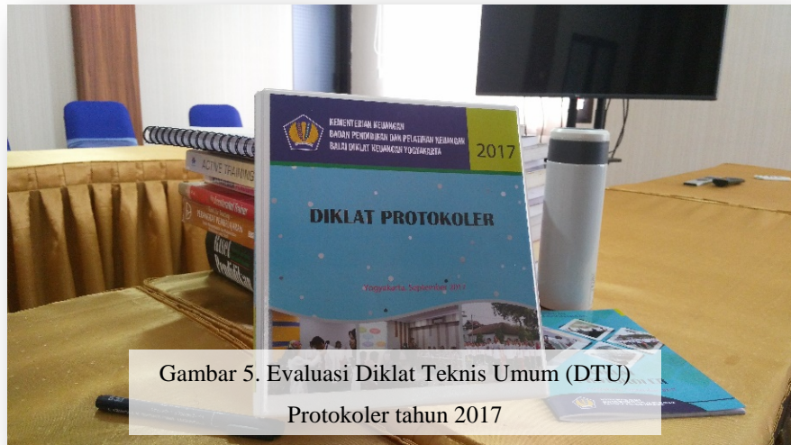
Gambar 5. Evaluasi Diklat Teknis Umum (DTU) Protokoler tahun 2017