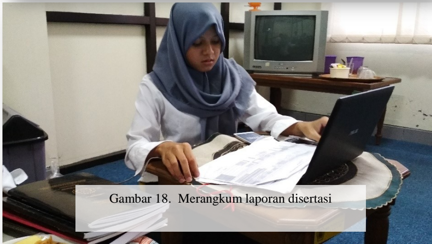
Gambar 18. Merangkum laporan disertai