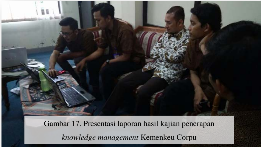
Gambar 17. Presentasi laporan hasil kajian penerapan knowledge management Kemenkeu Corpu