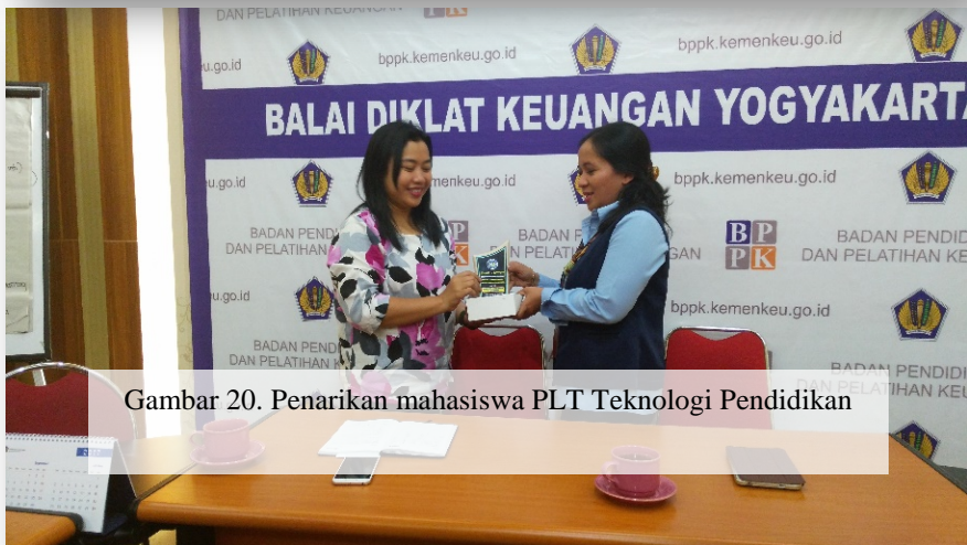
Gambar 20. Penarikan mahasiswa PLT Teknologi Pendidikan