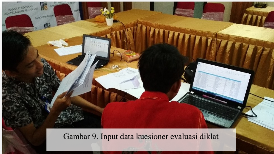
Gambar 9. Input data kuesioner evaluasi diklat