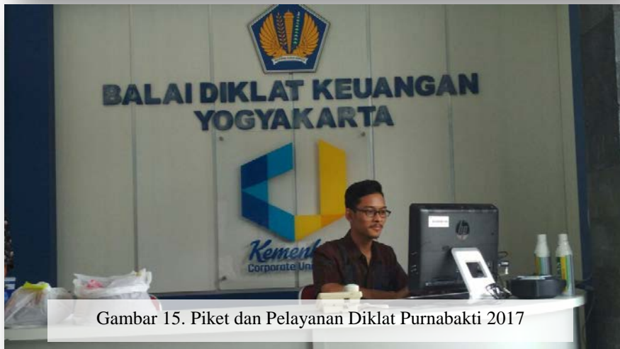
Gambar 15. Piket dan Pelayanan Diklat Purnabakti 2017