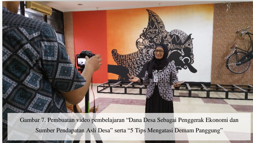
Gambar 7. Pembuatan video pembelajaran “Dana Desa Sebagai Penggerak Ekonomi dan Sumber Pendapatan Asli Desa” serta “5 Tips Mengatasi Demam Panggung”