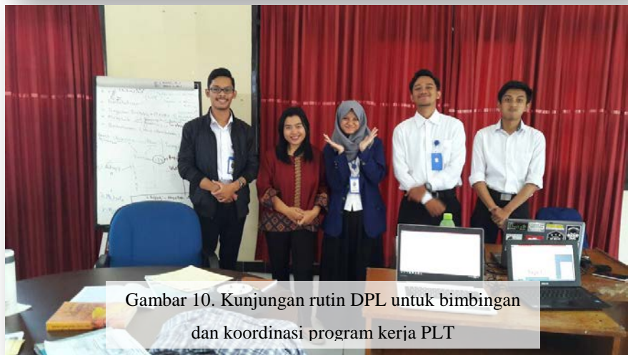
Gambar 10. Kunjungan rutin DPL untuk bimbingan dan koordinasi program kerja PLT