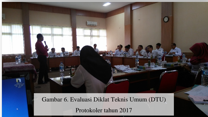
Gambar 6. Evaluasi Diklat Teknis Umum (DTU) Protokoler tahun 2017