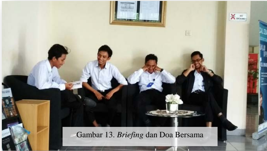
Gambar 13. Briefing dan Doa Bersama