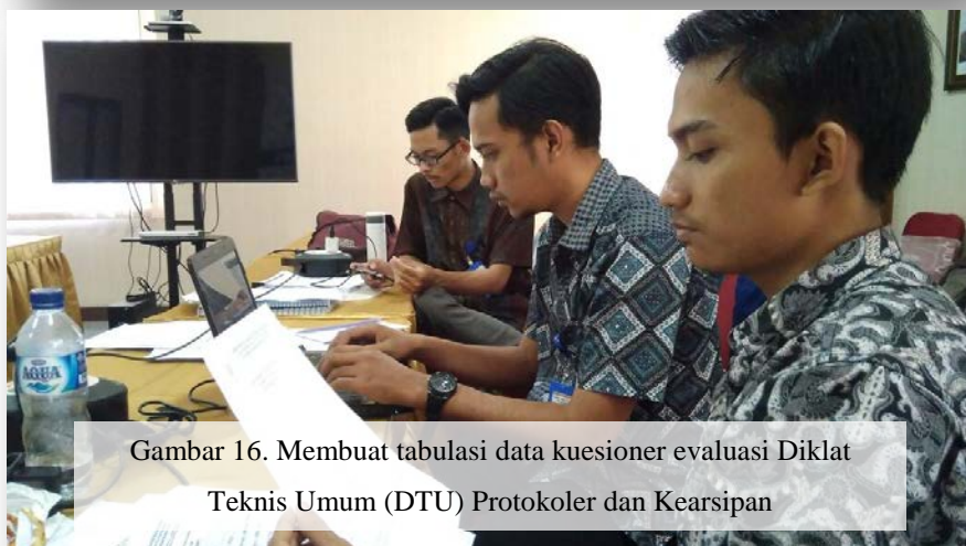
Gambar 16. Membuat tabulasi data kuesioner evaluasi Diklat Teknis Umum (DTU) Protokoler dan Kearsipan