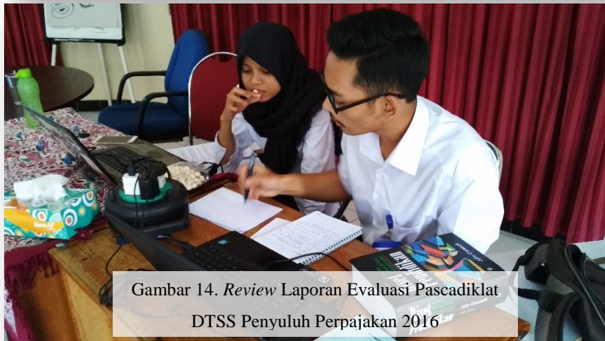
Gambar 14. Review Laporan Evaluasi Pascadiklat DTSS Penyuluh Perpajakan 2016