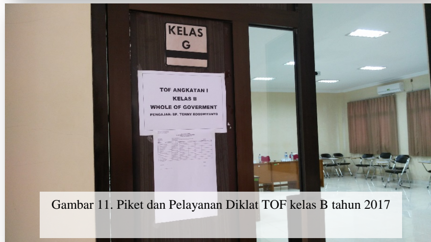
Gambar 11. Piket dan Pelayanan Diklat TOF kelas B tahun 2017