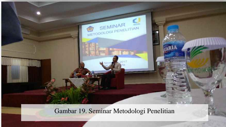
Gambar 19. Seminar Metodologi Penelitian