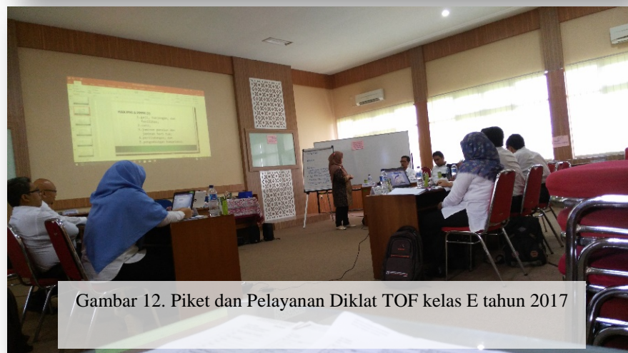
Gambar 12. Piket dan Pelayanan Diklat TOF kelas E tahun 2017