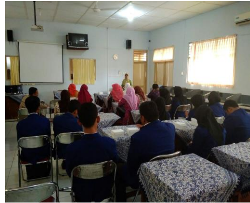
Penyerahan Mahasiswa PLT UNY ke SMP Negeri 4 Yogyakarta