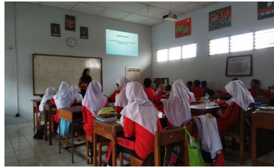
Praktik Bimbingan Klasikal