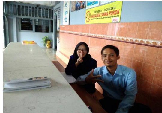
Piket Harian Jaga Depan