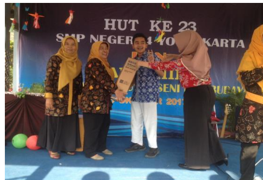
Perayaan HUT SMP Negeri 4 Yogyakarta yang ke-23