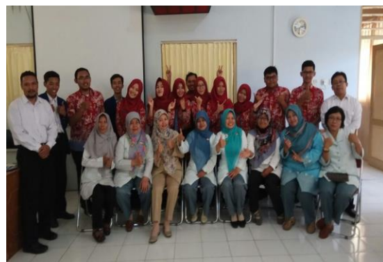
Penarikan Mahasiswa PLT UNY 2017