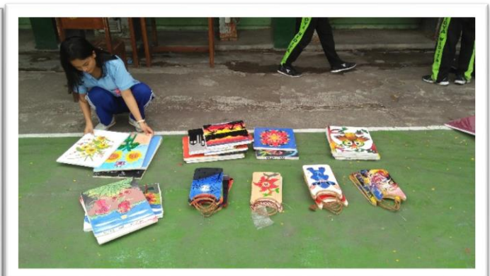
PERSIAPAN PAMERAN (MEMILIK KARYA UNTUK DIPAMERKAN)