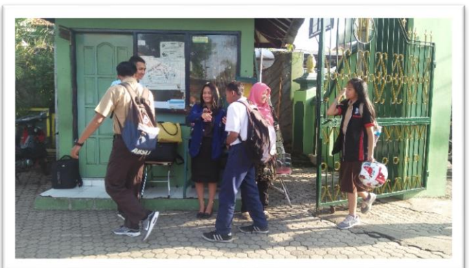
PIKET PAGI (PEMBIASAAN TIAP PAGI MEMBERI SENYUM,SAPA,SALAM ANATAR GURU DAN MURID)