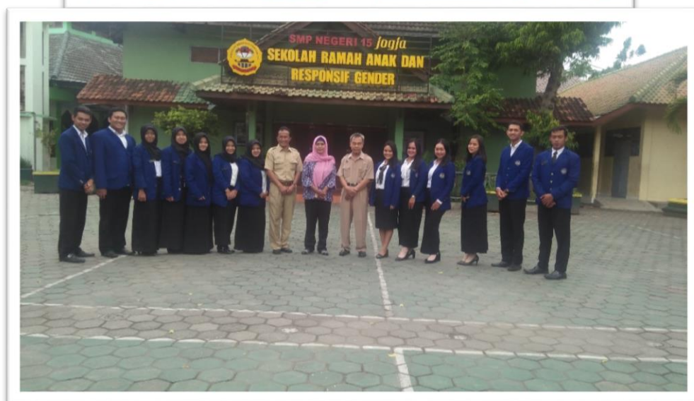
PENARIKAN DAN PEMBERIAN KENANG-KENANGAN