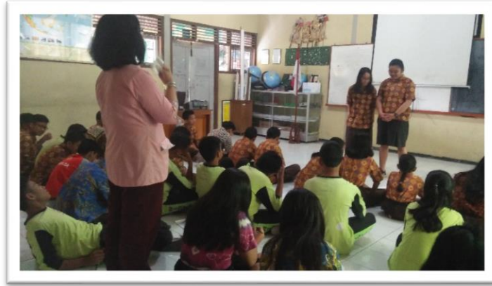
DOA DAN RENUNGAN PAGI SISWA KRISTEN