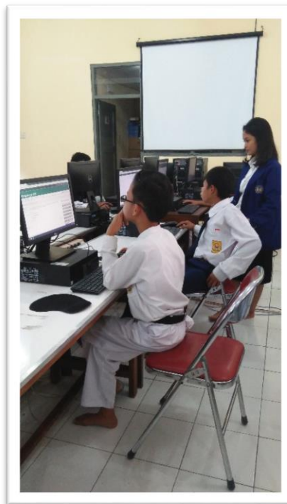
MENGAWASI PENILAIAN TENGAH SEMESTER