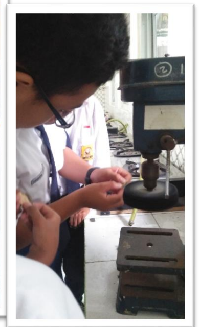
PRAKTEK MEMBUAT KARYA E TSA (MENYABLON MANUAL, MENGAMPLAS, MENYAMPUR LARUTAN E TSA DAN MERENDAM ALUMUNIUM KEDALAM LARUTAN DAN MENYELEB)