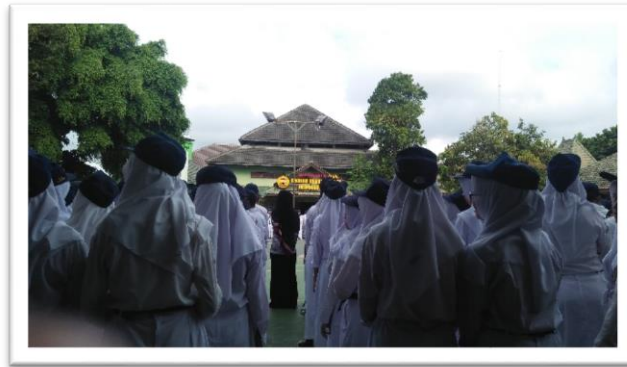
UPACARA BENDERA TIAP HARI SENIN