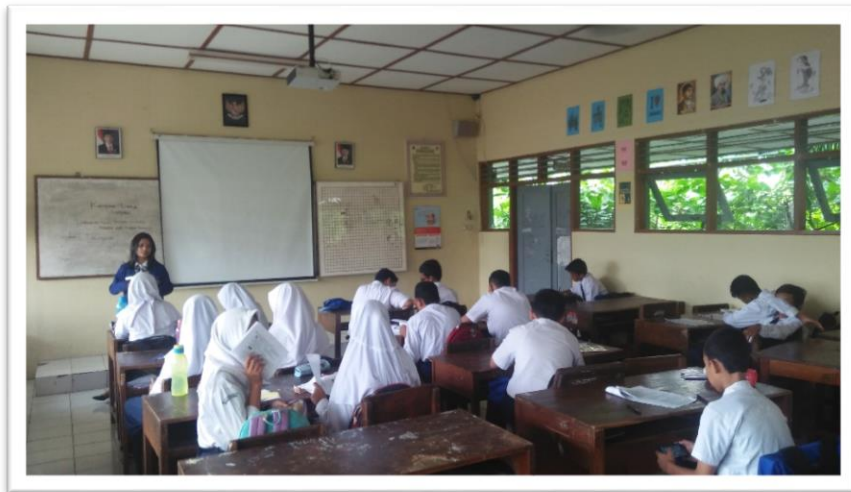
PRAKTEK MENGAJAR DI DALAM KELAS (MEJELASKAN MATERI TENTANG ETSA)