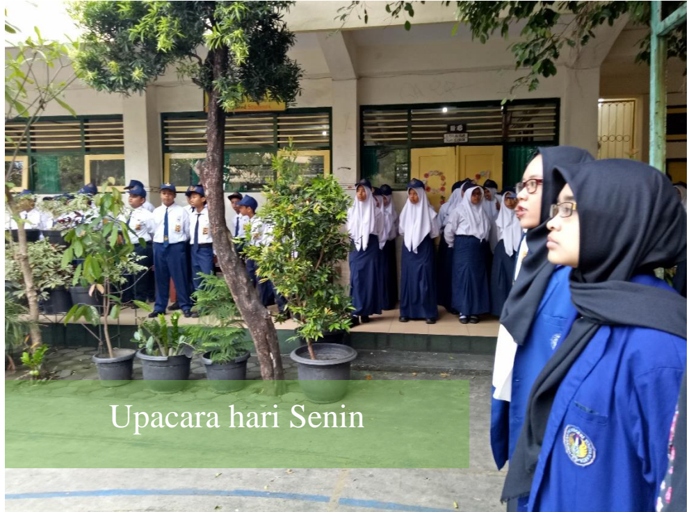
Upacara hari Senin