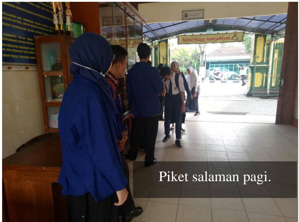
Piket salaman pagi.