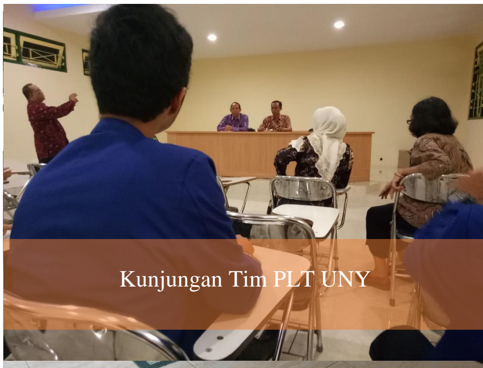
Kunjungan Tim PLT UNY