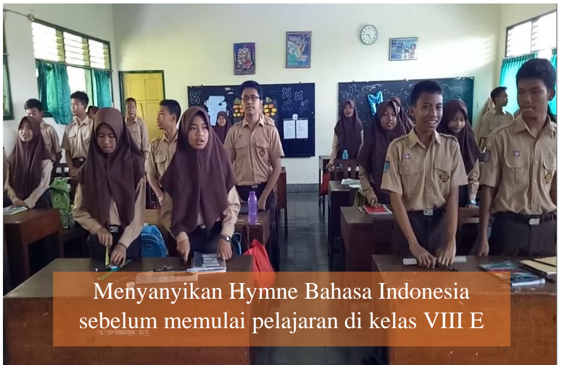
Menyanyikan Hymne Bahasa Indonesia sebelum memulai pelajaran di kelas VIII E