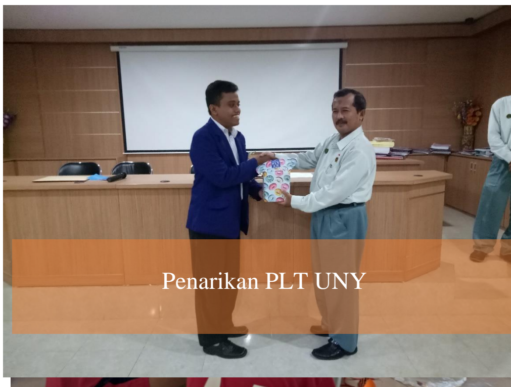
Penarikan PLT UNY