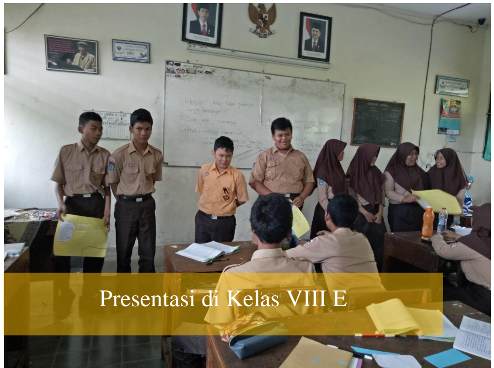
Presentasi di Kelas VIII E