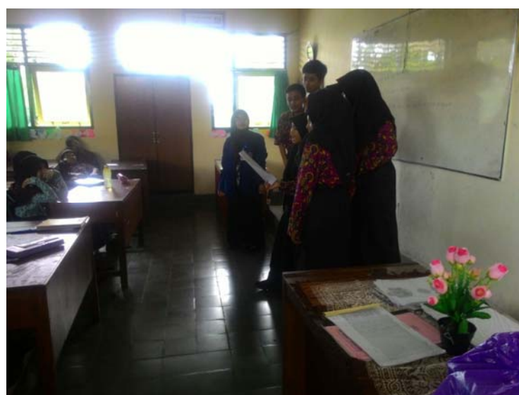
Praktik Bimbingan Klasikal