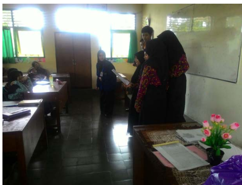
Praktik Bimbingan Klasikal