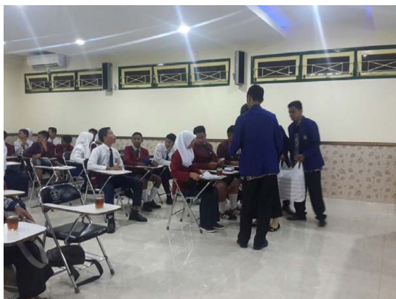
Studi Banding SMP 9 Buru Ambon