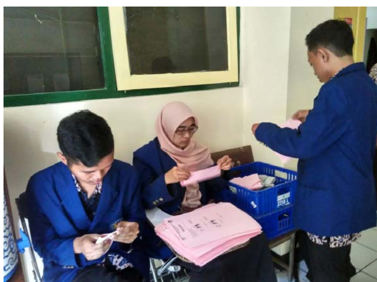
Membantu program OSIS