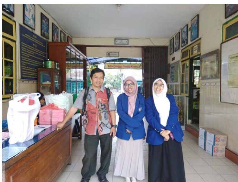
Visitasi DPL dan Bimbingan