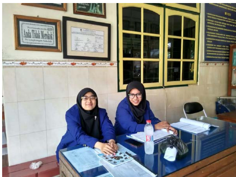
Piket Gerbang (Membantu Guru Jaga)