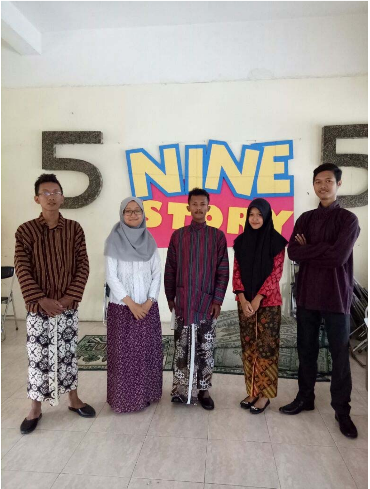
PAKAIAN ADAT JAWA ACARA KAMIS PAING