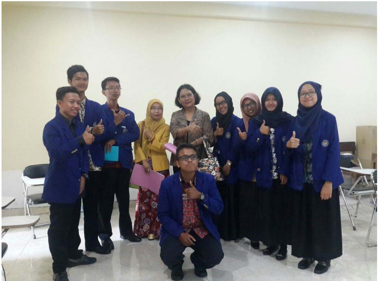
KUNJUNGAN DEKAN DAN LPPMP