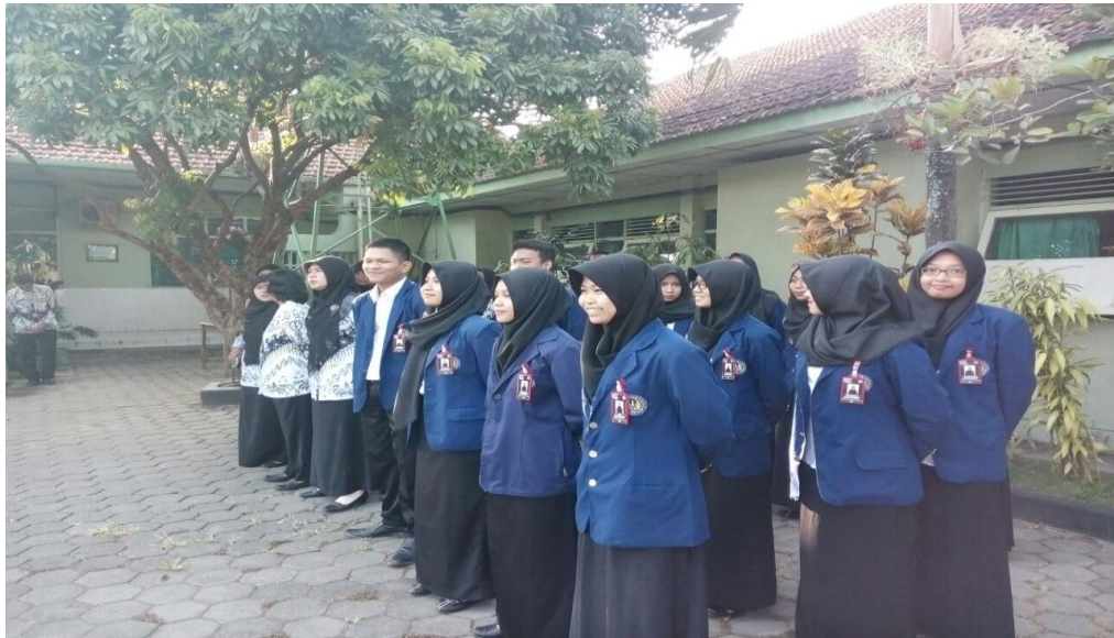
Upacara bendera Hari Senin