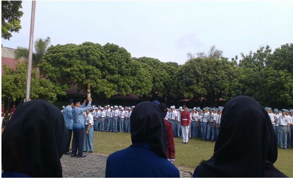
Upacara Hari Besar