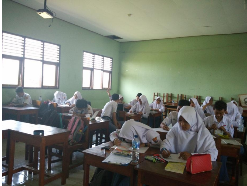
Observasi Kelas di XI IPS 3