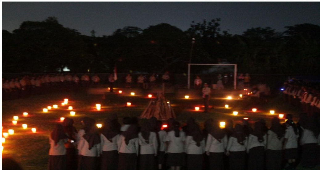
Pendampingan Kemah Perjusa