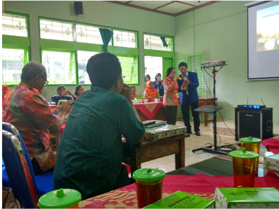
Perpisahan dan Penarikan PLT