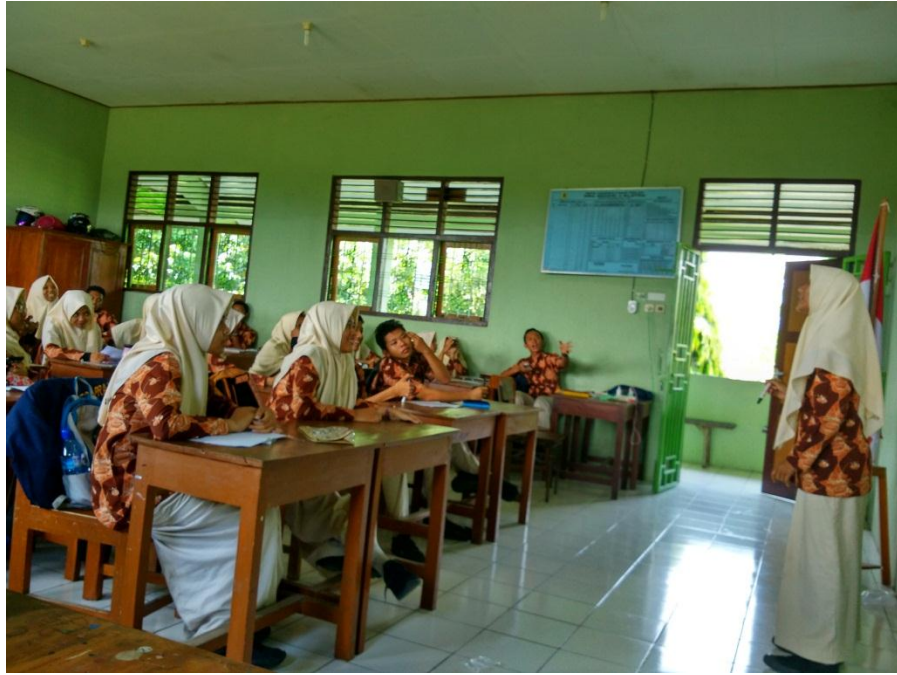
Praktik mengajar mandiri