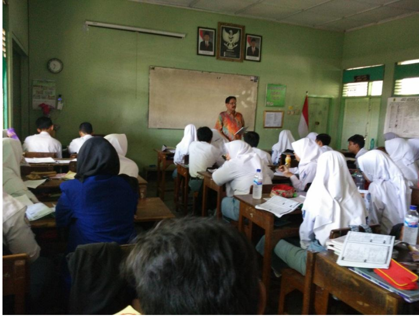
Observasi Kelas di XII IPS 3