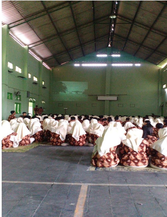
Pendampingan Menyakikan Film G30S/PKI