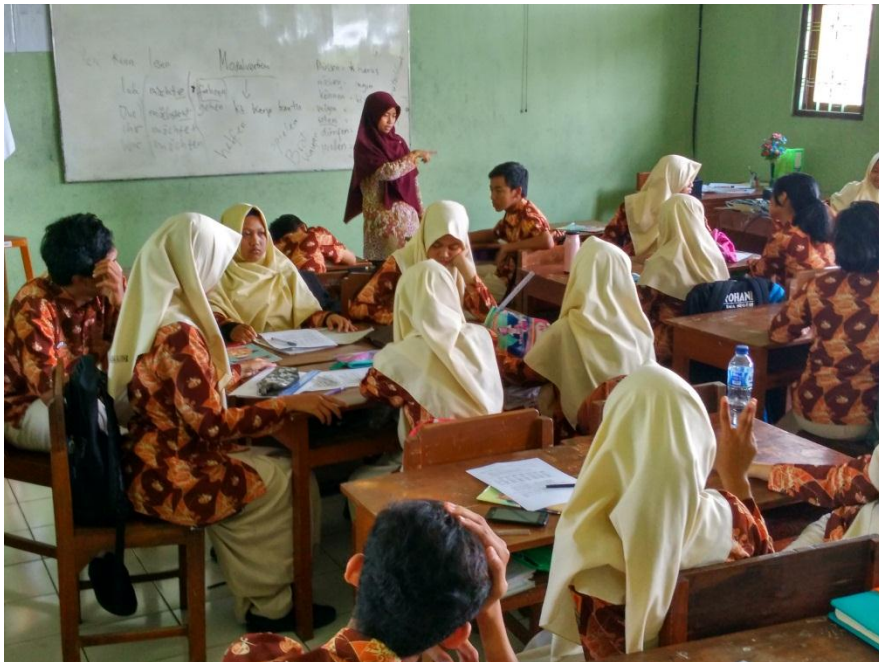
Praktik mengajar terbimbing