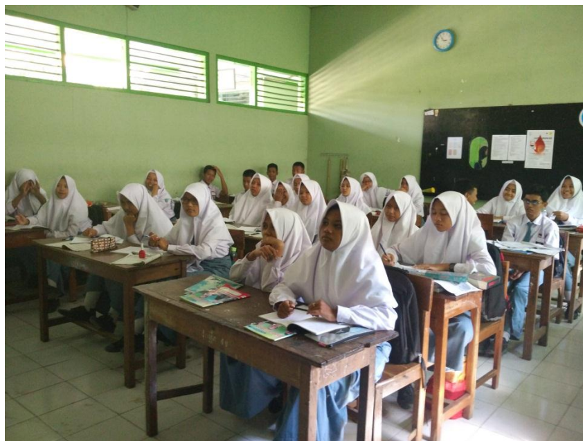
Observasi Kelas di X MIPA 7