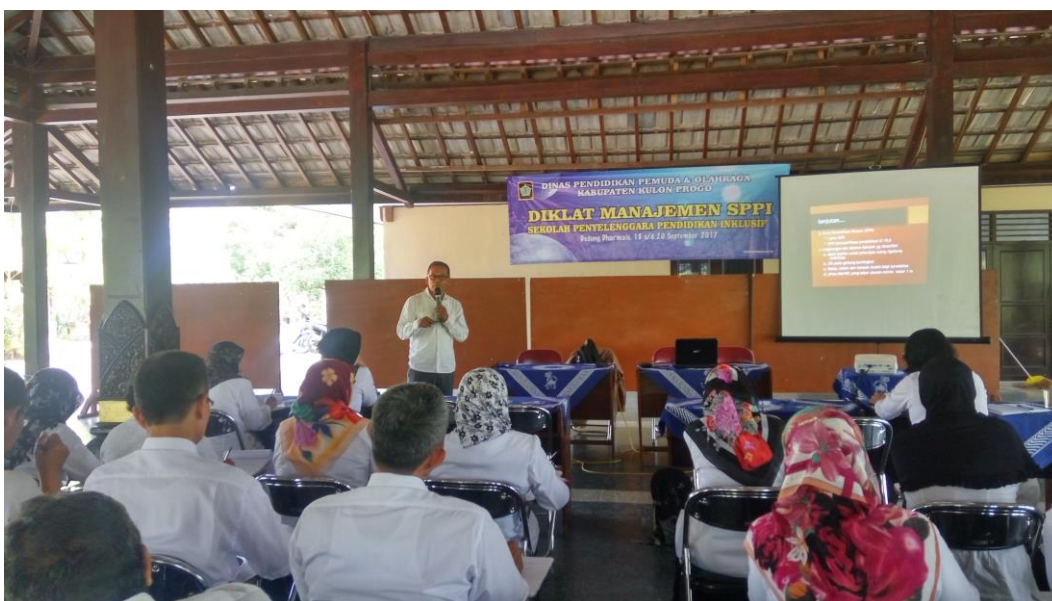
Diklat Manajemen SPPI