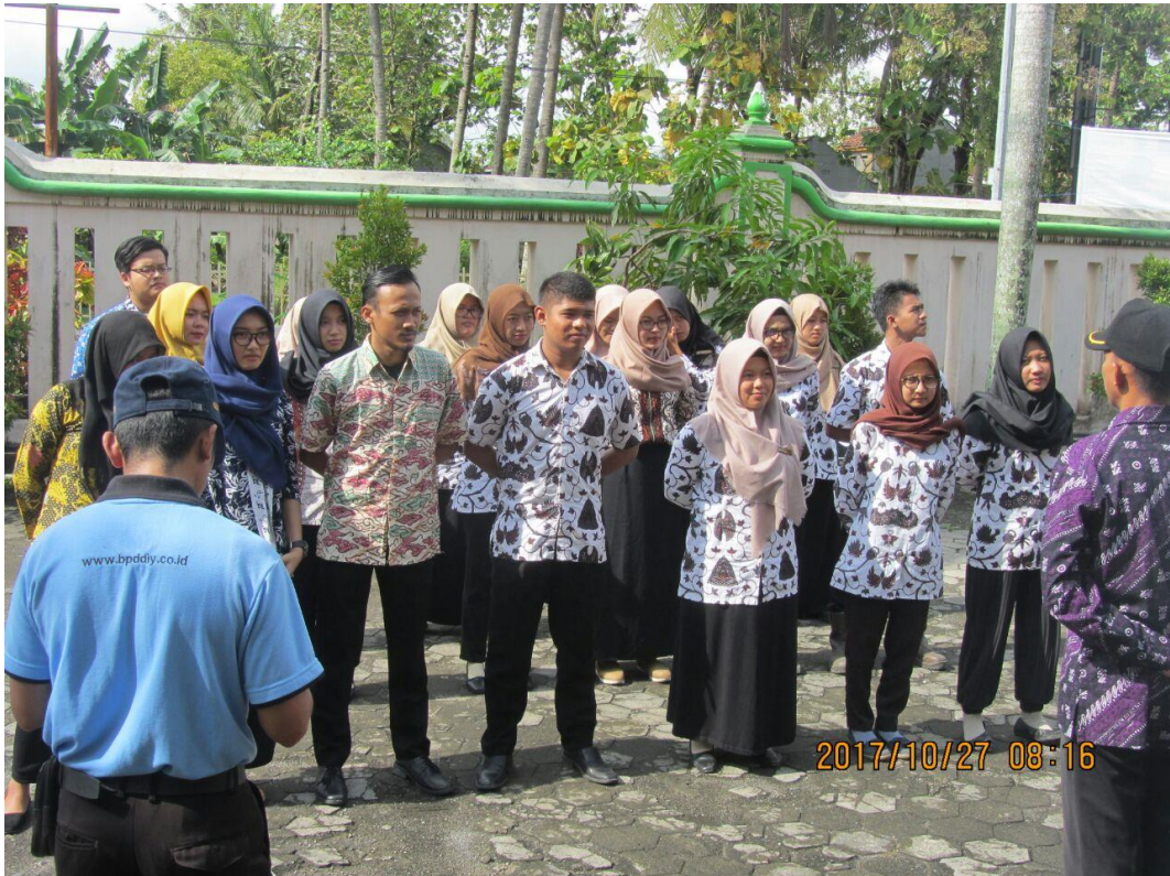
Latihan Upacara untuk Peringatan Hari Sumpah Pemuda