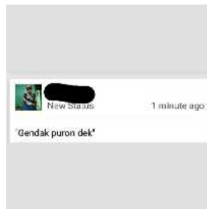
Gambar 4. Status BBM Subjek RND