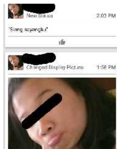
Gambar 5. Status BBM Subjek RND menunjukkan subjek pernah memiliki pacar