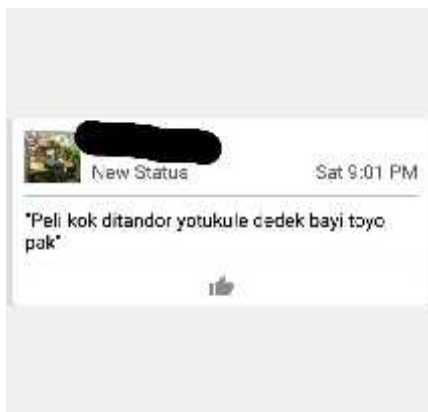
Gambar 3. Status BBM Subjek RND