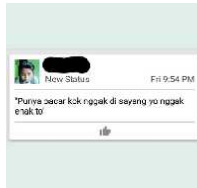
Gambar 2. Status BBM Subjek RND