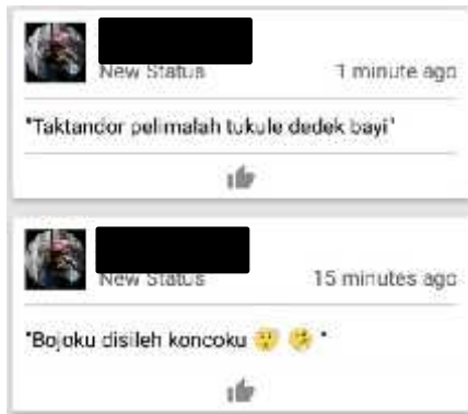
Gambar 1. Status BBM Subjek RND