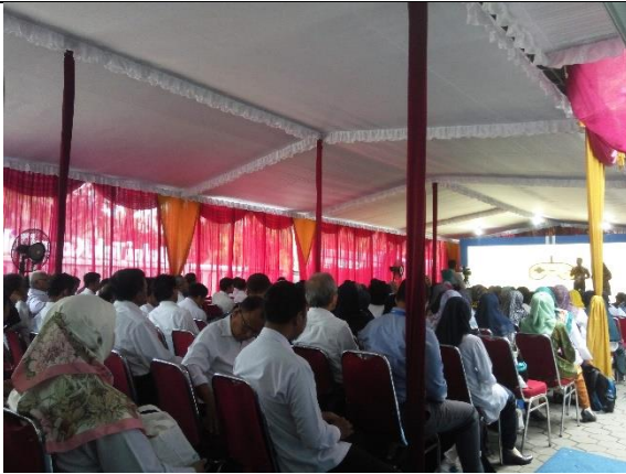
Gambar 4.18. Kegiatan Launching Produk Balai TekKomDik