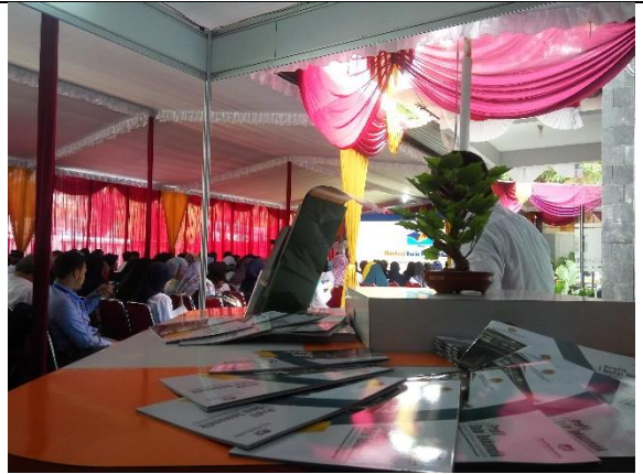
Gambar 4.19. Stand Pameran di kegiatan Launching Produk Balai TekKomDik