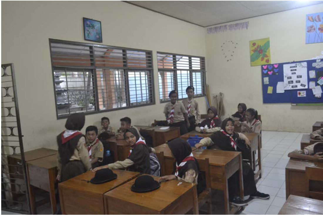
Ket:Kegiatan latihan pramuka