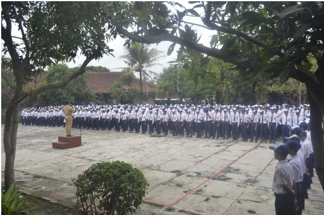
Ket: Upacara Bendera