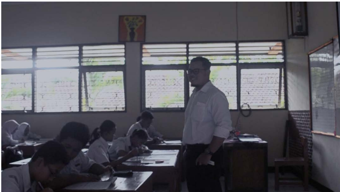
Ket: Kegiatan pembelajaran IPS