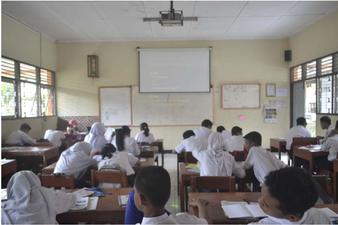
Ket: Kegiatan pembelajaran IPS