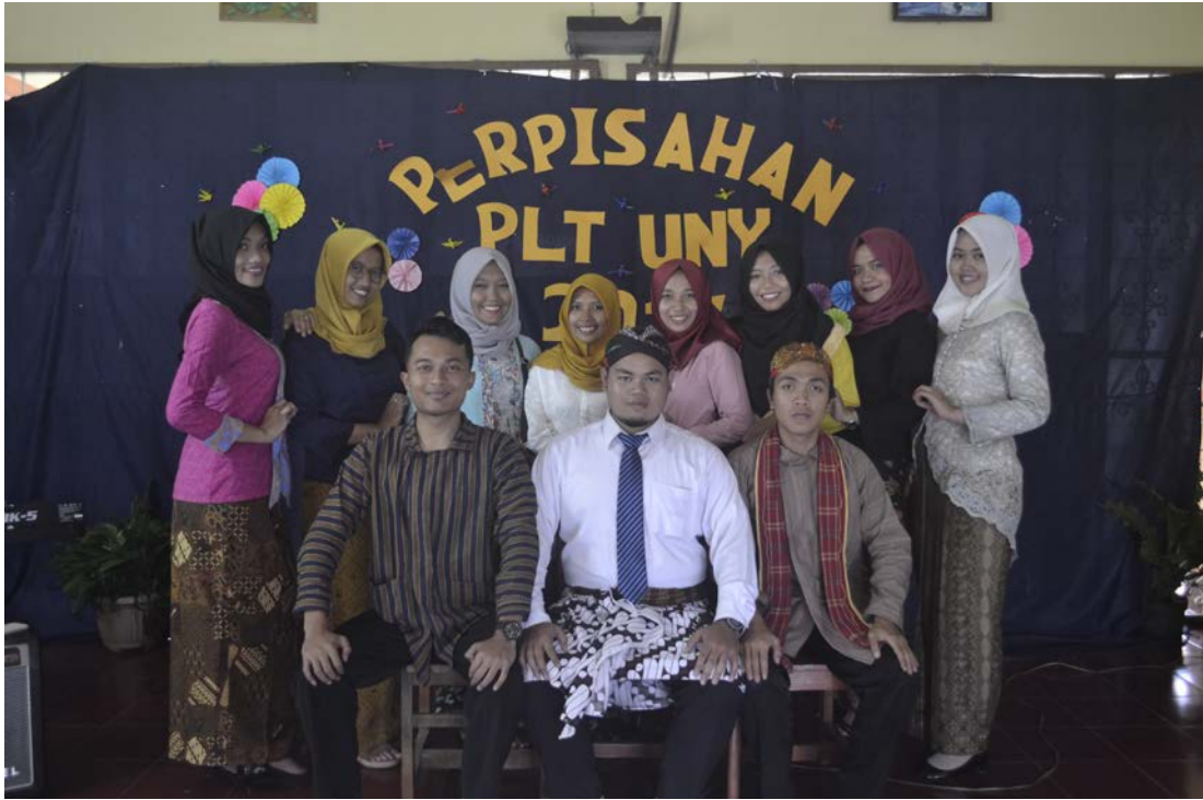
Ket: Kegiatan Perpisahan PLT UNY 2017 SMP N 10 Magelang