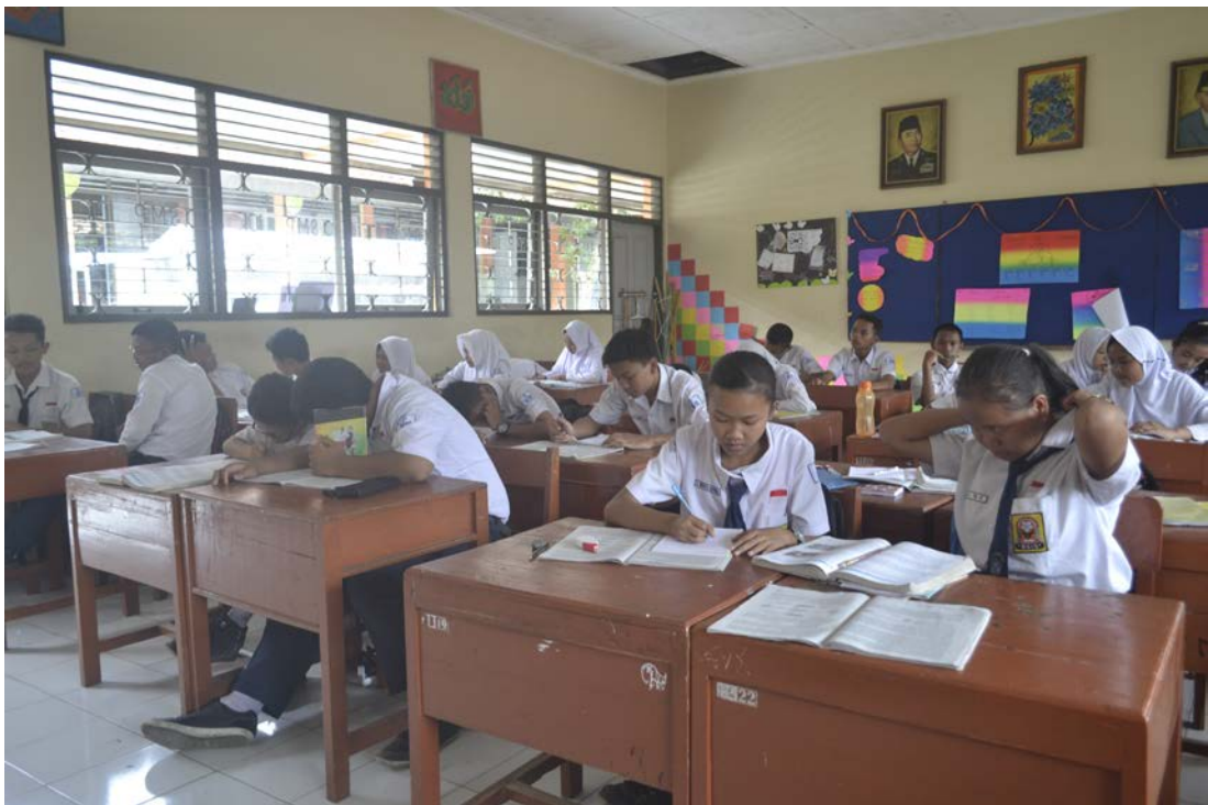
Ket: Kegiatan pembelajaran IPS