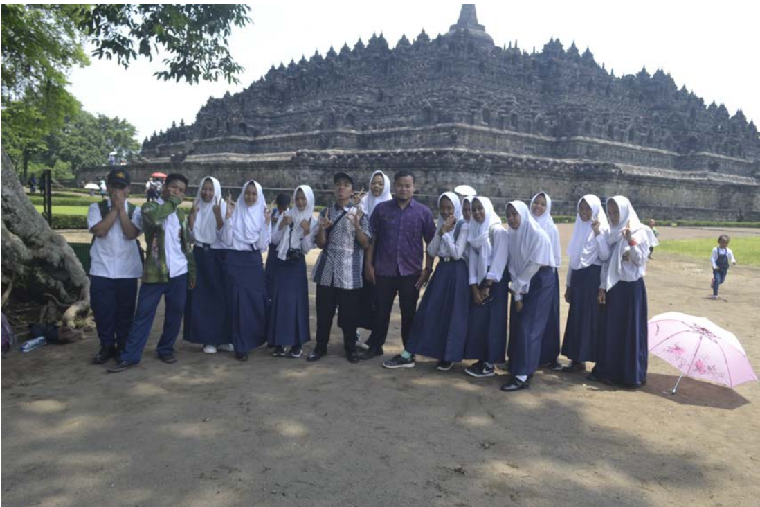
Ket: Kegiatan Hunting Tourist di Candi Borobudur