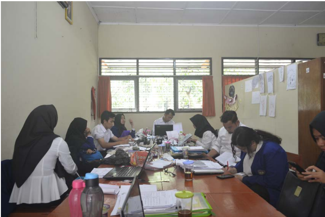
Ket: Kegiatan rutin di ruang PLT