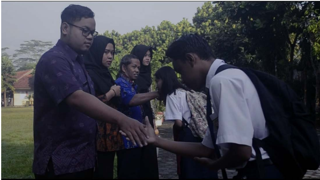
Ket: 3S Senyum, Sapa, dan Salam