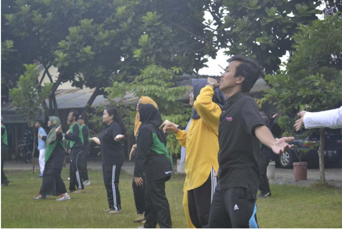
Ket: Senam Pagi