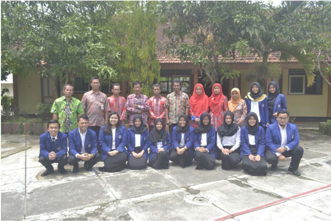
Ket: Foto Bersama penarikan PLT SMP 10 Magelang