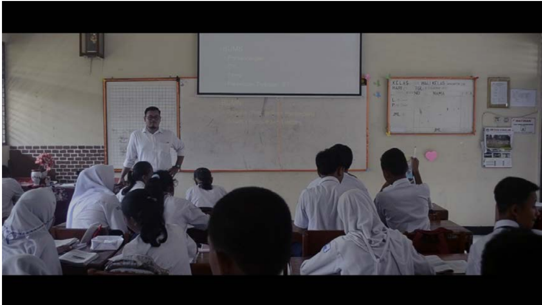
Ket: Kegiatan pembelajaran IPS