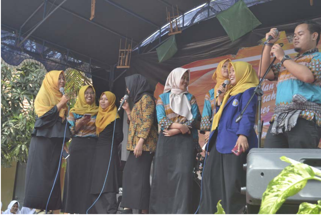
Ket: Pensi Peringatan Bulan Bahasa