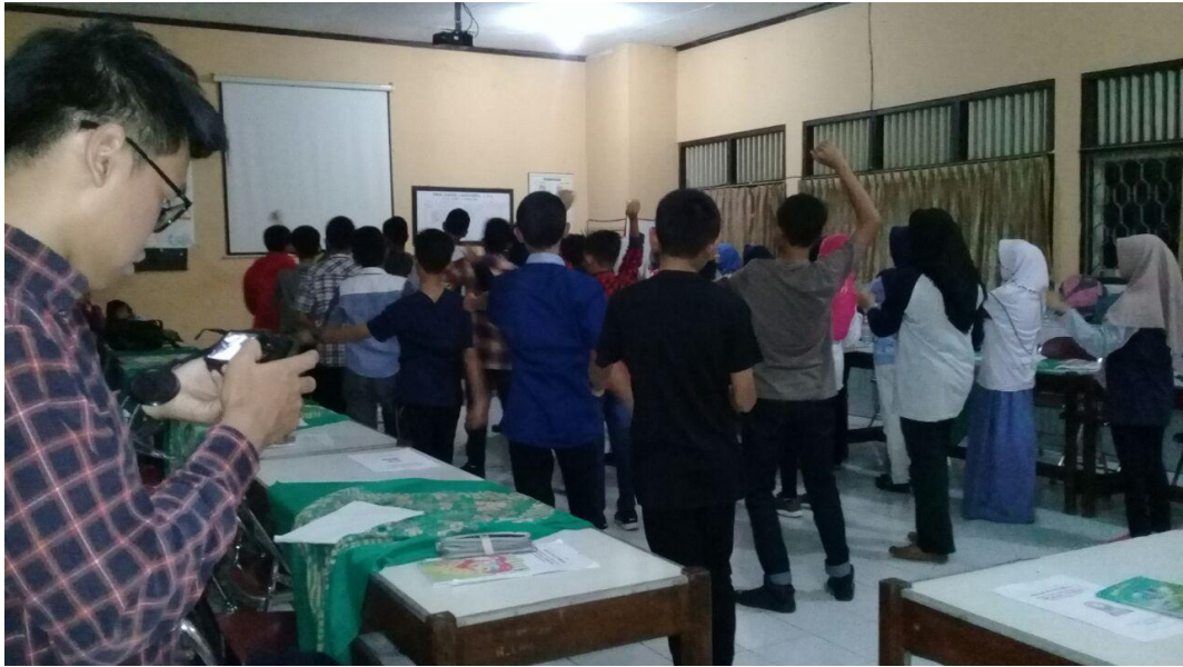
KEGIATAN LDKS (LATIHAN DASAR KEPEMIMPINAN SISWA)