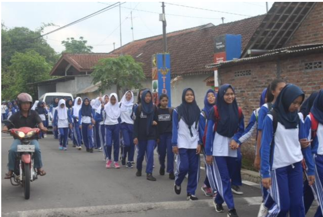
JALAN SANTAI (PERPISAHAN PLT UNY 2017)