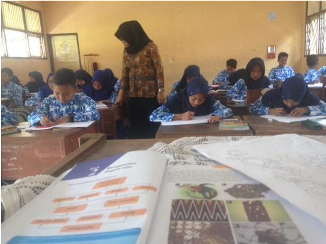
KEGIATAN BELAJAR MENGAJAR