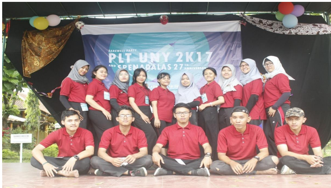
PERPISAHAN PLT UNY 2017