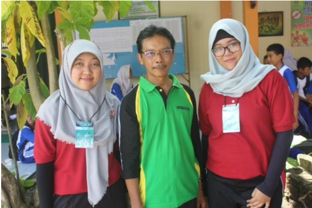
PLT UNY SENIRUPA DENGAN GURU PAMONG