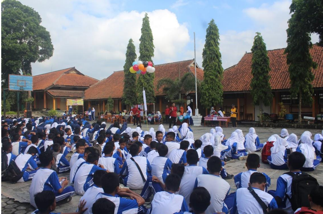
PERPISAHAN PLT UNY 2017 & HUT SMPN 12 MAGELANG