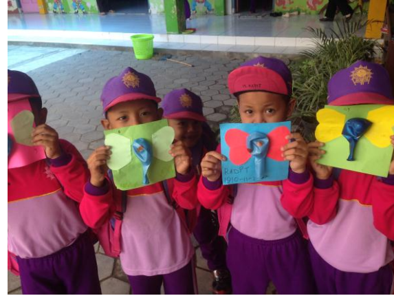
Hasil Karya Anak