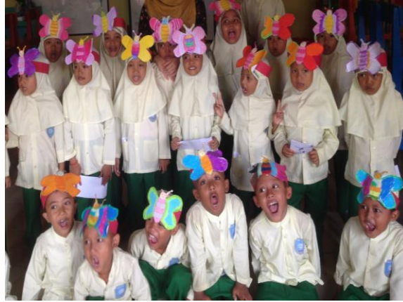
Hasil Karya anak