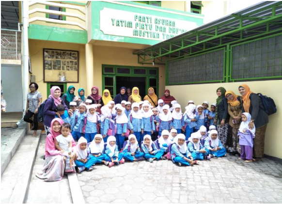
Kunjungan ke Panti Asuhan