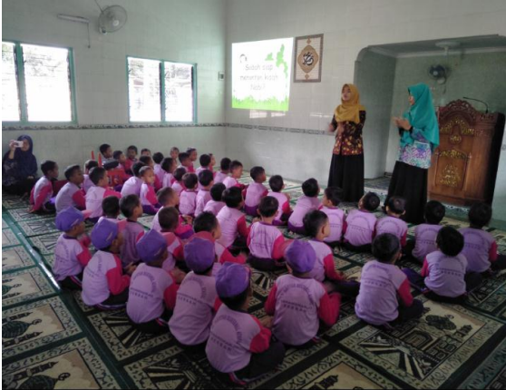
Nonton film edukatif