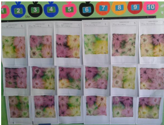
Hasil Karya anak