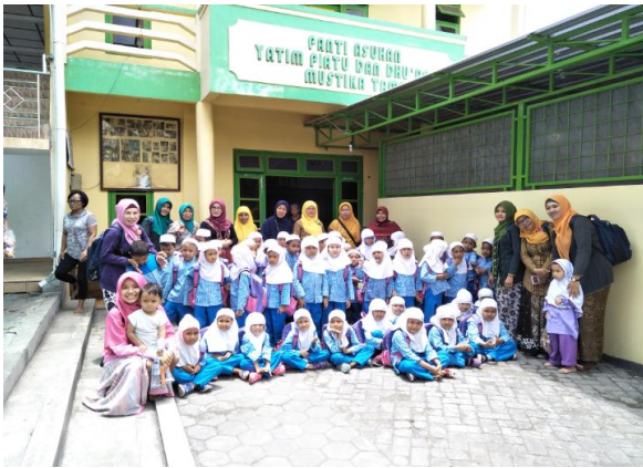
Kunjungan ke Pantia Asuhan