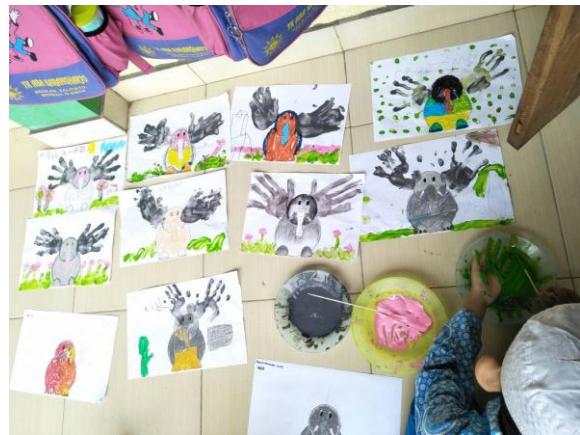
Hasil Karya Anak