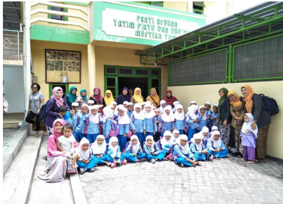
Kunjungan ke Panti Asuhan