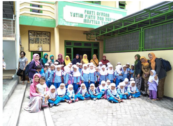
Kunjungan ke Pantia Asuhan