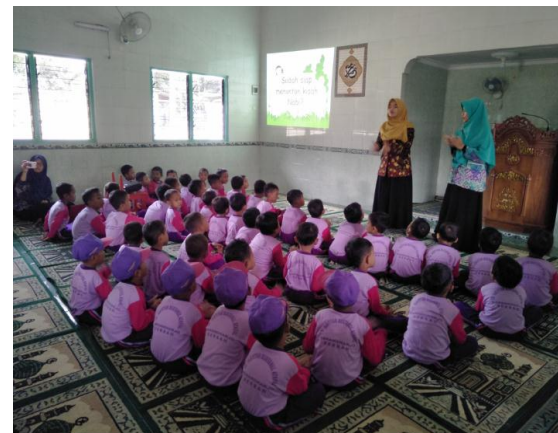
Nonton film edukatif