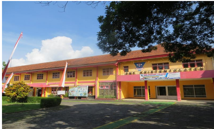
Gambar 1. Bangunan Depan SMK Kristen 1 Klaten

SMK Kristen 1 Klaten berdiri pada tanggal 1 Agustus 1965 menempati gedung SD Krsiten III yang dahulu berada di jalan Pemuda Selatan, kemudian dipindah ke SMP Kristen 1 Klaten. Pada awalnya, kegiatan operasional masih didukung oleh 10 orang guru, 1 tenaga kantor, dan 1 orang pesuruh dengan jumlah kelas sejak pertama kali berdiri berjumlah 6 kelas. Kemudian pada tahun 1977 menempati gedung sendiri yang berada di jalan Diponegoro, Gumulan, Klaten. Menempati luas tanah 23.280 m 2 dan sampai sekarang telah memiliki 7 ruang praktik/bengkel dan 18 ruang kelas.