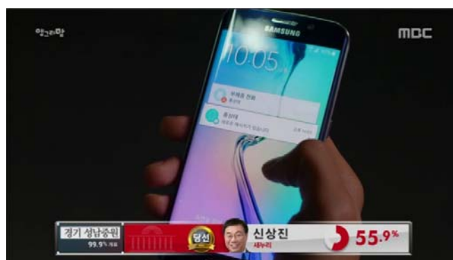
Gambar 2. Penyisipan produk Samsung S6 Edge dalam drama “Angry Mom”

Produk ponsel Samsung merupakan benda nyata dalam kehidupan sehari-hari dan merupakan product placement utama dari drama “Angry Mom”. Selama 16 episode, Samsung Galaxy S6 Edge terlihat digunakan oleh hampir semua tokohnya dan muncul di dalam berbagai konten cerita.