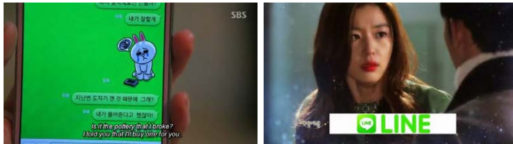
Gambar 1. LINE dalam You Who Come from the Stars.

Lome (di dalam Subianti & Hudrasyah, 2013: 168) menyatakan tentang penggunaan product placement dalam drama bahwa “ This is all because real people, after all, use real products to see a more real setting is created with the use of real and existing products in the movie ”. Penggunaan benda nyata pada karakter dalam drama memberikan kesan familiaritas pada kehidupan nyata sehingga produk yang diiklankan lebih dapat diterima.