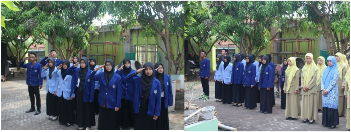
Foto bersama peserta didik