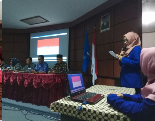
Figure 8 Memandu acara