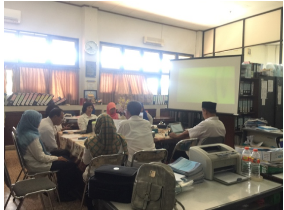
Figure 2 Pelaksanaan rapat koordinasi