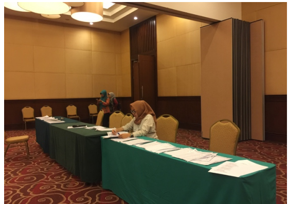
Figure 5 mendampingi Absensi