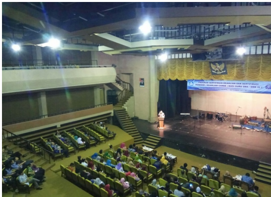
Figure 3 mengikuti penutupan pelatihan