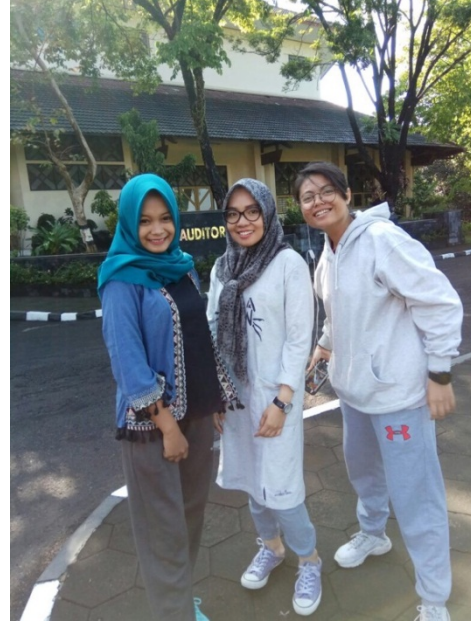
Figure 16 mengikuti senam sehat setiap Jumat