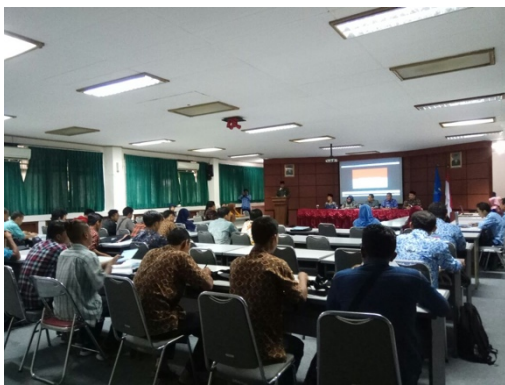
Figure 4 Kunjungan MGMP Tegal