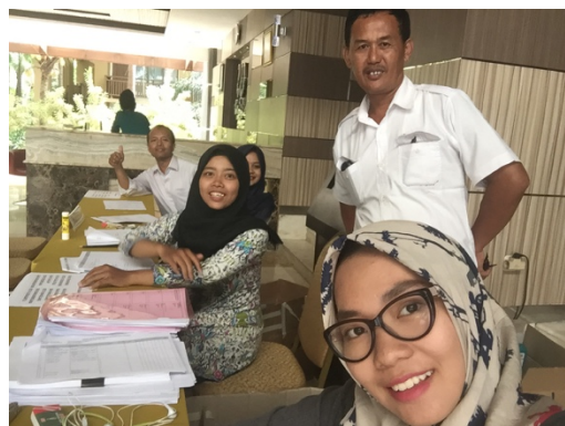
Figure 6 Check In Peserta pelatihan