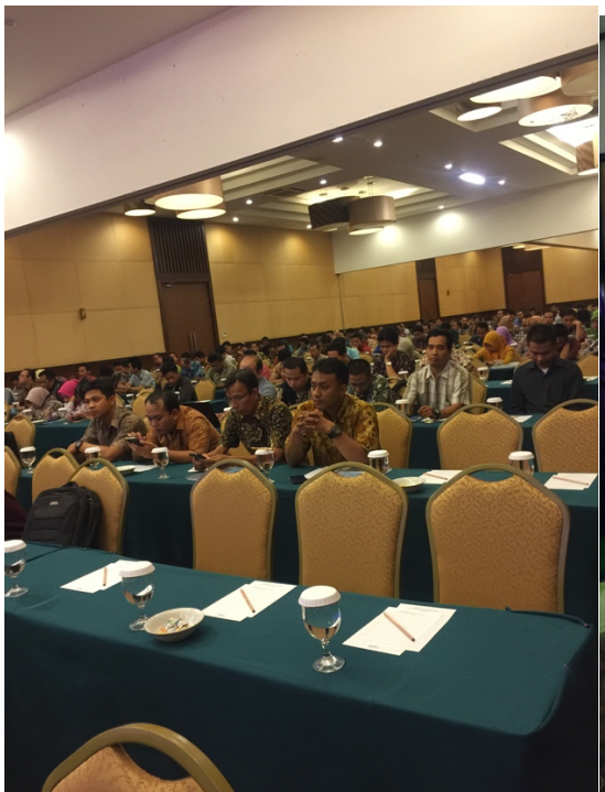
Figure 13 Peserta pelatihan RAKOR Post test