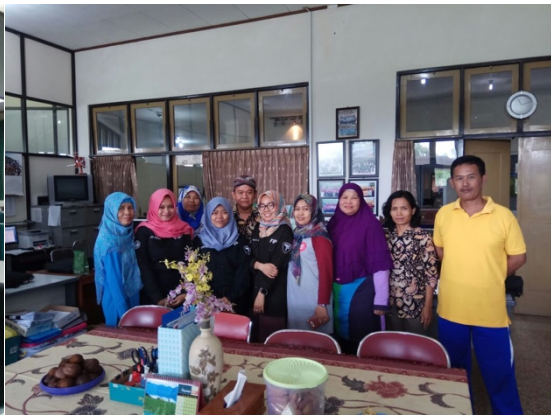
Figure 10 mahasiswa magang dan staf penyelenggaraan