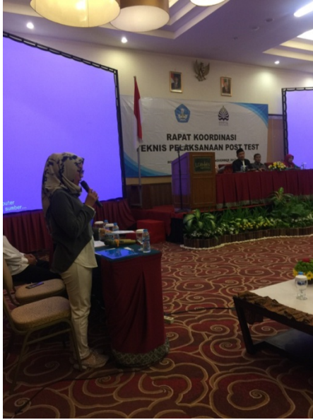
Figure 15 Memandu acara di Lorin Solo