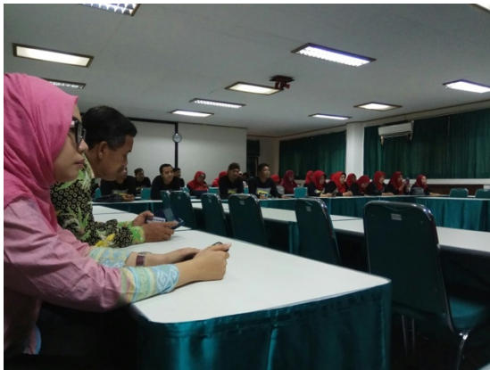
Figure 9 Menjadi panitia kegiatan