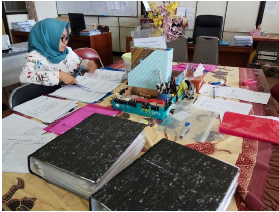
Figure 7 Arsip dan pendataan dokumen