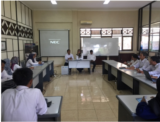
Figure 1 Pelaksanaan workshop TIK untuk Internal