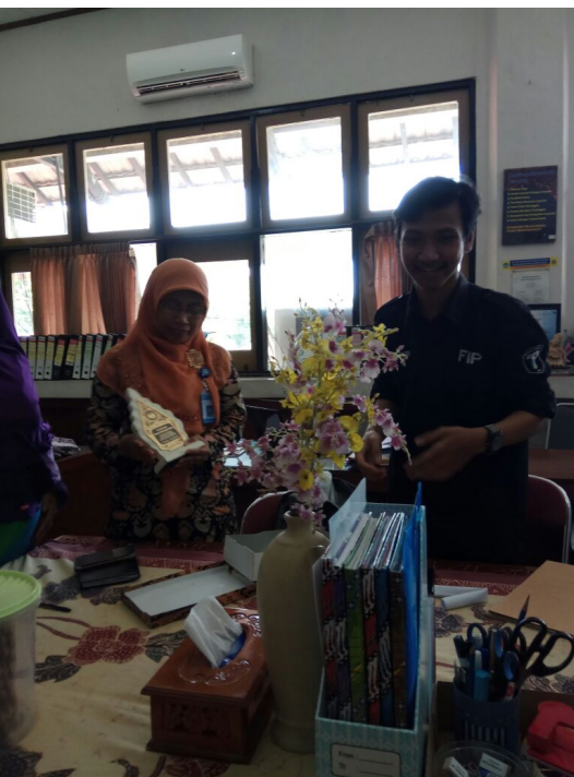
Figure 14 Penarikan mahasiswa PLT