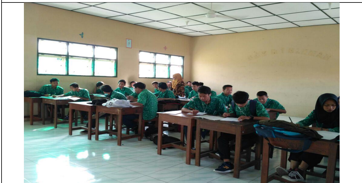
Dokumentasi mengajar di kelas XI MM 1