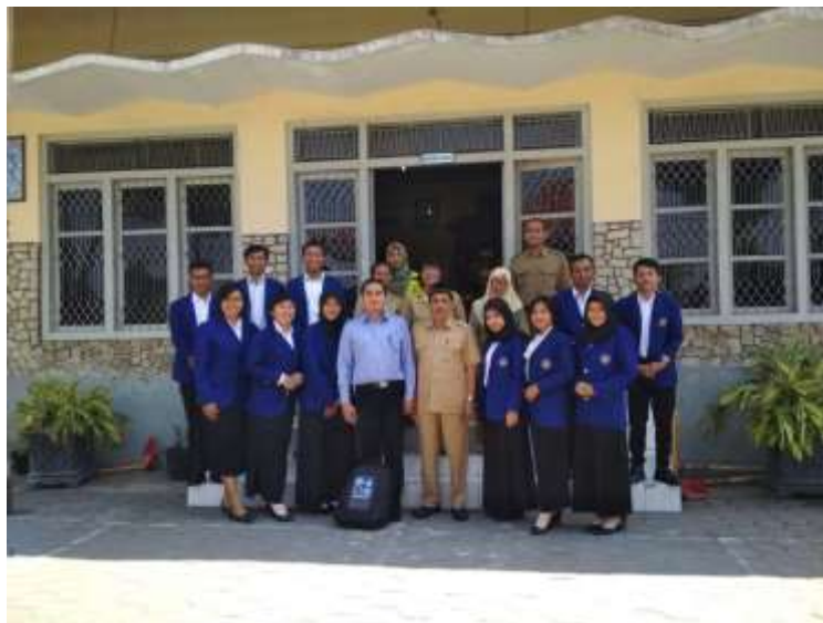
Penerjunan PLT di SMP Negeri 3 Pakem yang dilaksanakan di aula sekolah