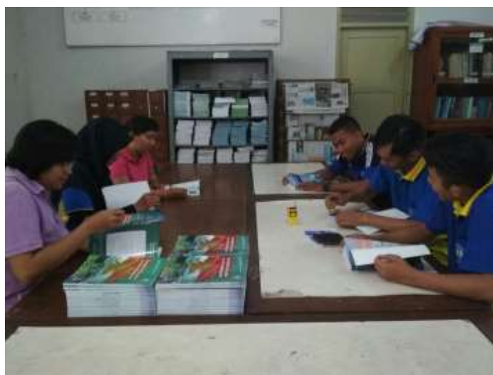
Pengecapan buku yang dilaksanakan di Perpustakaan SMP Negeri 3 Pakem