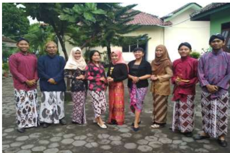
Kamis Paingan di SMP Negeri 3 Pakem