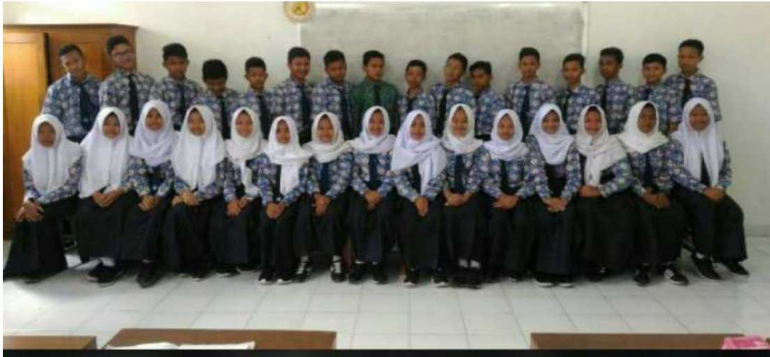
Siswa-siswi kelas 8C