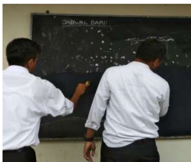
Pengecatan papan pengumuman yang terletak di depan Perpustakaan SMP Negeri 3 Pakem