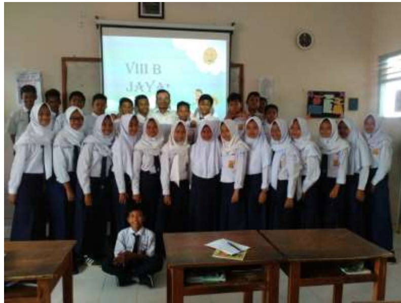
Siswa-siswi kelas 8B