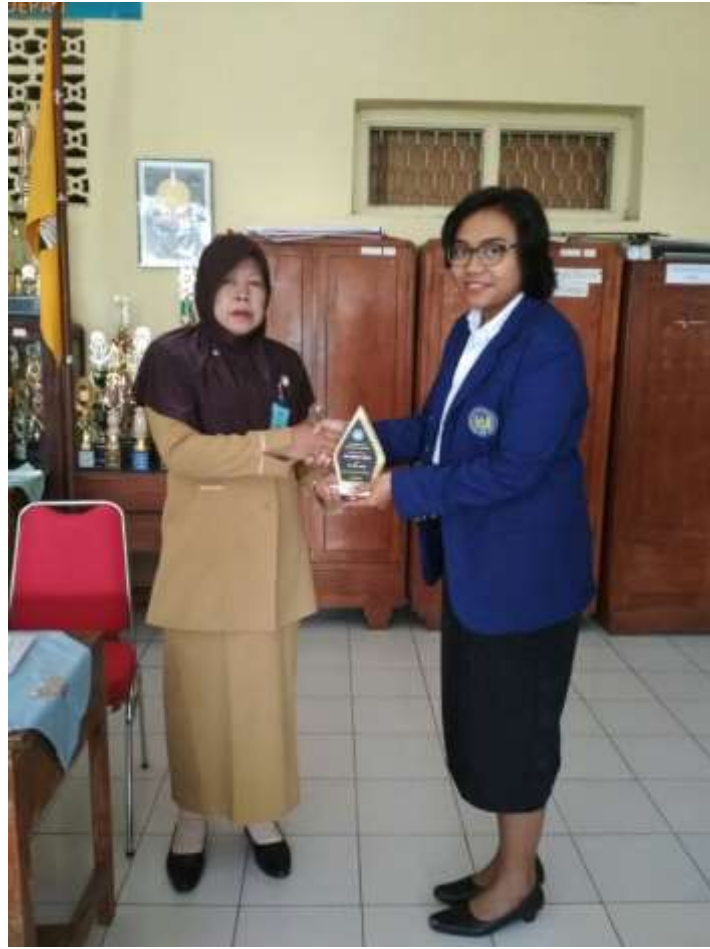
Perpisahan dan penarikan di SMP Negeri 3 Pakem