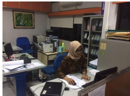
(Evaluasi Penyelenggaraan Pelatihan)