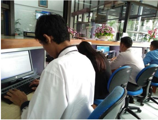
(Register Work Order)