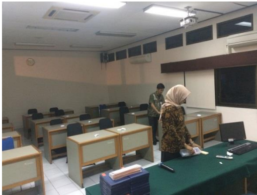
(Desain Kelas Pelatihan)