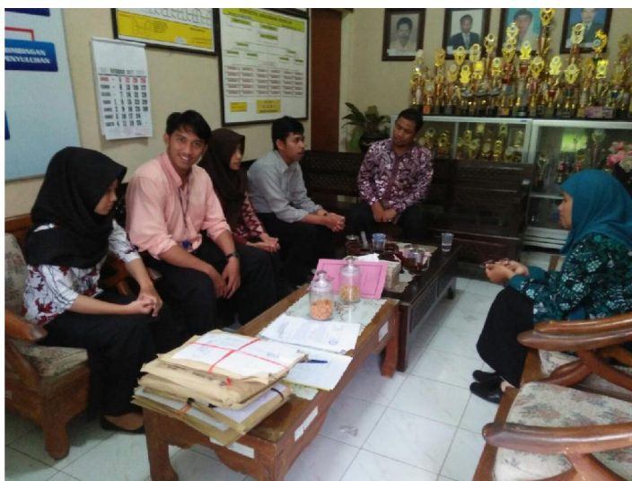
Penerjunan PLT UNY 2017 di SMP N 3 Tempel