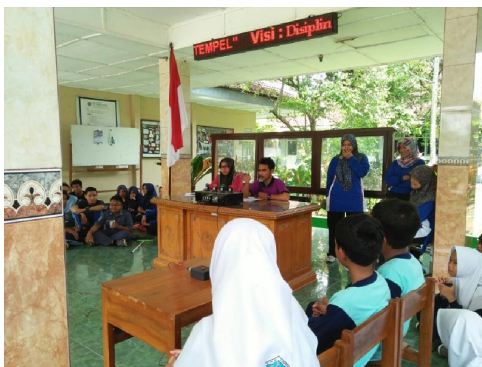
Lomba cerdas cermat bahasa Jawa dalam rangka HUT SMP N 3 Tempel