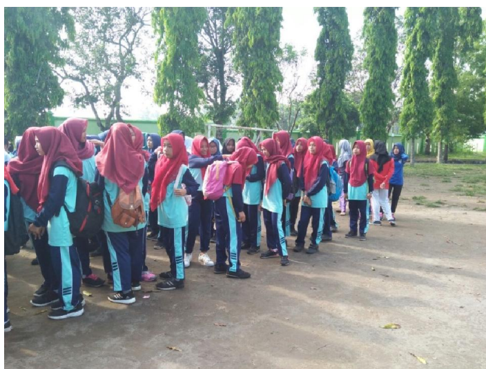
Persiapan jalan sehat pada acara HUT SMPN 3 Tempel