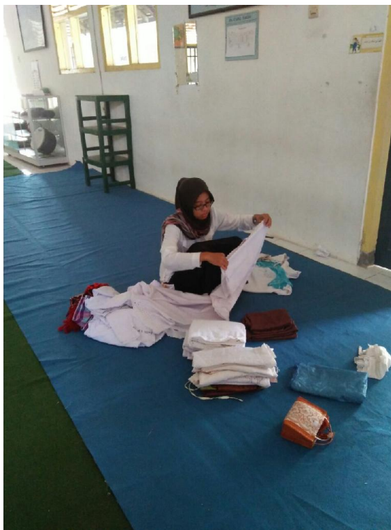
Inventarisasi mushola SMP N 3 Tempel