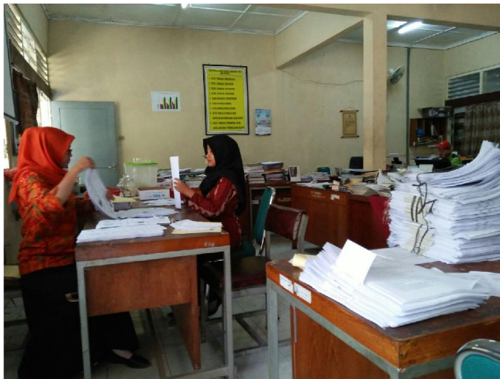
Persiapan pelaksanaan Ujian Tengah Semester