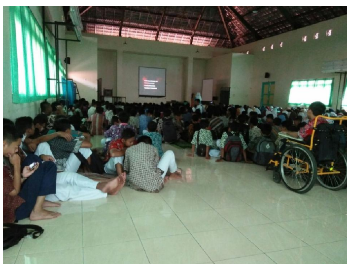
Menonton film G30S PKI bersama seluruh anggota sekolah