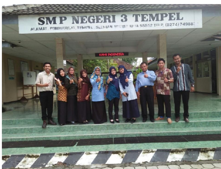
Bersama kepala sekolah dan dosen pembimbing lapangan dan