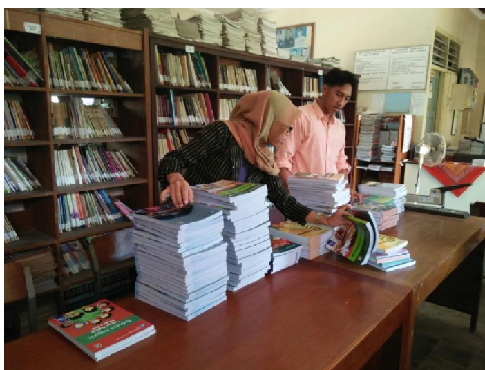
Inventarisasi perpustakaan dan pembagian buku paket