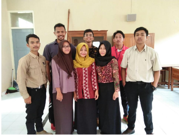
Mahasiswa PLT UNY 2017 di SMPN 3 Tempel