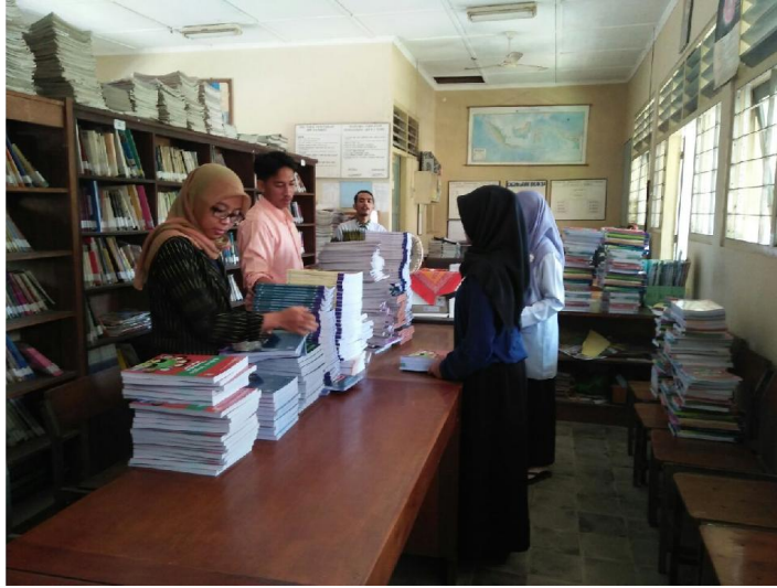
Inventarisasi Perpus dan pembagian buku paket