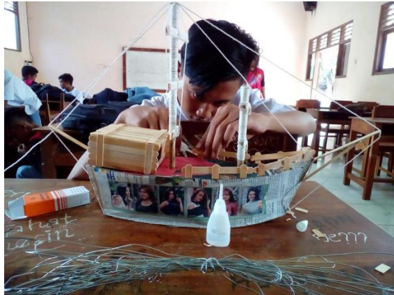
Gambar 1. Mengajar Kelas TSM