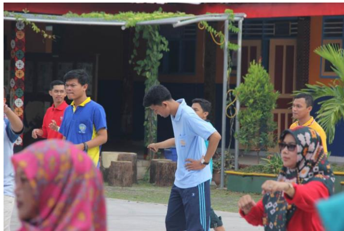
Gambar 3. Senam hari Sabtu