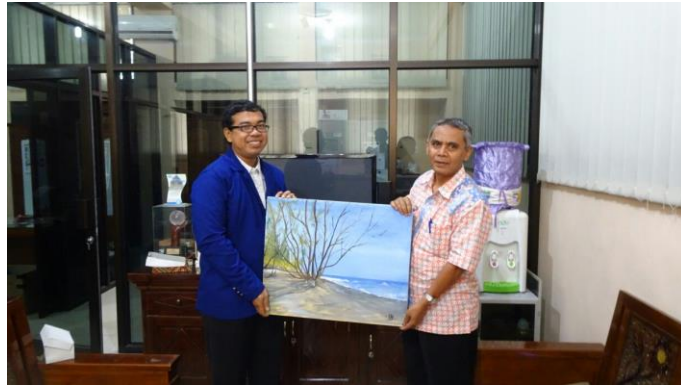
Gambar 4. Pemberian Kenang-kenangan berupa Lukisan