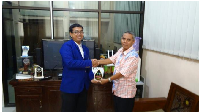
Gambar 6. Pemberian Kenang-kenangan berupa Vandel