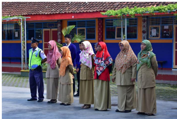
Gambar 4. Apel hari Senin