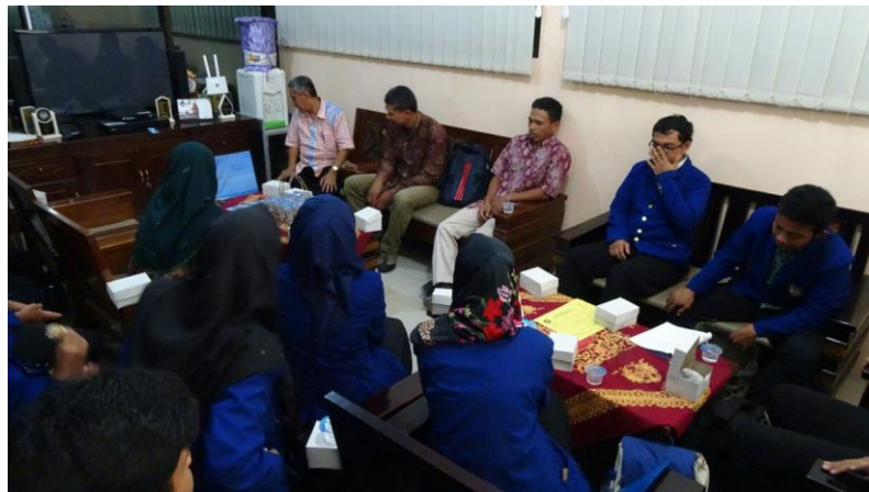
Gambar 7. Penarikan PLT