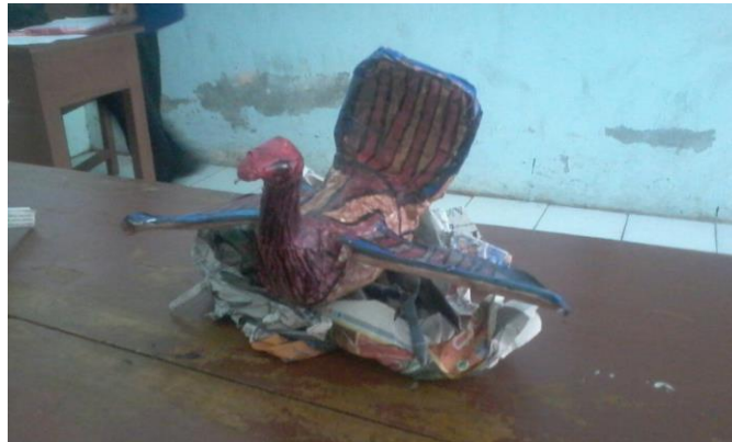
Gambar 3. Salah Satu Karya Kelas TKR