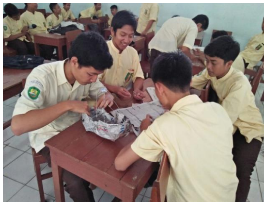
Gambar 2. Mengajar Kelas TKR