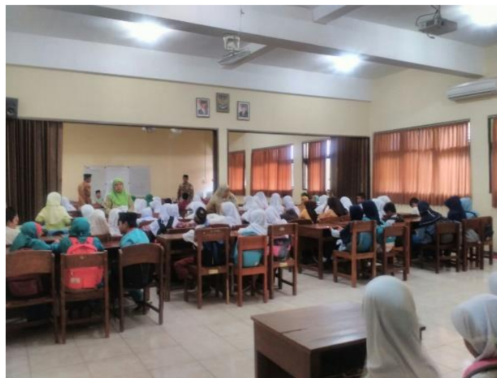
Gambar 11. Kegiatan mahasiswa dalam mendampingi para peserta didik berlomba dalam lomba keagamaan se-kecamatan berlokasi di SMK N 1 Jetis Bantul.