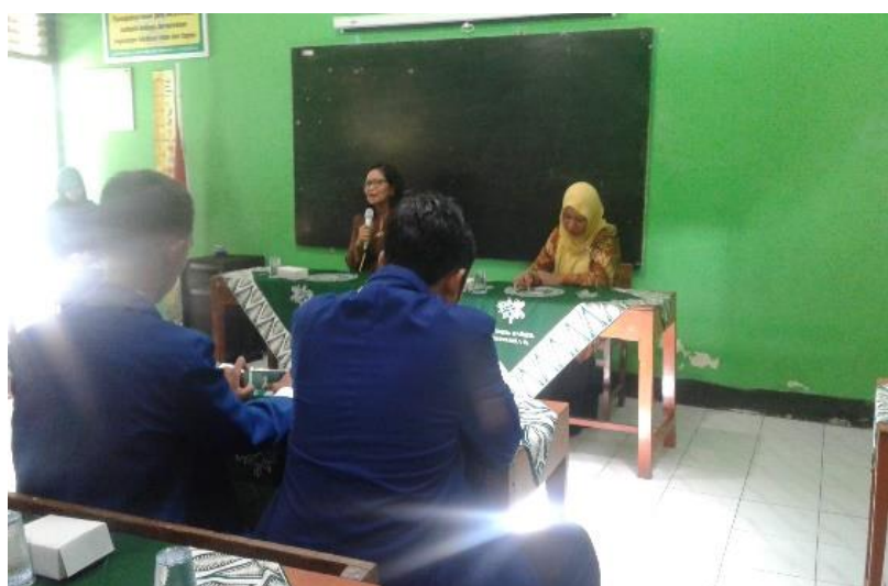
Gambar 18. Penarikan mahasiswa PLT yang dihadiri oleh Dosen Pembimbing Lapangan dibersamai oleh para guru dan karyawan SD Negeri 1 Tirrenggo.