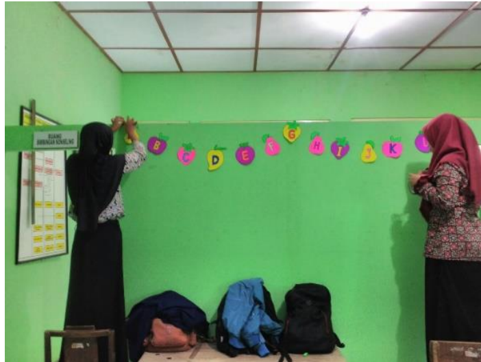
Gambar 13. Penataan Ruang Sumber (Inklusi) dengan membuat berbagai hiasan yang seklaigus bisa menjadi media pembelajaran menarik bagi anak berkebutuhan khusus.