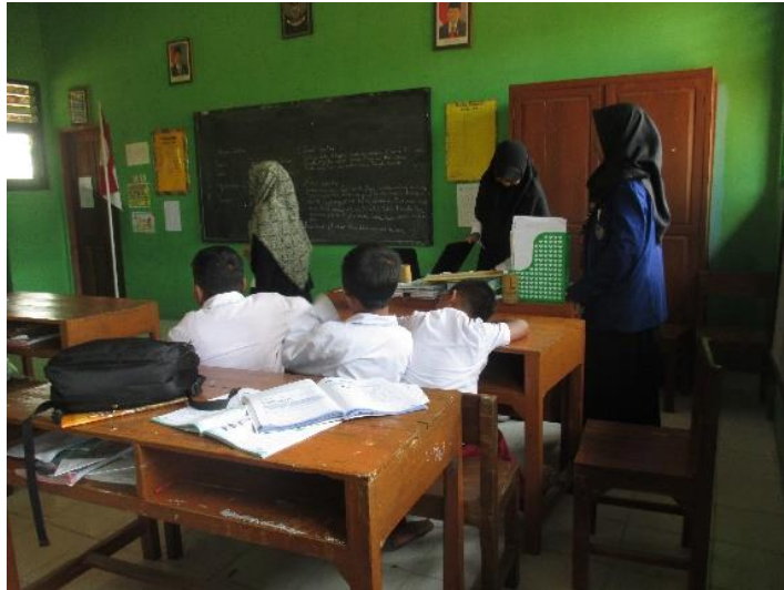
Gambar 8. Pelaksanaan sosialisasi penerimaan sosial ABK pada peserta didik secara umum yang diselenggarakan di kelas 4 dan 5.