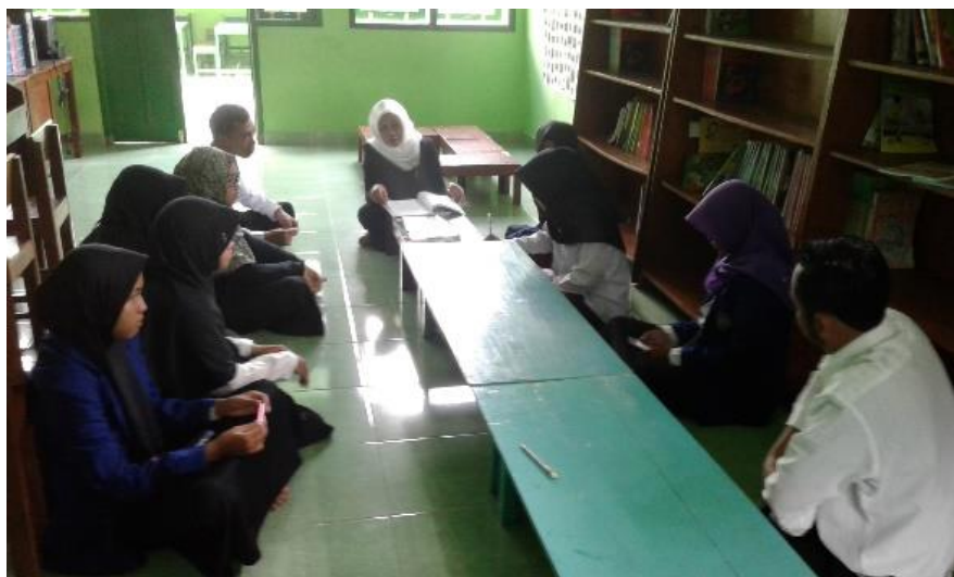
Gambar 12. Rapat koordinasi seluruh mahasiswa PLT dengan Kepala SD Negeri 1 Trirenggo guna membahas keberlangsungan program PLT.