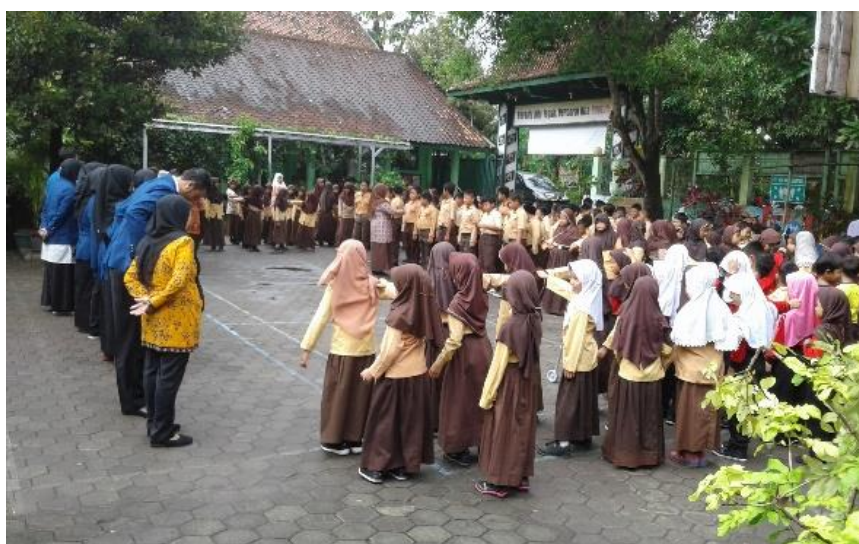
Gambar 17. Apel pagi dalam rangka acara perpisahan dan penarikan mahasiswa PLT UNY bersama seluruh peserta didik dan para guru di halaman sekolah.