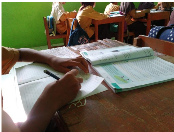
Gambar 16. Kegiatan pendampingan peserta didik berkebutuhan khusus saat berada di dalam kelas.