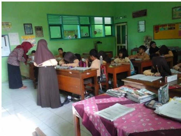
Gambar 1. Mahasiswa ikut serta membantu proses Kegiatan Belajar Mengajar dengan mengisi (mengajar) di kelas secara klasikal (kelas besar).