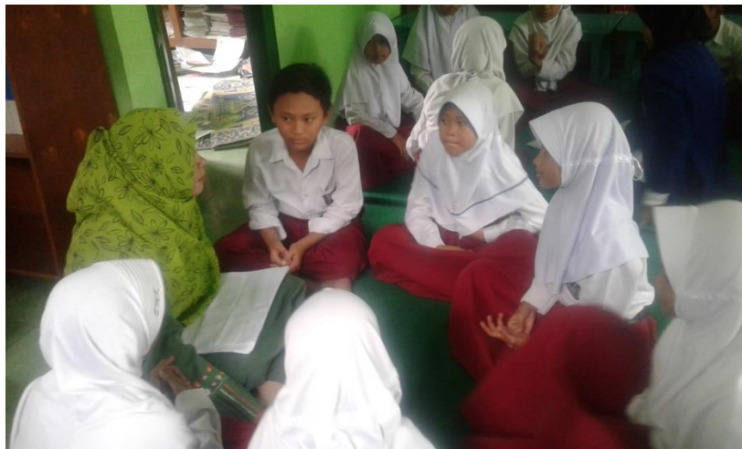
Gambar 13. Membriving siswa kader pengelolaan sampah untuk persiapan seleksi adiwiyata.