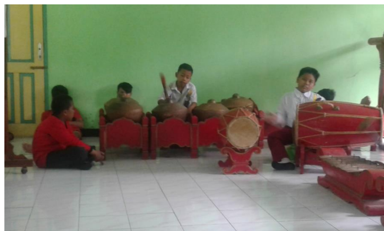
Gambar 17. Kegiatan pendampingan peserta didik berkebutuhan khusus saat pelajaran karawitan.