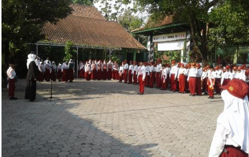
Gambar 4. Pelaksanaan Upacara Bendera dalam rangka Memeringati Hari Pahlawan 10 Nopember 2017 di halaman sekolah.