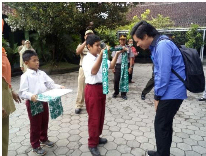
Gambar 14. Penyambutan oleh peserta didik dalam rangka kedatangan para asesor dari DKI Jakarta yang datang untuk melakukan penilaian sekolah Adiwiyata Tingkat Nasional