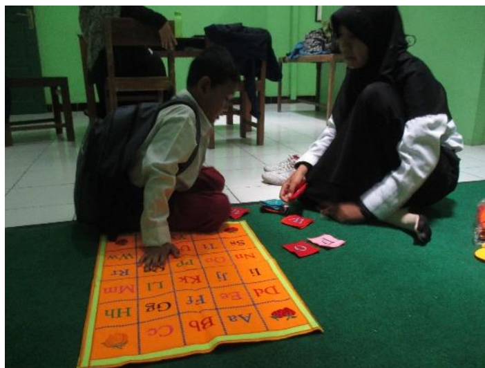
Gambar 2. Kegiatan pendampingan peserta didik berkebutuhan khusus saat berada di Ruang Sumber (Inklusi).