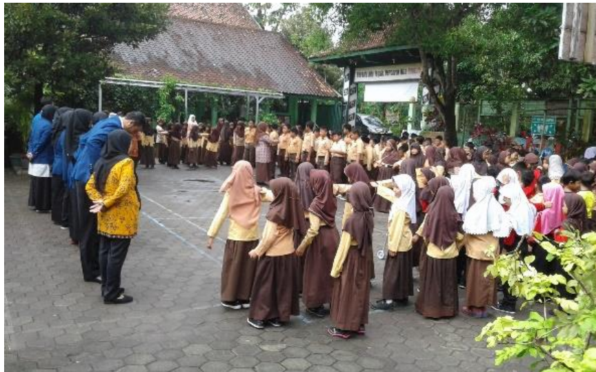
Gambar 19. Apel pagi dalam rangka acara perpisahan dan penarikan mahasiswa PLT UNY bersama seluruh peserta didik dan para guru di halaman sekolah.