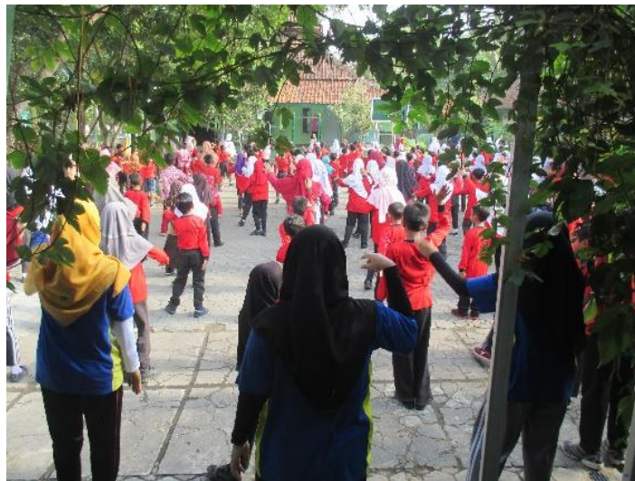
Gambar 5. Kegiatan senam rutin yang dilaksanakan di halaman sekolah setiap hari Jum'at pagi.