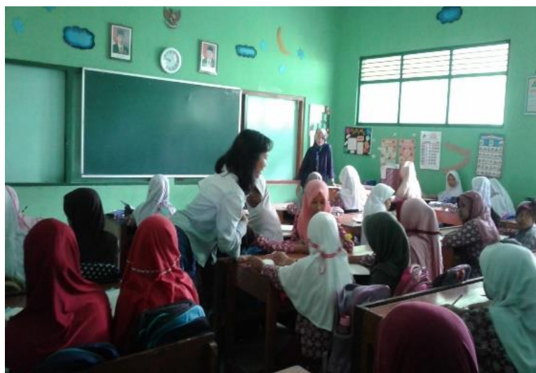
Gambar 11. Pelaksanaan kegiatan pendidikan seksual bagi anak usia sekolah dasar kelas 4 dan 5.