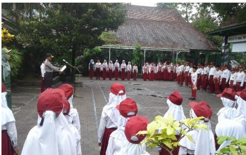
Gambar 3. Pelaksanaan Upacara Bendera rutin setiap hari Senin di halaman sekolah.