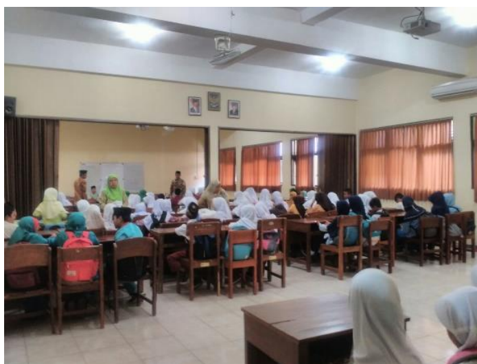
Gambar 11. Kegiatan mahasiswa dalam mendampingi para peserta didik berlomba dalam lomba keagamaan se-kecamatan berlokasi di SMK N 1 Jetis Bantul.