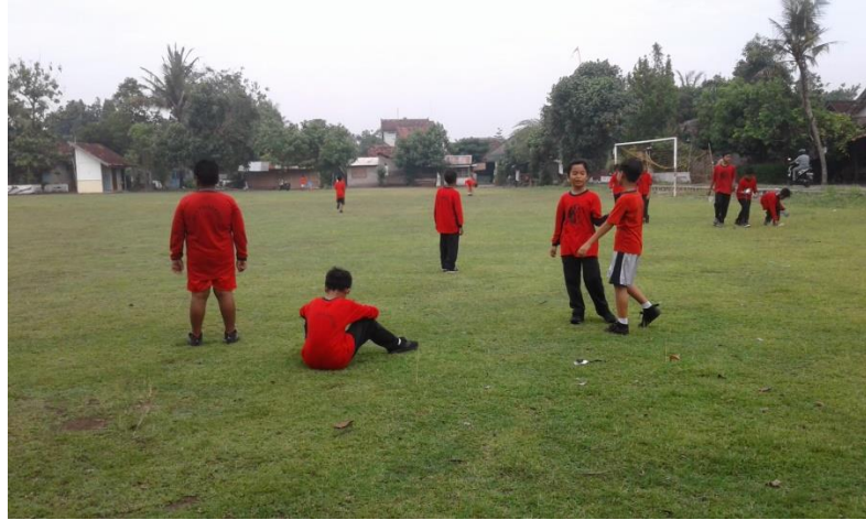
Gambar 18. Kegiatan pendampingan peserta didik berkebutuhan khusus saat pelajaran olahraga.