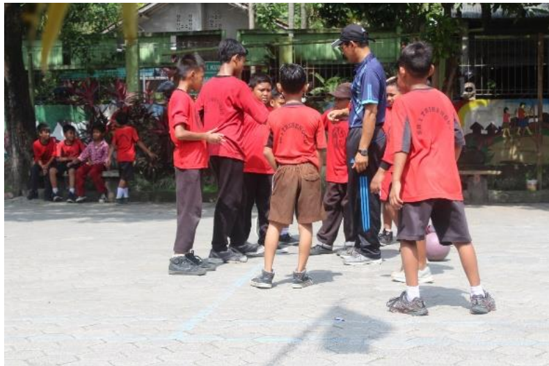
Gambar 15. Peserta didik bertanding futsal mini di halaman sekolah sebagai salah satu acara dalam rangkaian kegiatan Class Meeting yang diselenggarakan oleh mahasiswa PLT.