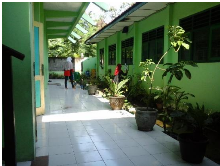
Gambar 6. Kegiatan kerja bakti untuk persiapan Adiwiyata Tingkat Nasional yang dilaksanakan bersama para guru, karyawan, orangtua/wali siswa dan mahasiswa PLT.