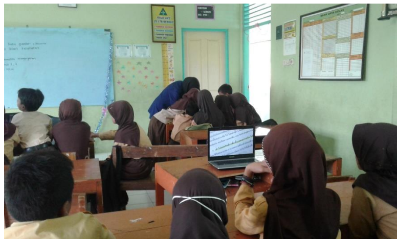
Gambar 9. Pelaksanaan sosialisasi penerimaan sosial ABK pada peserta didik secara umum yang diselenggarakan di kelas 5