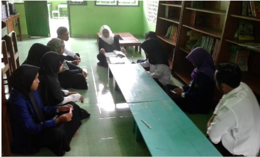
Gambar 12. Rapat koordinasi seluruh mahasiswa PLT dengan Kepala SD Negeri 1 Trirengo guna membahas keberlangsungan program PLT.