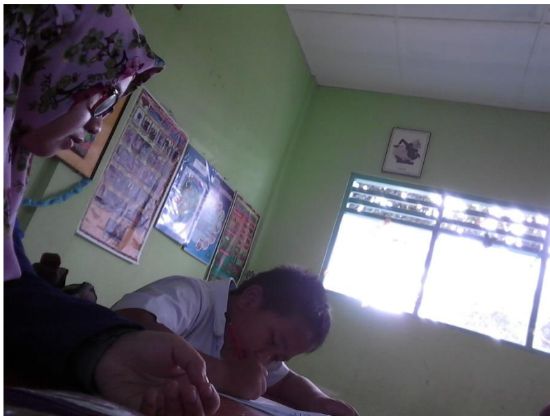
Gambar 16. Kegiatan pendampingan peserta didik berkebutuhan khusus saat berada di dalam kelas.