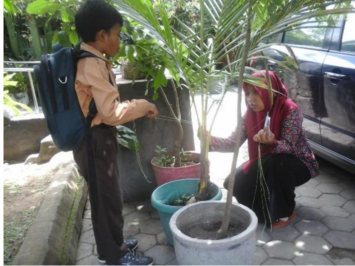
Gambar 7. Kegiatan pelabelan tanaman yang ada di sekolah sebagai salah satu rangkaian kegiatan untuk persiapan Adiwiyata Tingkat Nasional.