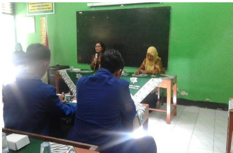
Gambar 20. Penarikan mahasiswa PLT yang dihadiri oleh Dosen Pembimbing Lapangan dibersamai oleh para guru dan karyawan SD Negeri 1 Tirirenggo.