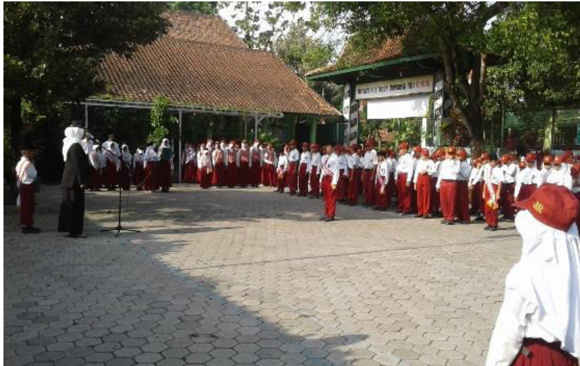
Gambar 4. Pelaksanaan Upacara Bendera dalam rangka Memeringati Hari Pahlawan 10 Nopember 2017 di halaman sekolah.