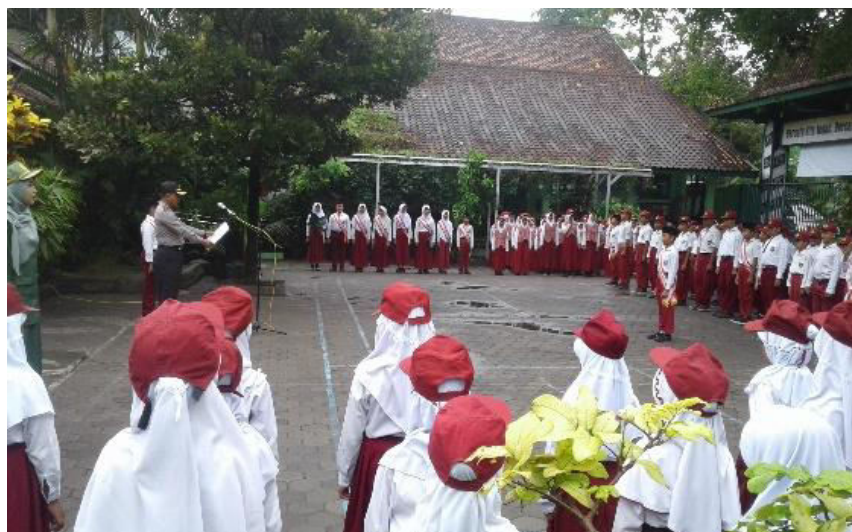
Gambar 3. Pelaksanaan Upacara Bendera rutin setiap hari Senin di halaman sekolah.