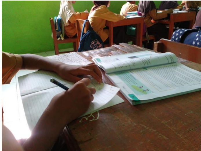
Gambar 16. Kegiatan pendampingan peserta didik berkebutuhan khusus saat berada di dalam kelas.