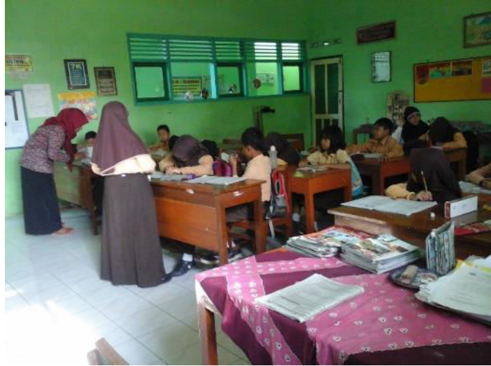
Gambar 1. Mahasiswa ikut serta membantu proses Kegiatan Belajar Mengajar dengan mengisi (mengajar) di kelas secara klasikal (kelas besar).