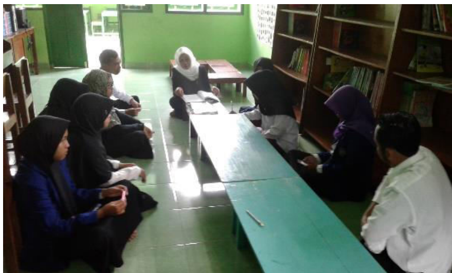
Gambar 12. Rapat koordinasi seluruh mahasiswa PLT dengan Kepala SD Negeri 1 Trirenggo guna membahas keberlangsungan program PLT.