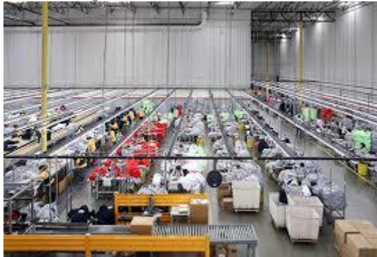
Gambar 5. Ilustrasi bagian sewing

Penjahitan atau sewing adalah tahap penggabungan komponen-komponen pakaian menjadi pakaian utuh. Bagian ini merupakan bagian yang paling banyak jumlah tenaganya dan variasi mesin-mesin yang digunakannya. Jumlah tenaga kerja yang banyak karena setiap mesin garmen dioperasikan oleh satu orang. Setiap operator mesin hanya mengerjakan satu jenis pekerjaan misalnya memasang saku saja, atau menyambung kerah saja, dan sejenisnya. Untuk itu target waktu setiap proses sangat ditekankan.