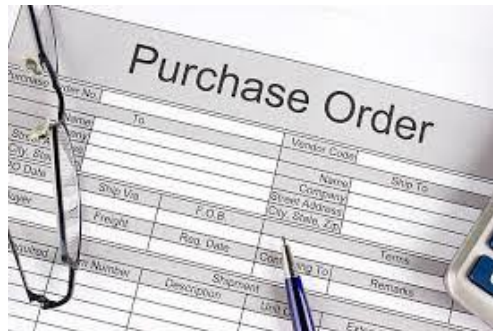
Gambar 1. Ilustrasi PO (Purchaser Order/Nota Pemesanan)

Pemesanan bahan baku terutama kain dan aksesorisnya sesuai spesifikasi permintaan dari pembeli (buyer). Tahap Pemesanan ini sangat penting karena jika bahan tidak diterima seluruhnya atau sebagian pada waktu jadwal running produksi untuk jenis pakaian (style garment) tersebut, beresiko menimbulkan keterlambatan pengiriman nantinya.