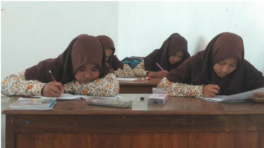
Gambar 2. Proses belajar siswa