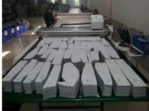
Gambar 4. Ilustrasi cutting

Kain yang sudah diinspeksi dan dinyatakan lolos lalu dilakukan “relaksasi” atau diurai dari gulungan dan didiamkan selama minimal 12 jam. Selanjutnya kain digelar (ditumpuk berlapis) dengan tinggi tumpukan tidak melebihi kemampuan mesin potong. Kain digelar sesuai dengan panjang marker yang dibuat. Marker yang telah dibuat lalu disimpan di bagian paling atas tumpukan dan selanjutnya diberi penjepit atau pemberat agar tidak berubah. Proses pemotongan bahan dilakukan dengan mengikuti gambar pola yang tercetak pada marker menembus lapisan bahan.