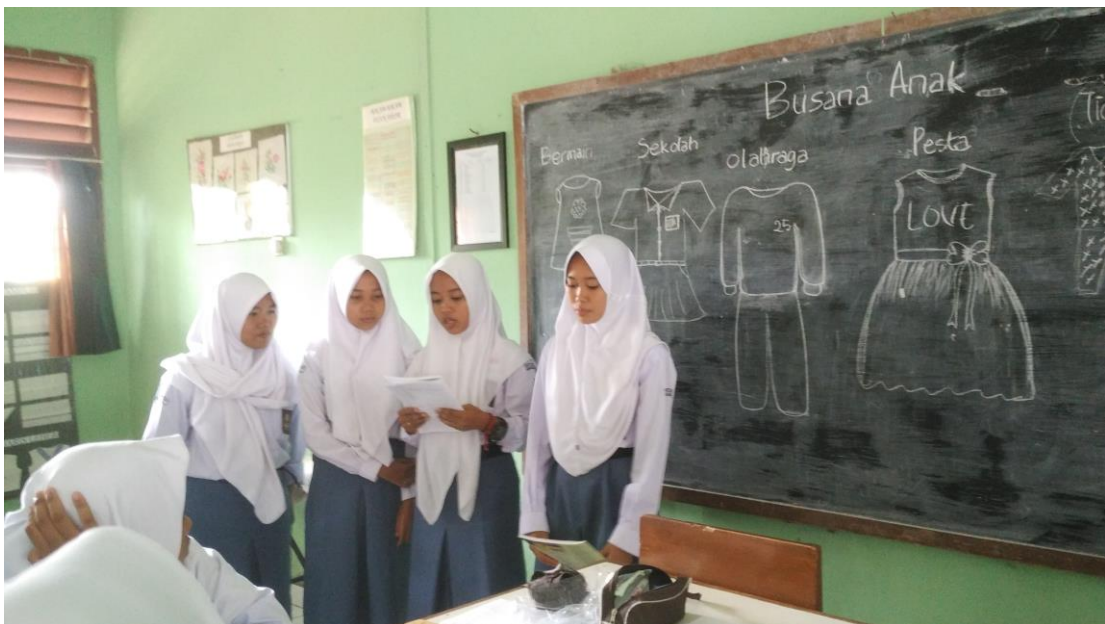
Gambar 3. Presentasi oleh siswa X BB 1