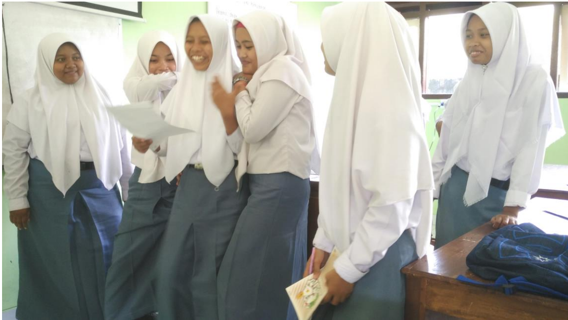
Gambar 1. Presentasi siswa XI BB2