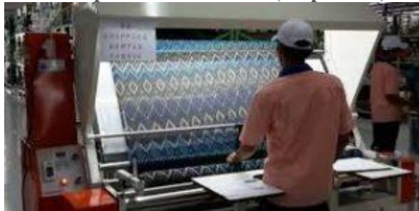
Gambar 2. Ilustrasi inspeksi kain.

Bahan baku seperti kain dan aksesorisnya sebelum digunakan, terlebih dahulu harus dicek kualitas dan kuantitasnya untuk mengetahui layak dan tidaknya bahan baku tersebut diproses selanjutnya. Bahan baku yang tidak layak (reject) harus dipisahkan sebelumnya, sehingga tidak menjadi beban produksi yaitu memproses bahan yang tidak bisa dijual.