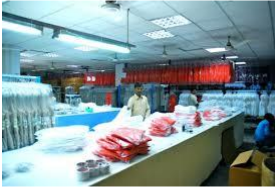
Gambar 6. Ilustrasi bagian finishing

Tahap akhir atau finishing meliputi quality control (pengecekan) final pada pakaian yang sudah jadi dan proses pengepakan sesuai permintaan buyer. Pada pakaian yang tidak lolos atau cacat produksi apabila masih bisa diperbaiki maka dilakukan proses perbaikan sedangkan yang tidak bisa diperbaiki dikelompokkan ke produk reject. Produk reject ini tergantung dari buyer ada yang dibolehkan beredar ada yang harus dimusnahkan.