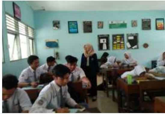
Pengajian Jumat pagi