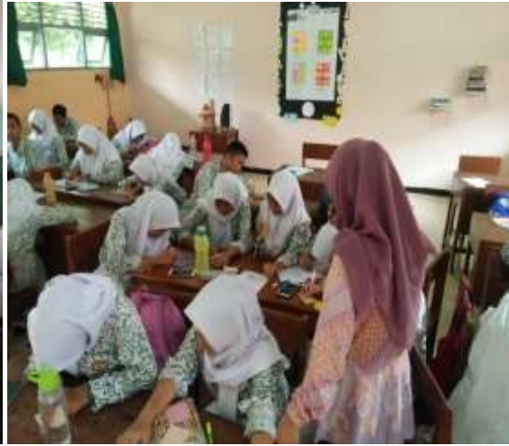
Surat career day