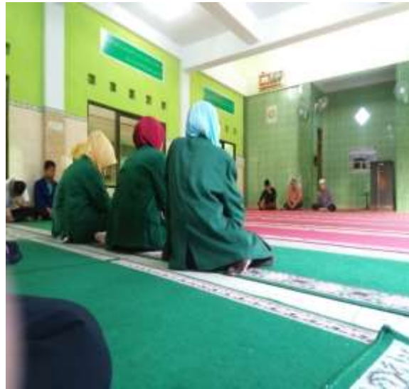
Kegiatan layanan kelas 11 ips 2