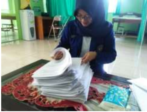
Hasil kegiatan layanan kelas 11 ips 1