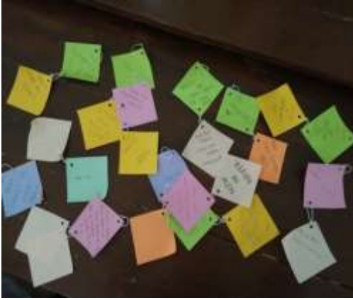
Hasil kegiatan layanan kelas 11 ips 3