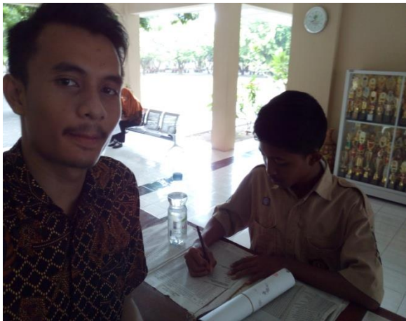
Gambar 1: Piket Loby