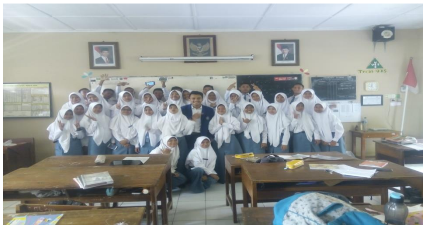
Gambar 3: Foto setelah mengajar pertemuan terakhir di X IPA 4