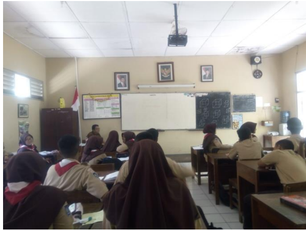
Gambar 2: Menemani teman seprodi mengajar