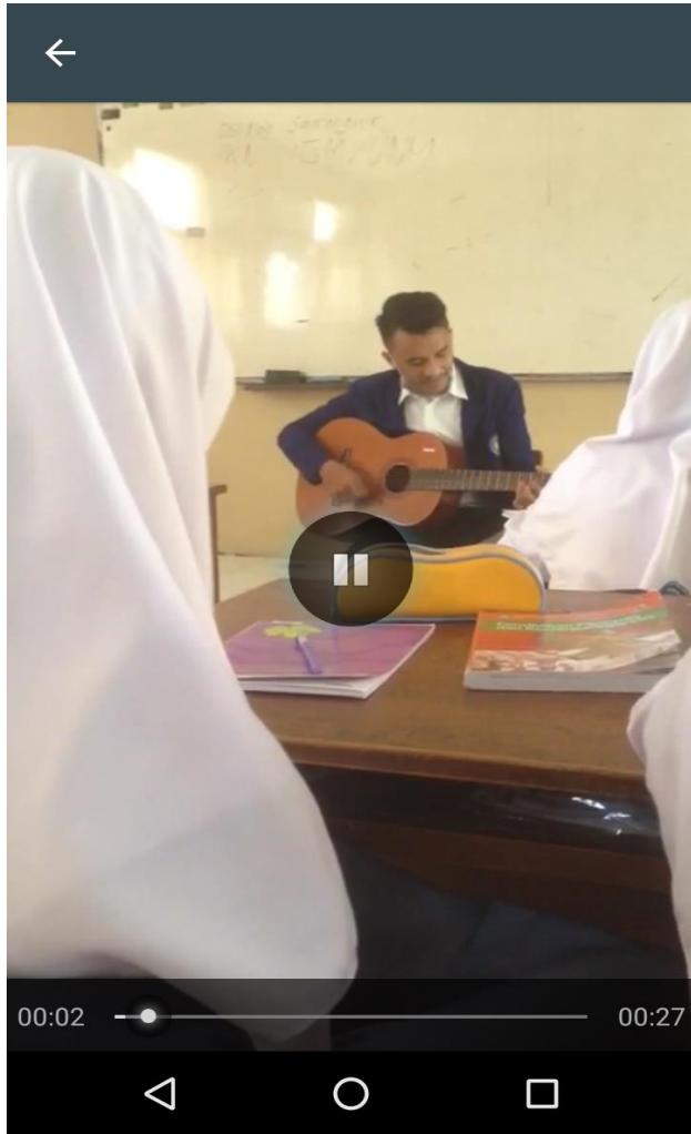
Gambar 5. Ice breaking di X IPS 3