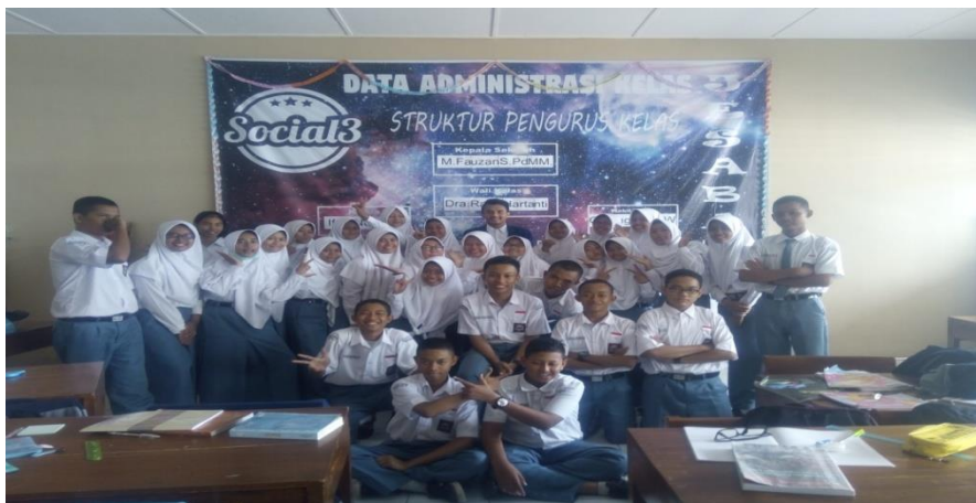
Gambar 4: Foto setelah mengajar pertemuan terakhir di X IPS 3